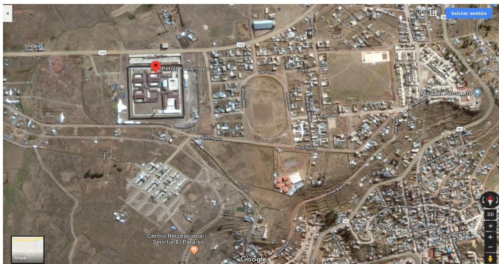
Ubicación geográfica del Establecimiento Penitenciario Puno.