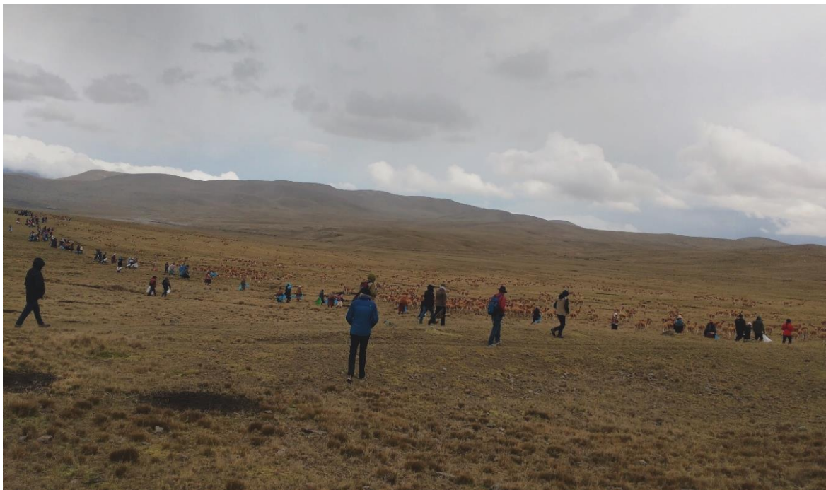
Figura 7. Arreo de vicuñas, sector Huancahuancani