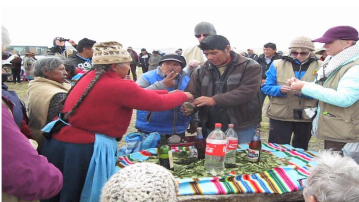
Figura 4. Ritual en el cerro Huancahuancani, antes del inicio del arreo