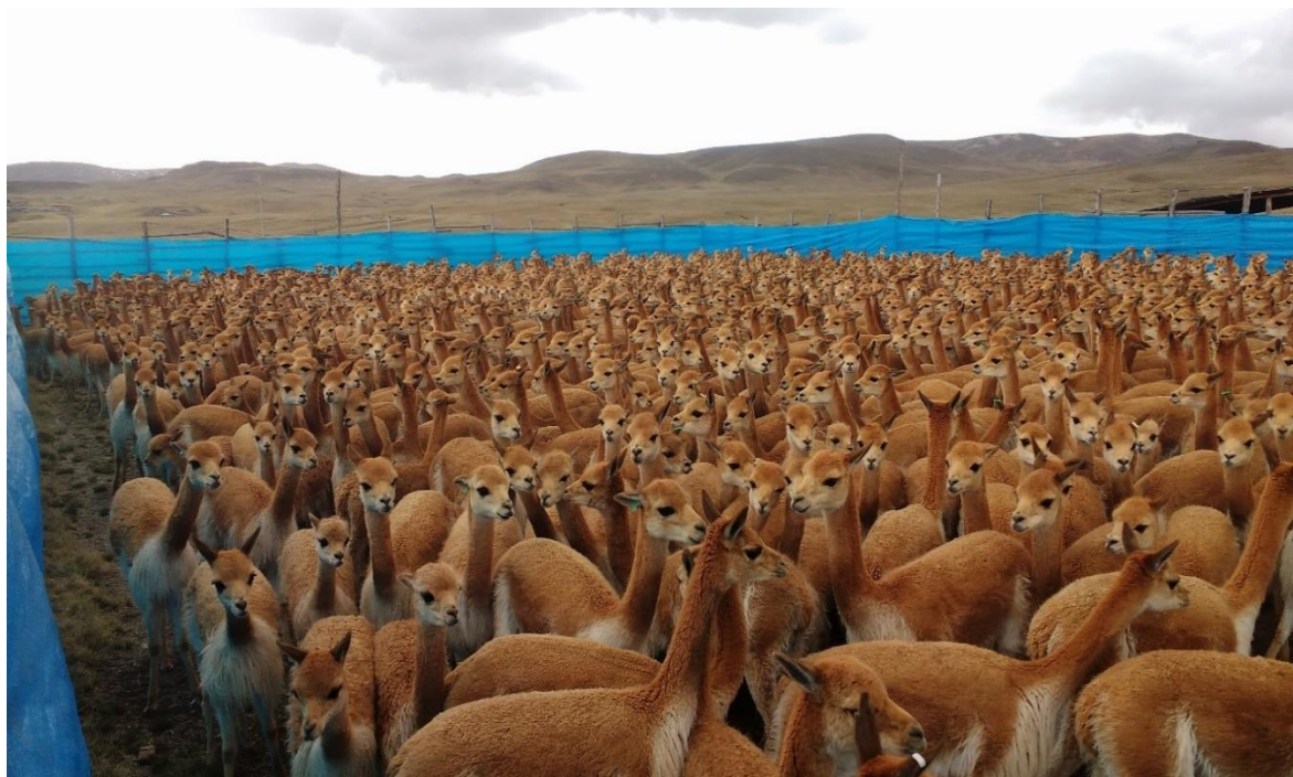
Figura 10. Vicuñas en encierro después del arreo