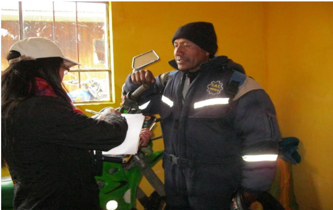
Figura 18. Entrevistando a un directivo