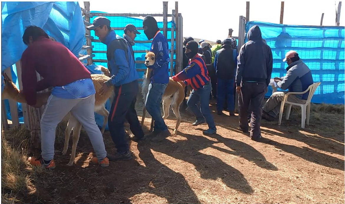
Figura 11. Selección de vicuñas para la esquila