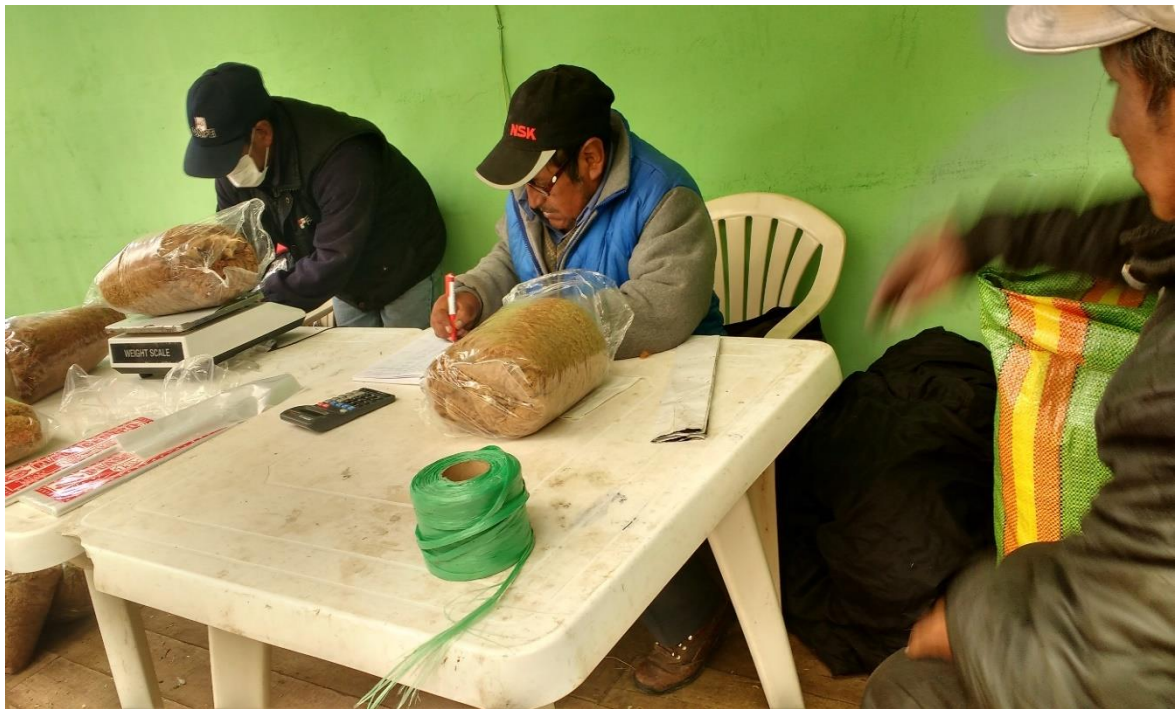
Figura 15. Pesado y registro de fibra