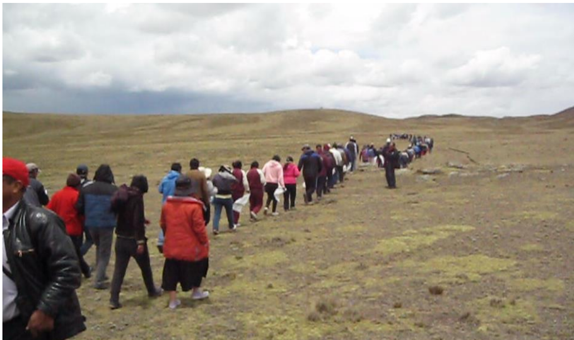
Figura 6. Empezando con la caminata para el arreo de vicuñas