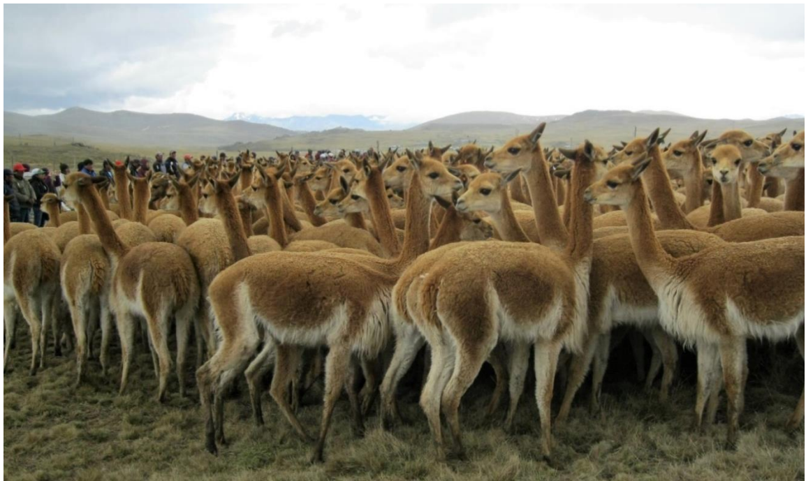
Figura 9. Arrinconando a las vicuñas hacia los corrales