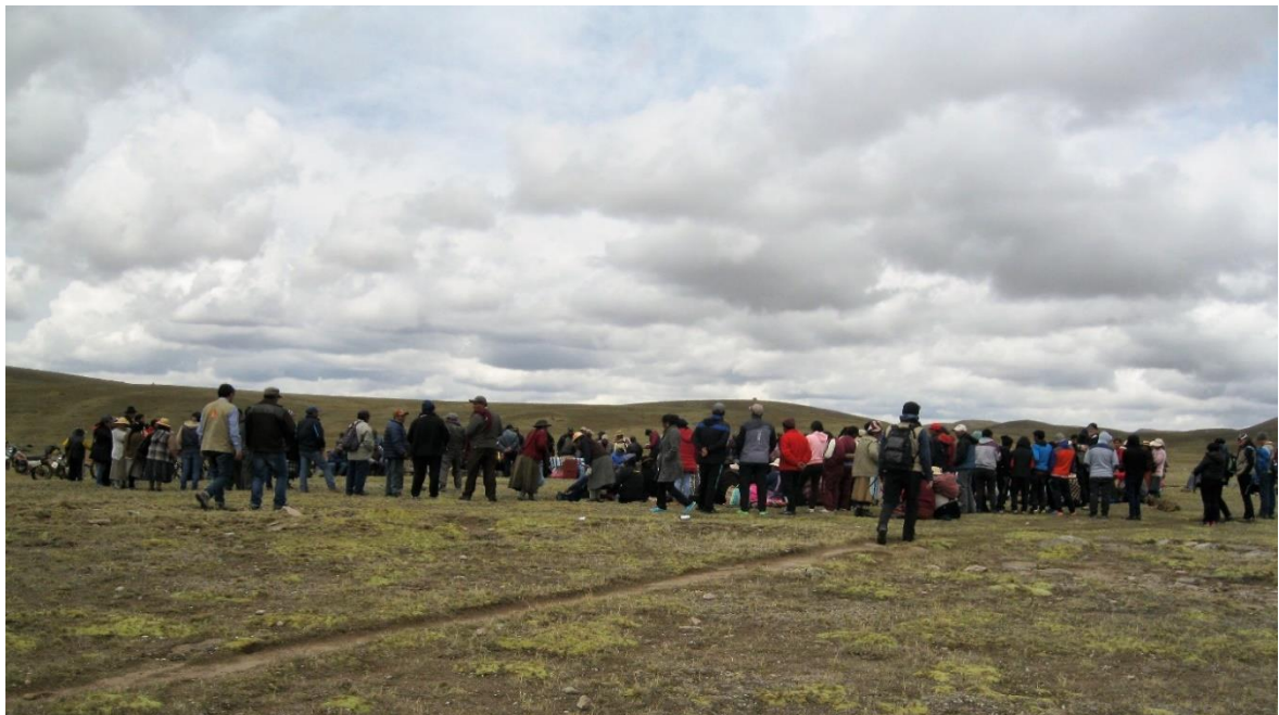
Figura 3. Concentración de socios, visitantes y autoridades en el cerro de Huancahuancani