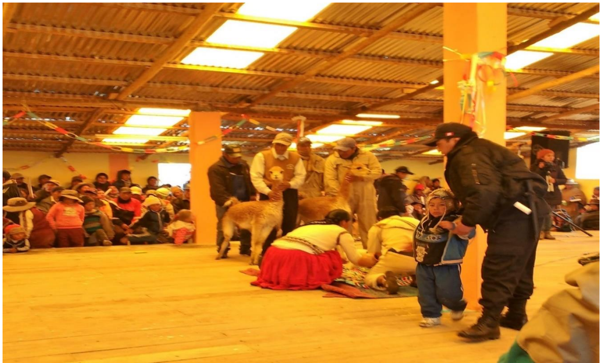
Figura 5. Ritual del matrimonio de vicuñas en las cabañas de la Multicomunal