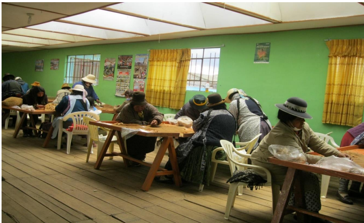
Figura 14. Proceso del predescerchado de la fibra de vicuña