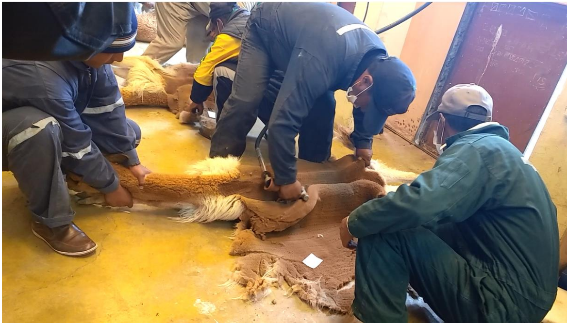
Figura 13. Proceso de la esquila en la playa de esquilamiento