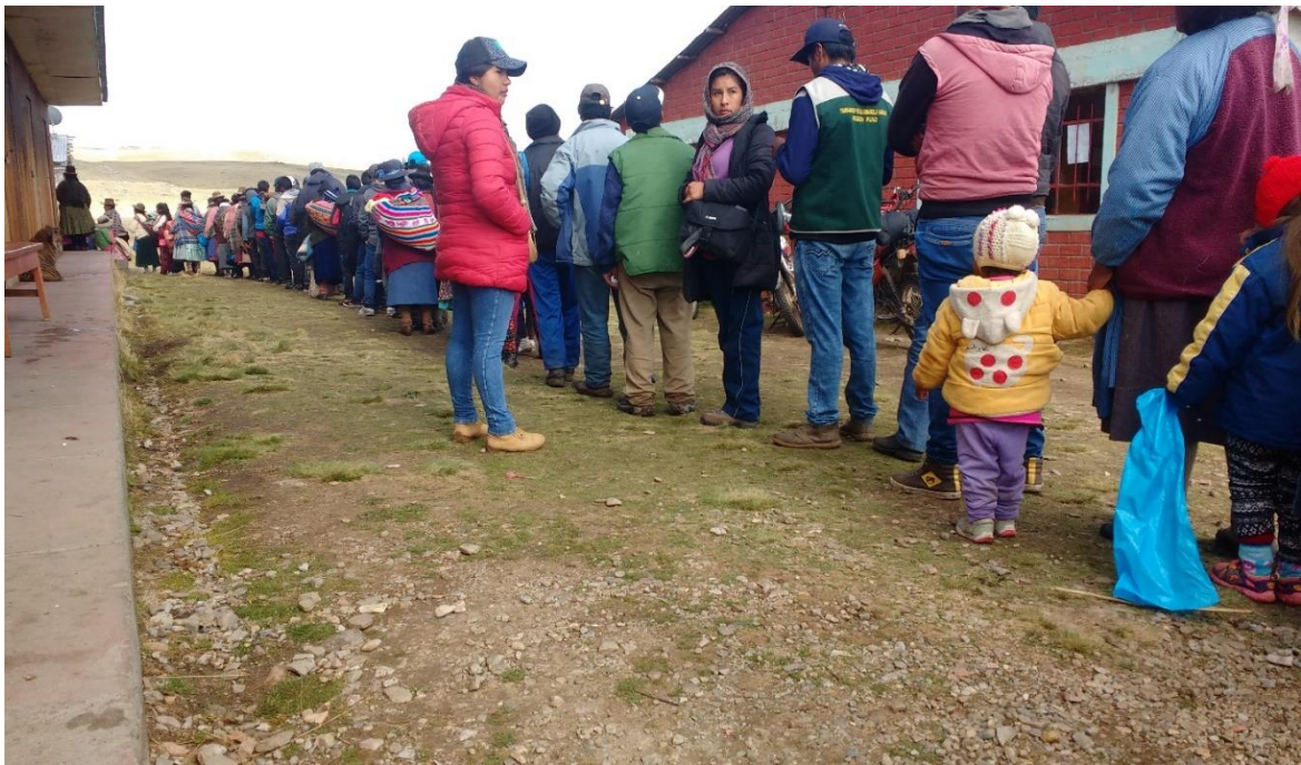
Figura 17. Haciendo cola para recibir los alimentos