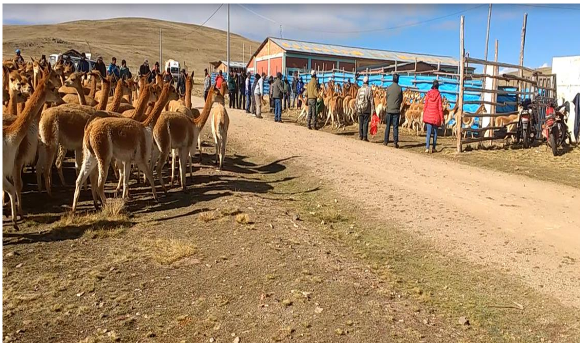
Figura 8. Arreo de vicuñas, sector Achayani hacia los corrales de encierro