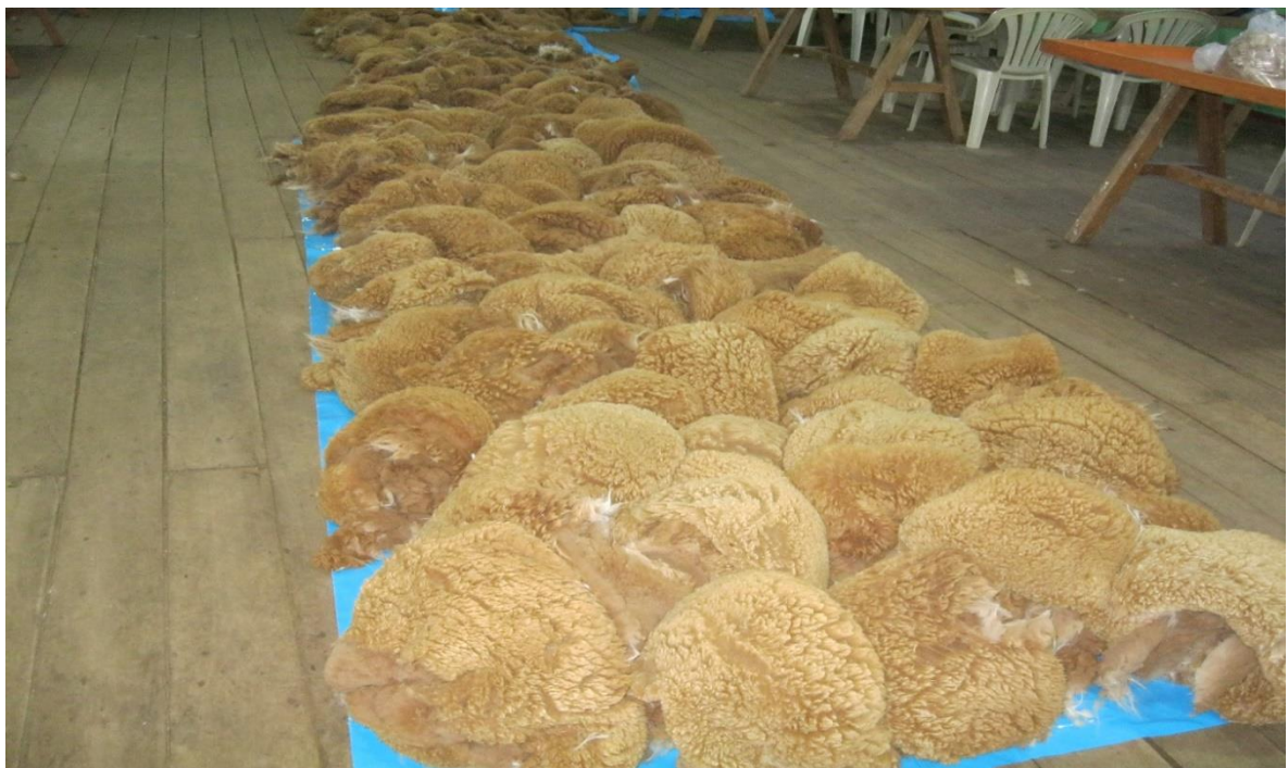
Figura 16. Fibra acumulada