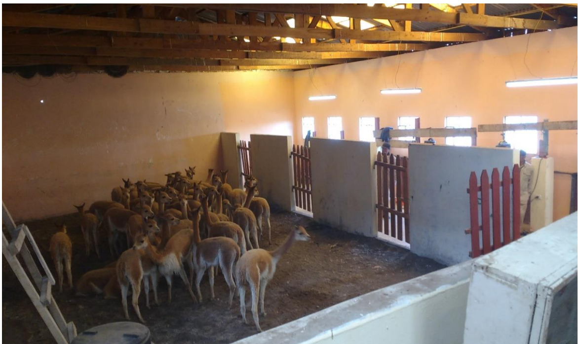
Figura 12. Vicuñas selectas para la esquila en el corral de selección