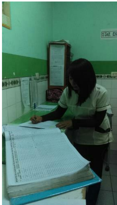
Realizando el registro de datos antropométricos de los recién nacidos.