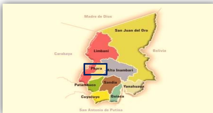
GRAFICO 01: UBICACIÓN DISTRITAL