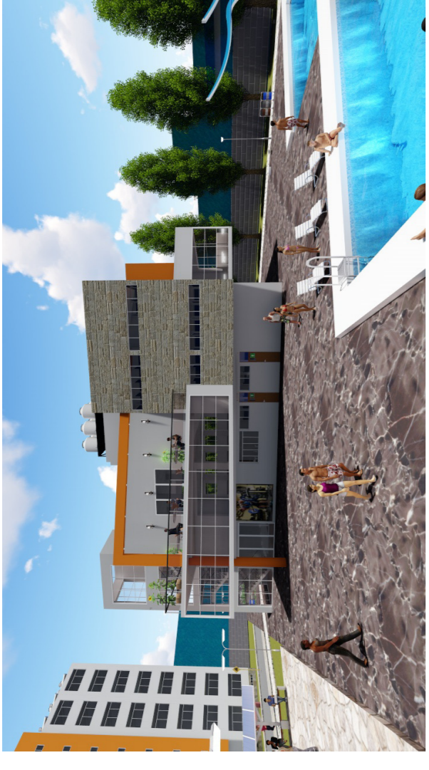
BLOQUE 04 EN RENDERISADO