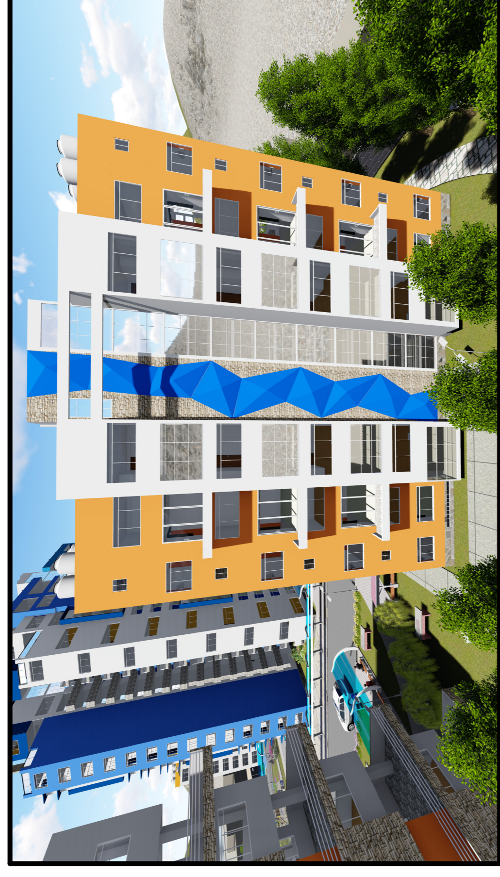
MODELADO 3D DE ELEVACION HACIA LA AV. EL PUERTO