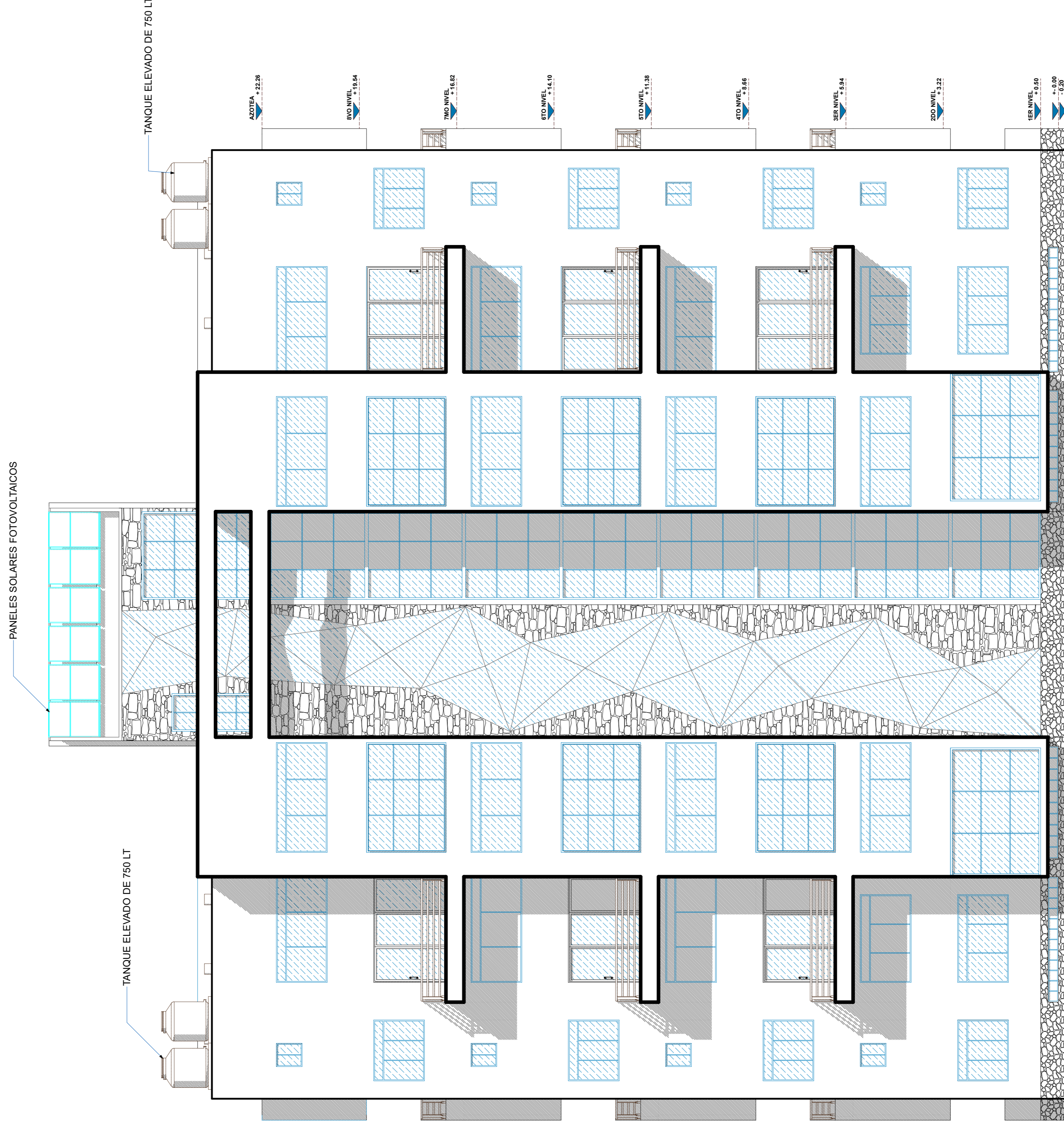
ELEVACION HACIA LA AV. EL PUERTO