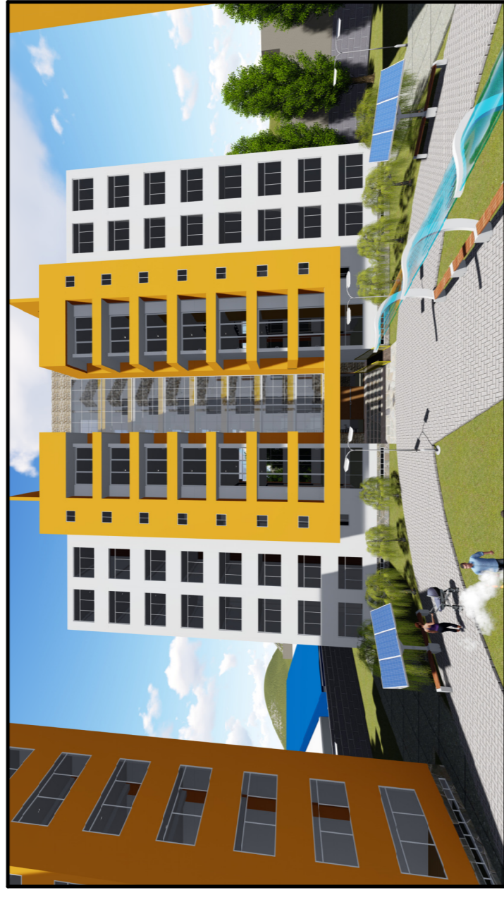
MODELADO 3D. FACHADA PRINCIPAL