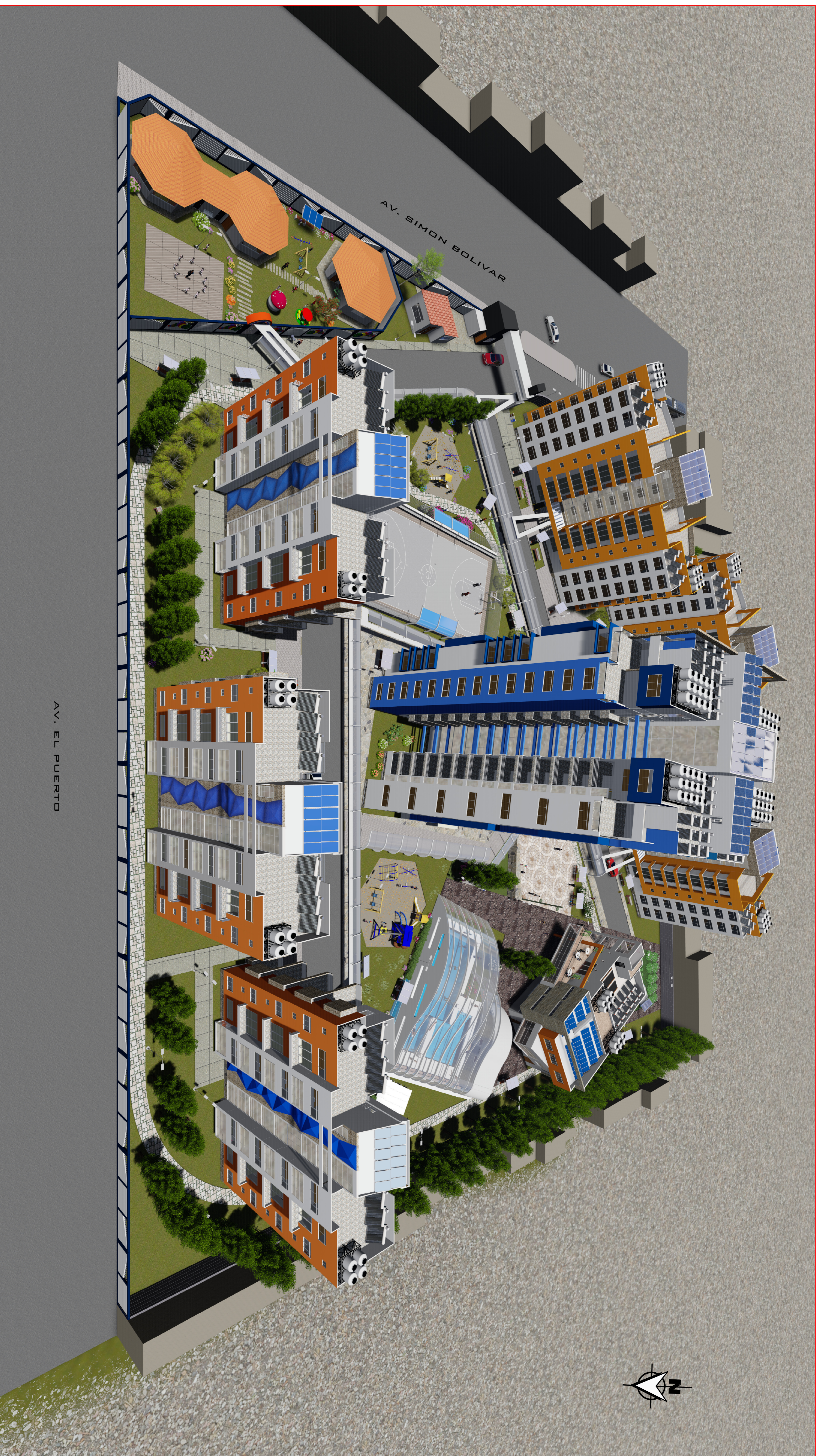
MODELADO 3D DEL CONJUNTO HABITACIONAL