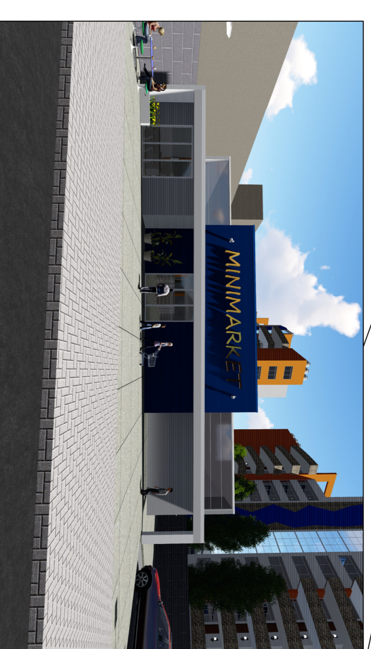
MODELADO DE 3D, MINIMARKET ZONA 03