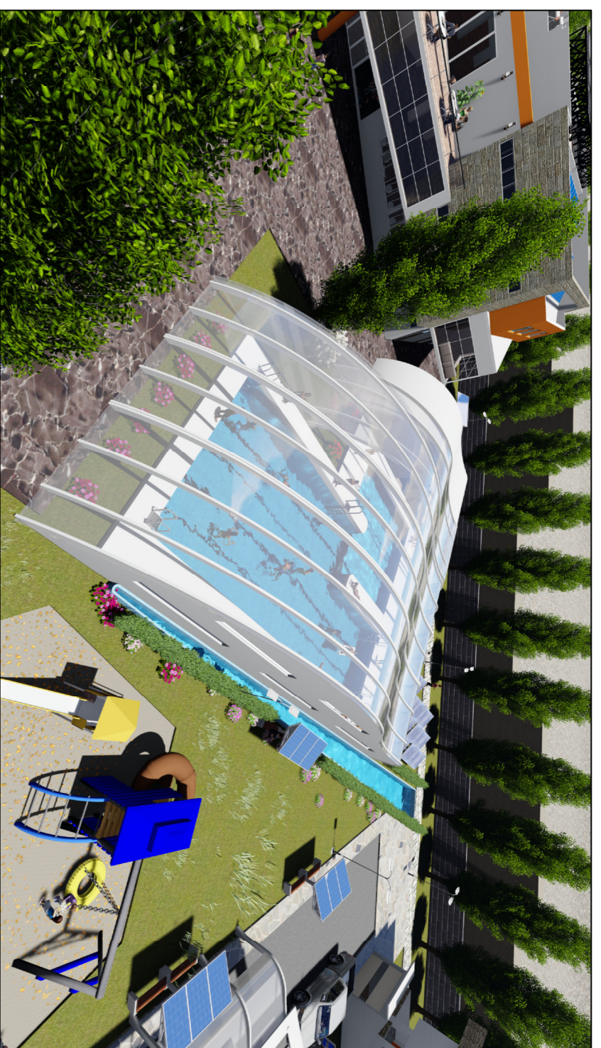
MODELADO DE 3D PISCINA ZONA 07