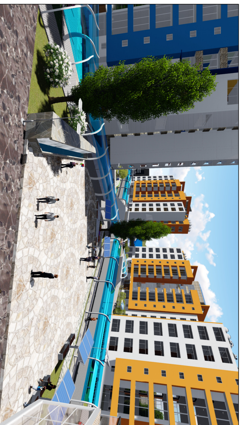
MODELADO DE 3D, PLAZOLETA ZONA 05