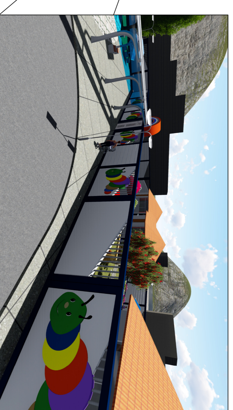
MODELADO DE 3D, INICIAL CICLO I GUNA ZONA 04