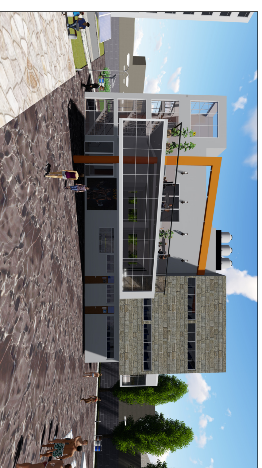
MODELADO DE 3D, SERVICIOS ZONA 02