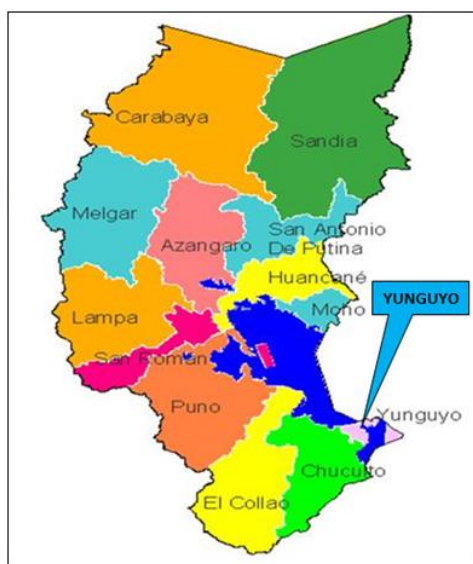
Figura 1: MAPA DEL DEPARTAMENTO DE PUNO