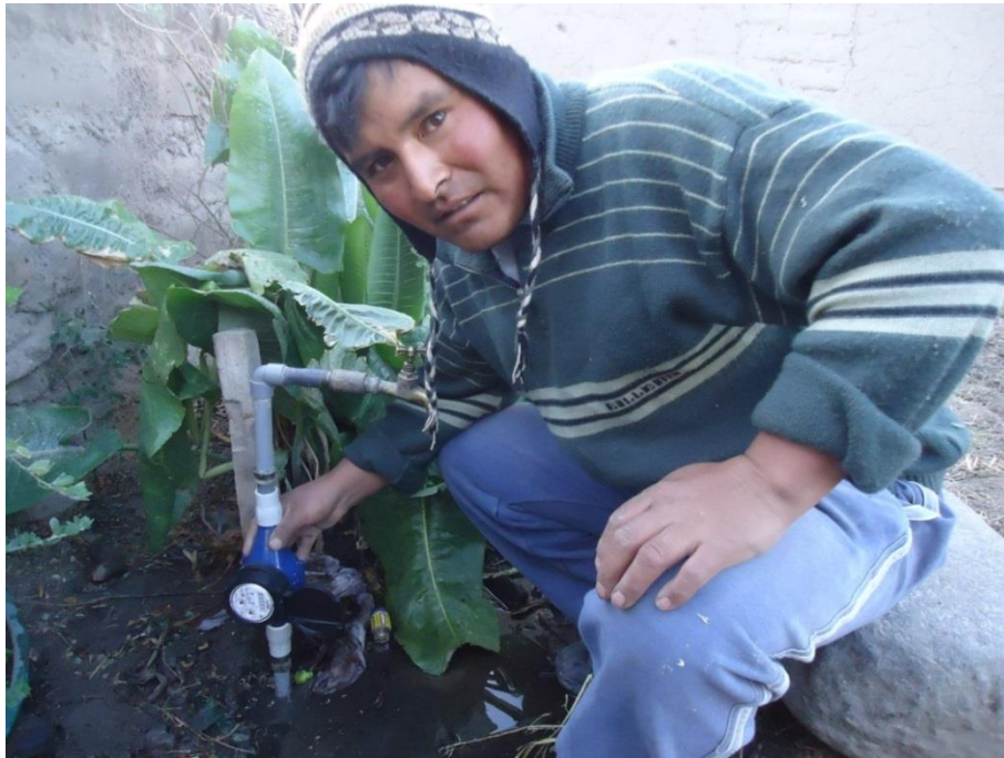
Figura 5: LECTURA DE CONSUMO PERCAPITA DE ABASTECIMIENTO POR GRAVEDAD