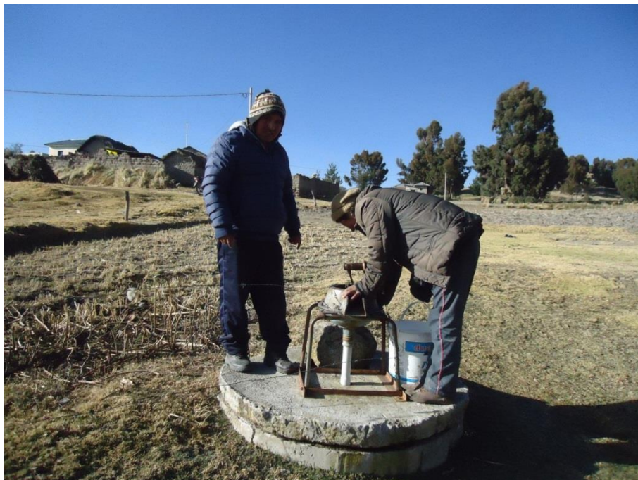
Figura 6: CONSUMO PER CAPITA EN ABASTECIMIENTO POR POZOS.