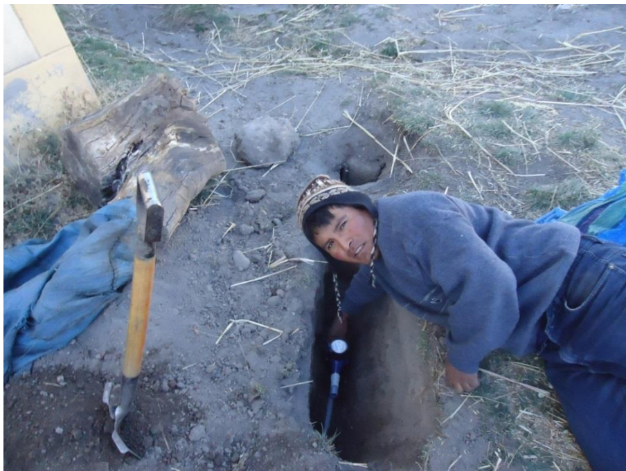
Figura 4: INSTALACIÓN DE MICROMEDIDORES VOLUMETRICOS EN ABASTECIMIENTO POR BOMBEO