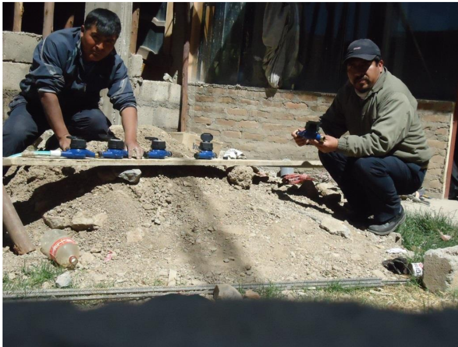
Figura 3: VERIFICACIÓN DE MICROMEDIDORES VOLUMETRICOS CON DIRECTOR DE TESIS