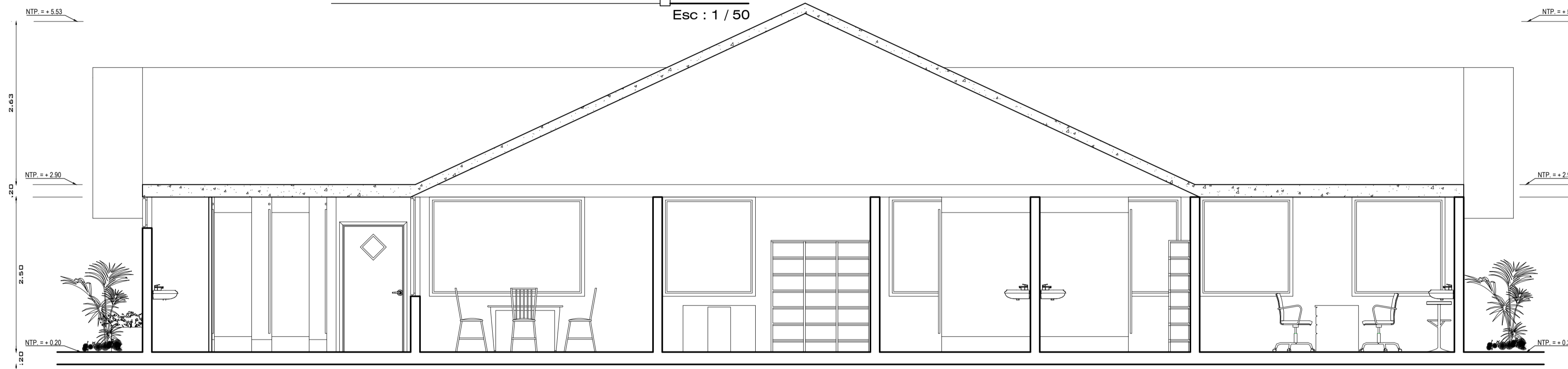
CORTE B - B