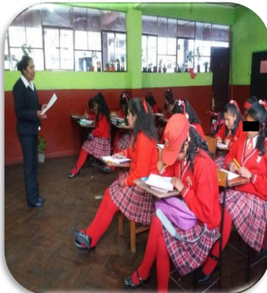
PRESENTACIÓN A LOS ESTUDIANTES DEL GRUPO CONTROL PARA SU COLABORACIÓN