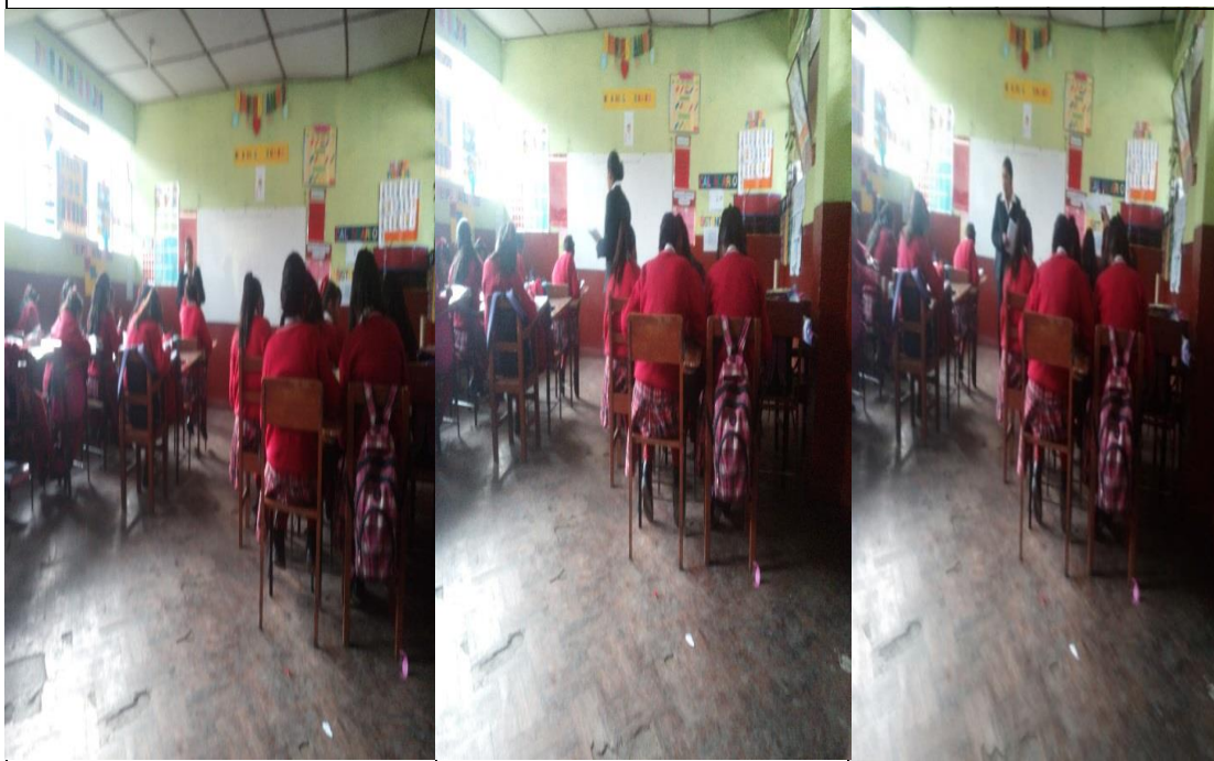
Desarrollo del cuestionario en el pre - test