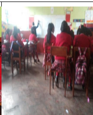
RECOPIACION DE SABERES PREVIOS