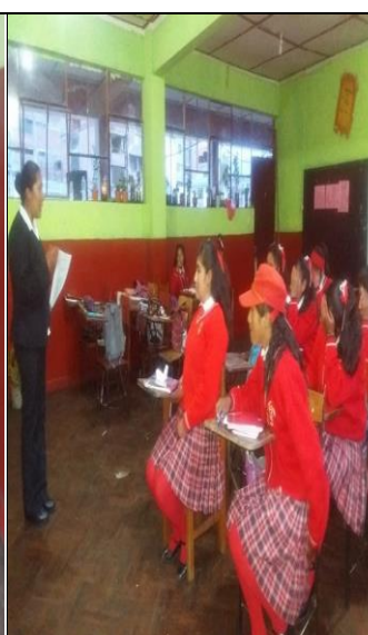
DESARROLLO DEL CUESTIONARIO EN EL POST- TEST DESPUES DE LAS TALLERES EDUCATIVOS