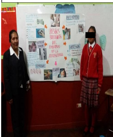
DESARROLLO DEL TEMA