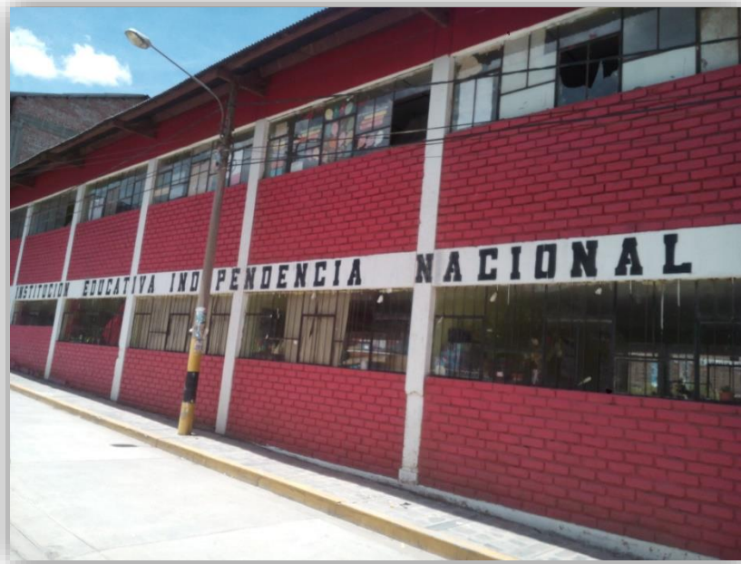
INSTITUCIÓN EDUCATIVA SECUNDARIA INDEPENDENCIA NACIONAL – PUNO