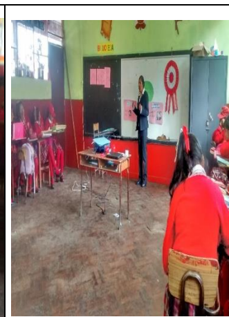
DESARROLLO DEL TEMA