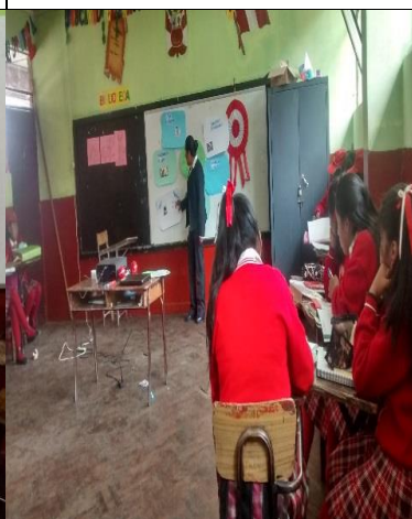
DESARROLLO DEL TEMA