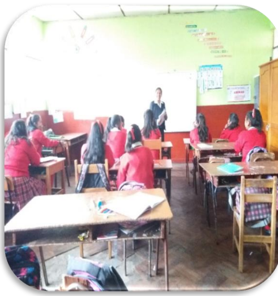
DESARROLLO DEL POST-TEST