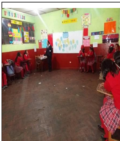
LLUVIA DE IDEAS