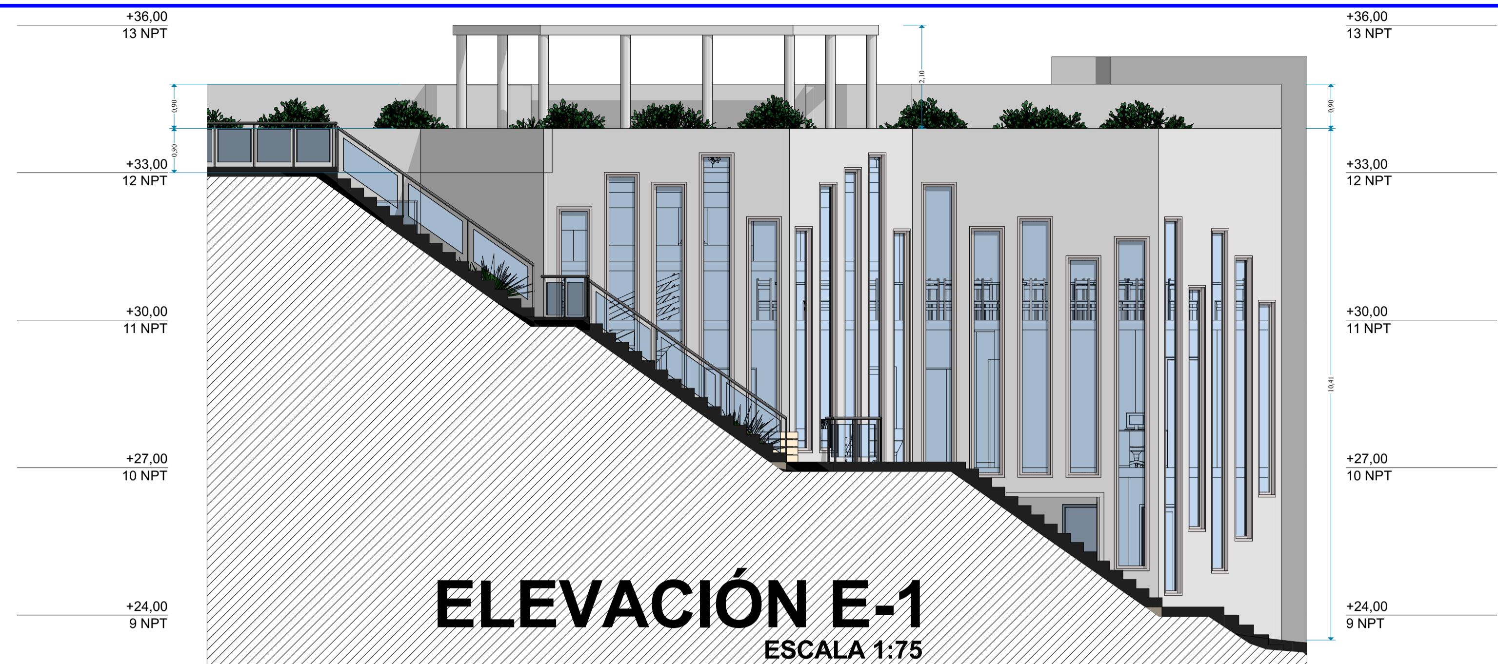
ELEVACIÓN E-1 ESCALA 1:75