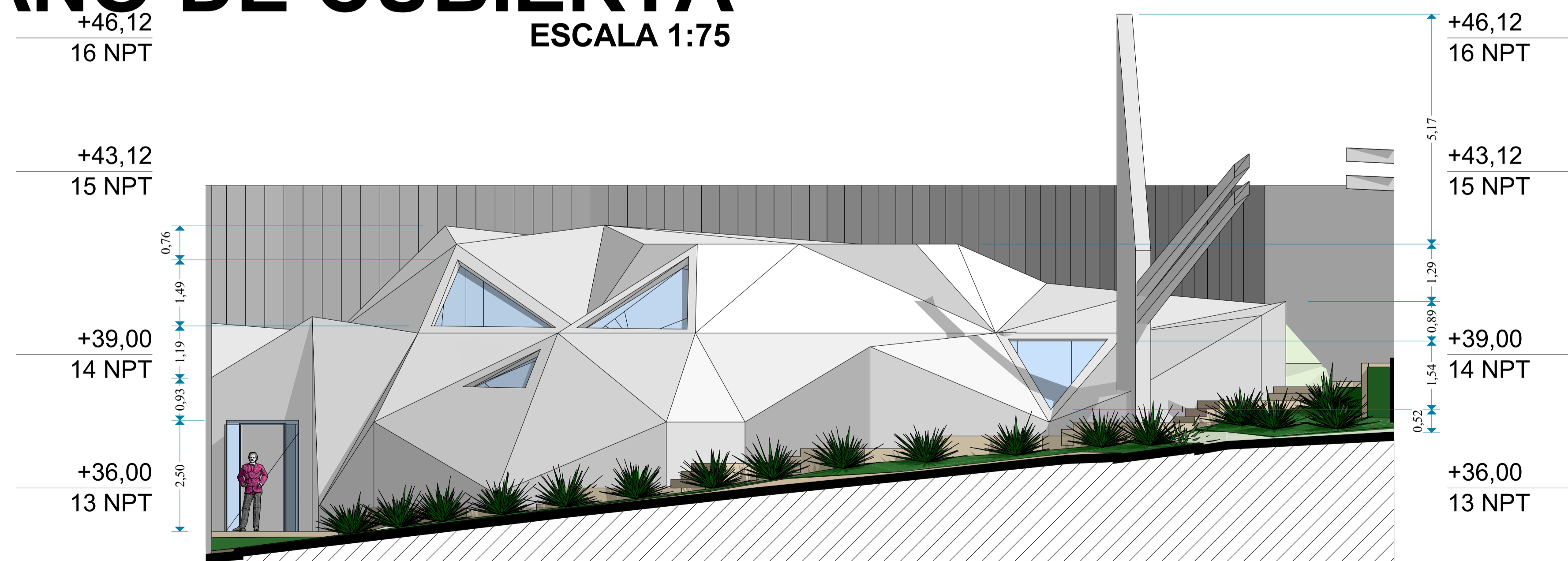
ELEVACION FRONTAL ESCALA 1:75