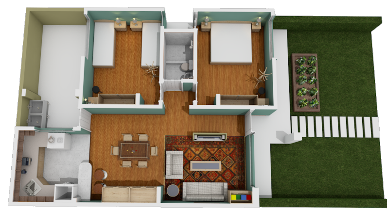
PERSPECTIVA EN PLANTA SEGUNDA ETAPA