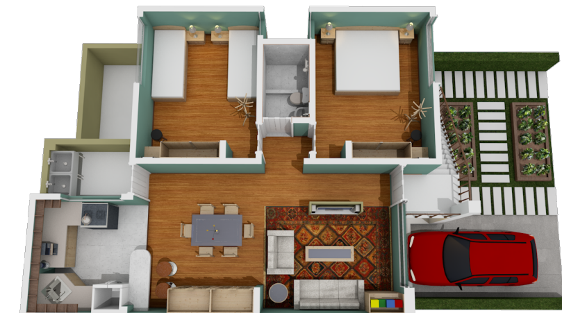
PERSPECTIVA EN PLANTA TERCERA ETAPA