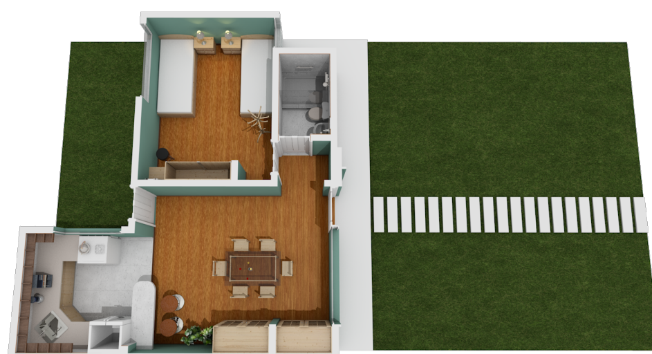
PERSPECTIVA EN PLANTA PRIMERA ETAPA

Para reducir los costos en acabados se tendra una segunda opcion: los muros solo seran impermeabilizados y acabados con juntas adhesivas y los marcos de las ventanas seran de madera esto reducira considerablemente en gastos, manteniendo la calidad estetica de la vivienda