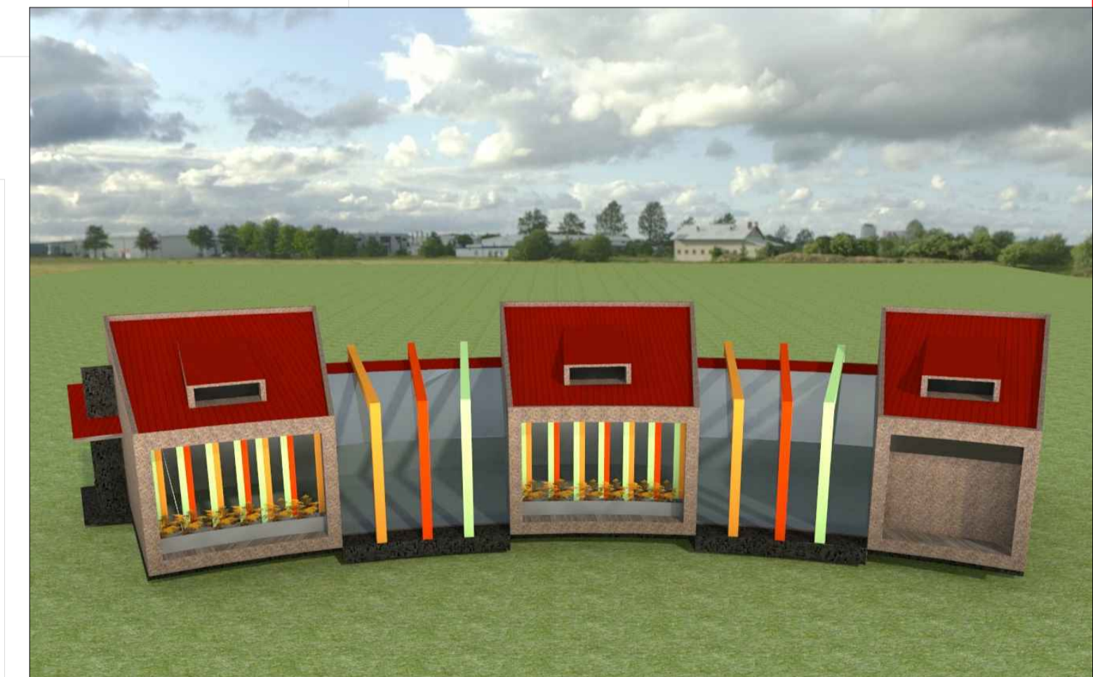
VISTA 3D ESCALA 1/75