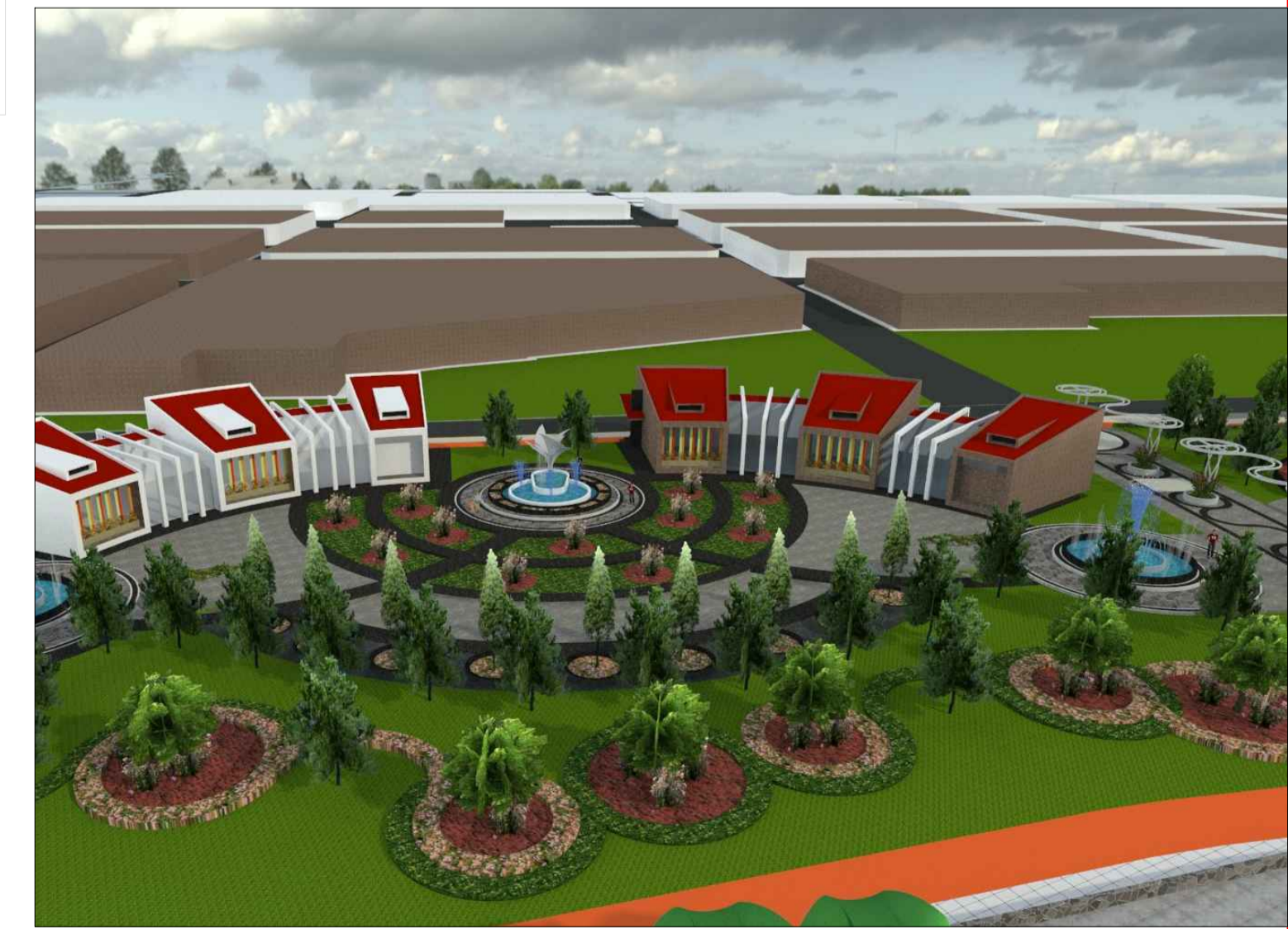
VISTA 3D ESCALA 1/75