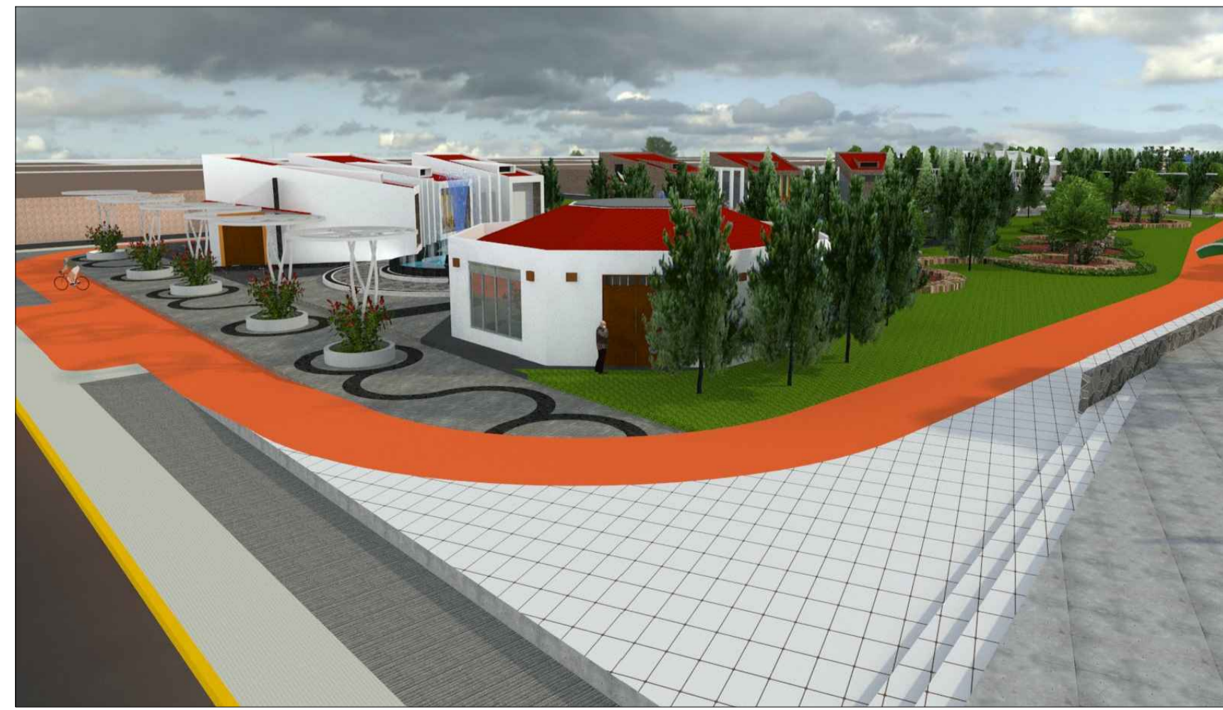
VISTA 3D - CICLOVIA ESCALA Grafico