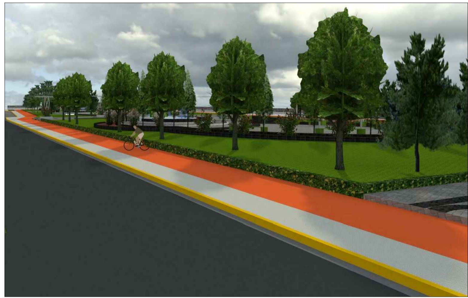
VISTA 3D - CICLOVIA ESCALA Grafico