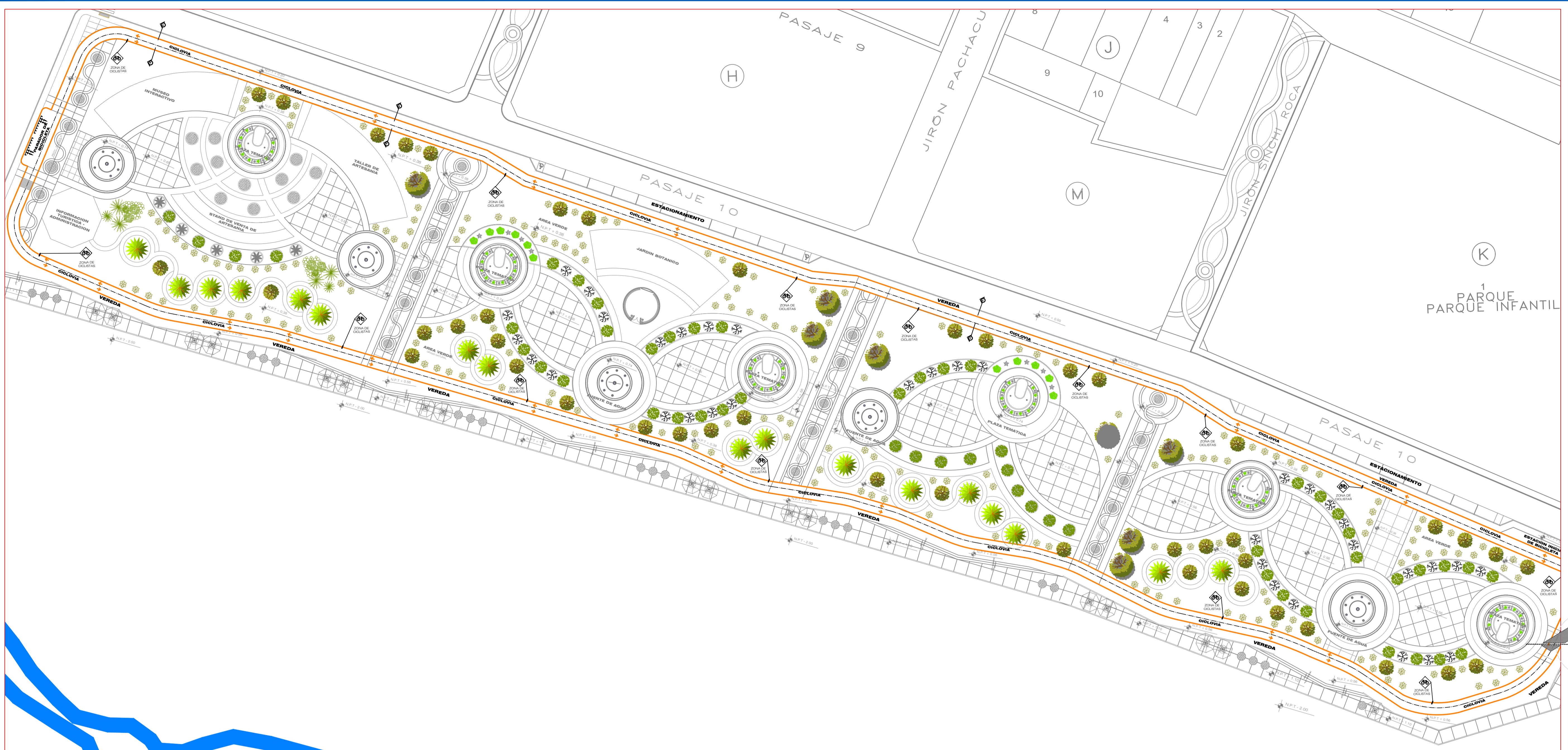
PLANTA - CICLOVIA ESCALA 1/500