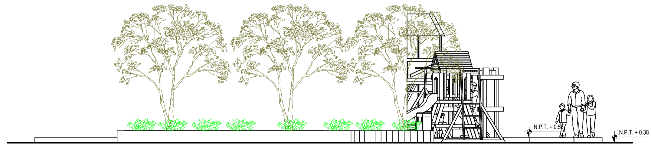
ELEVACION LATERAL ESCALA 1/50