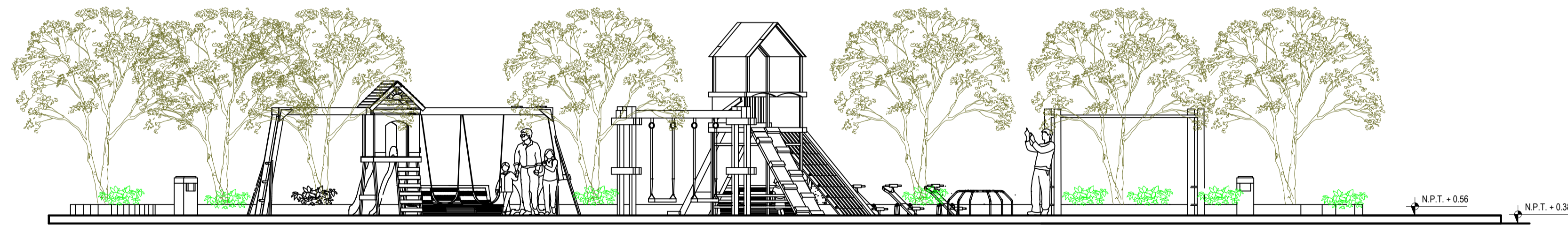
ELEVACION FRONTAL ESCALA 1/50