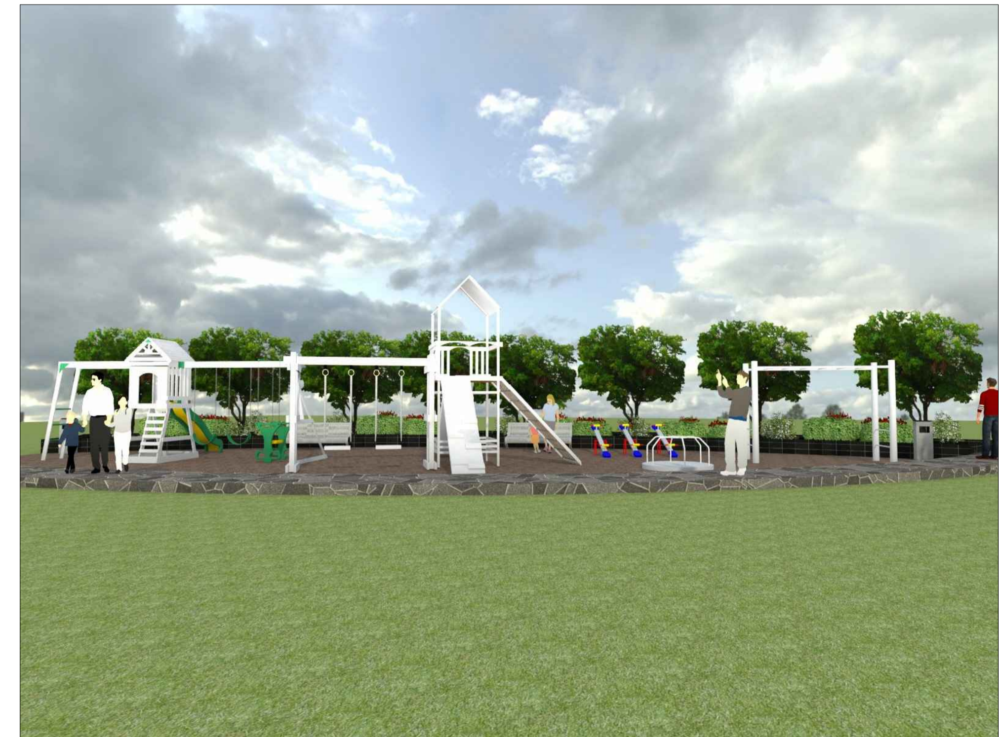
VISTA 3D - JUEGOS INFANTILES ESCALA 1/50