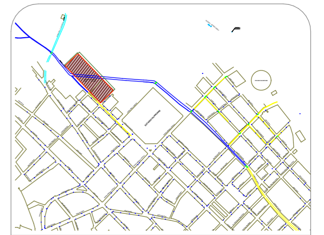
UBICACION DEL PROYECTO