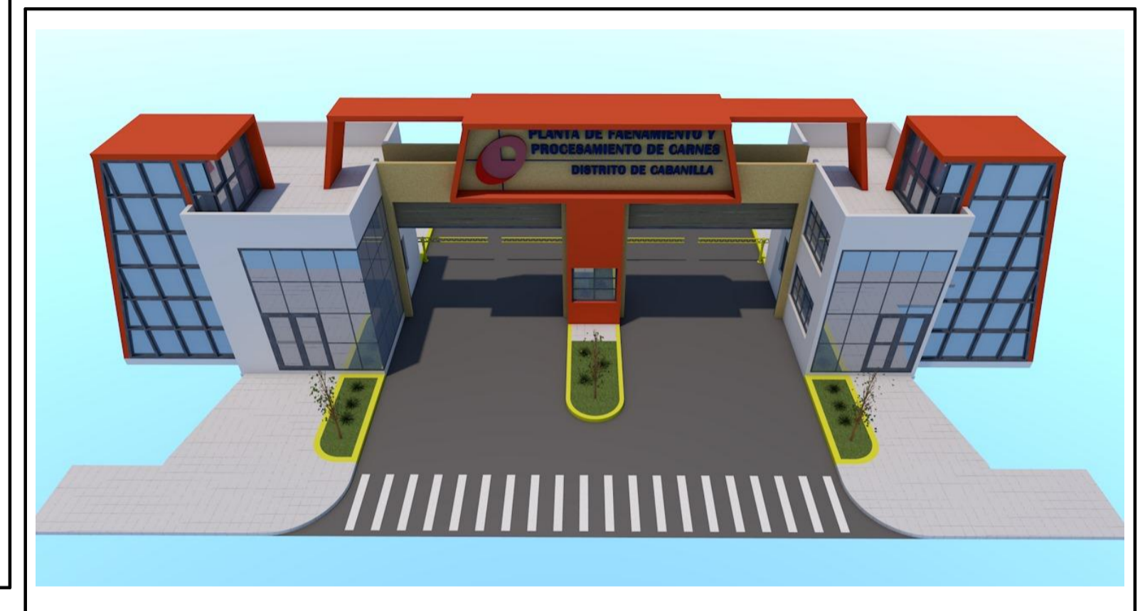
Dib R RENDER