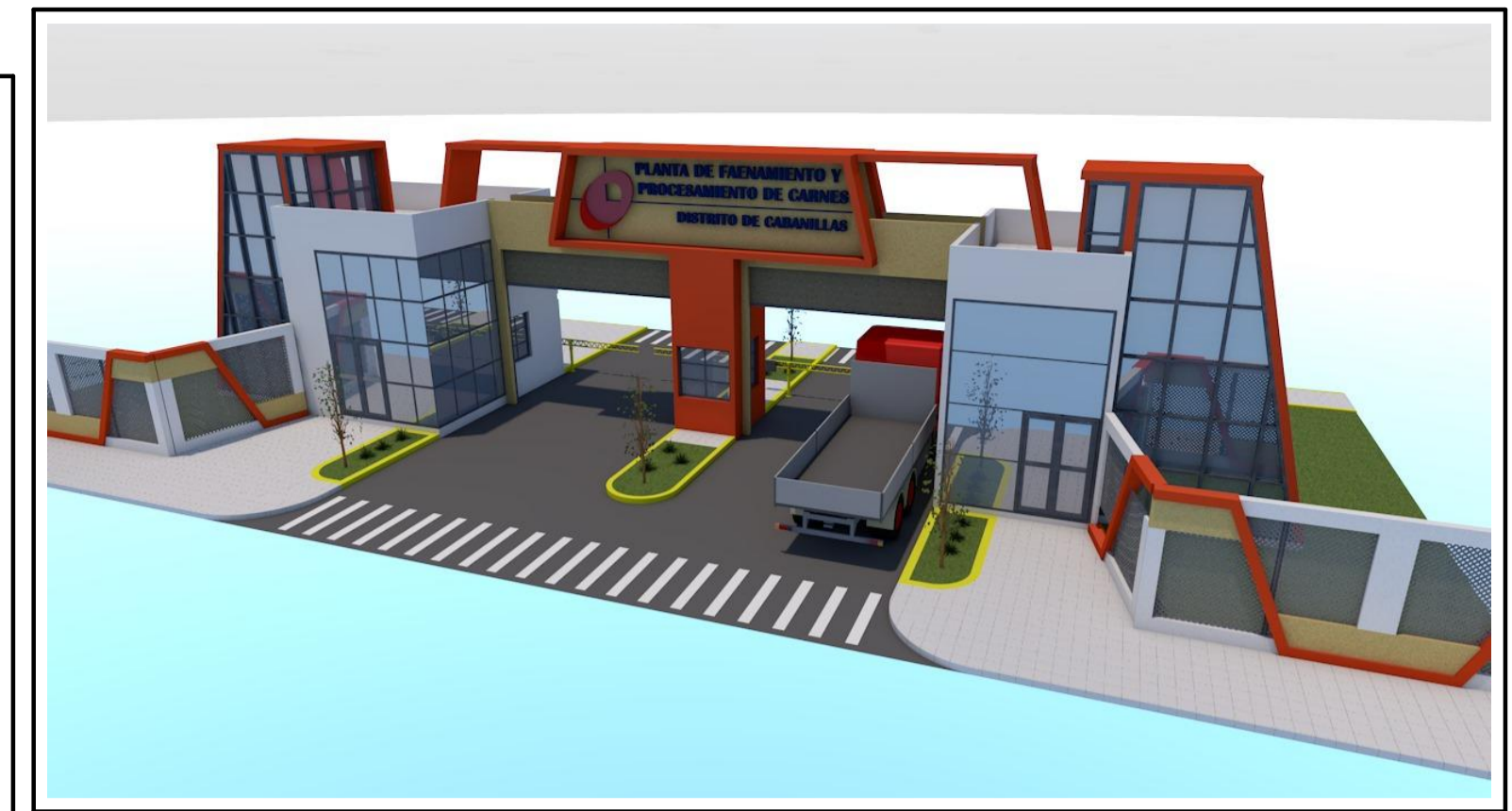
Dib R RENDER