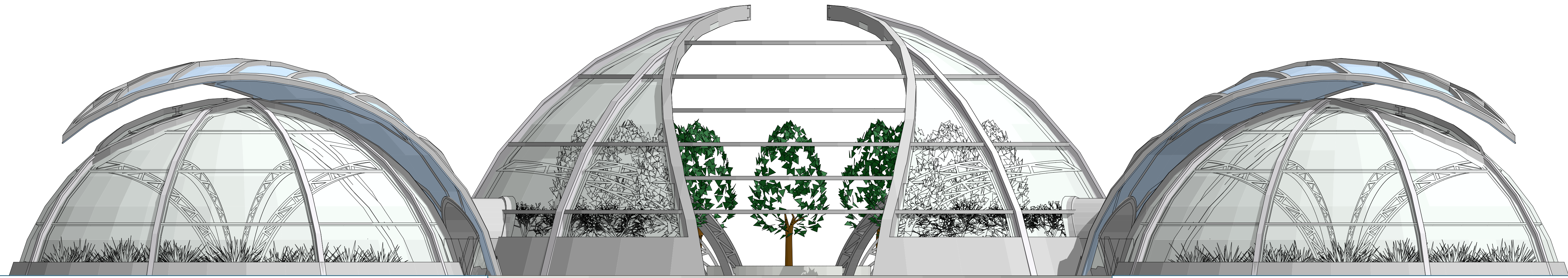
ELEVACIÓN "A-03" ESC:1/100