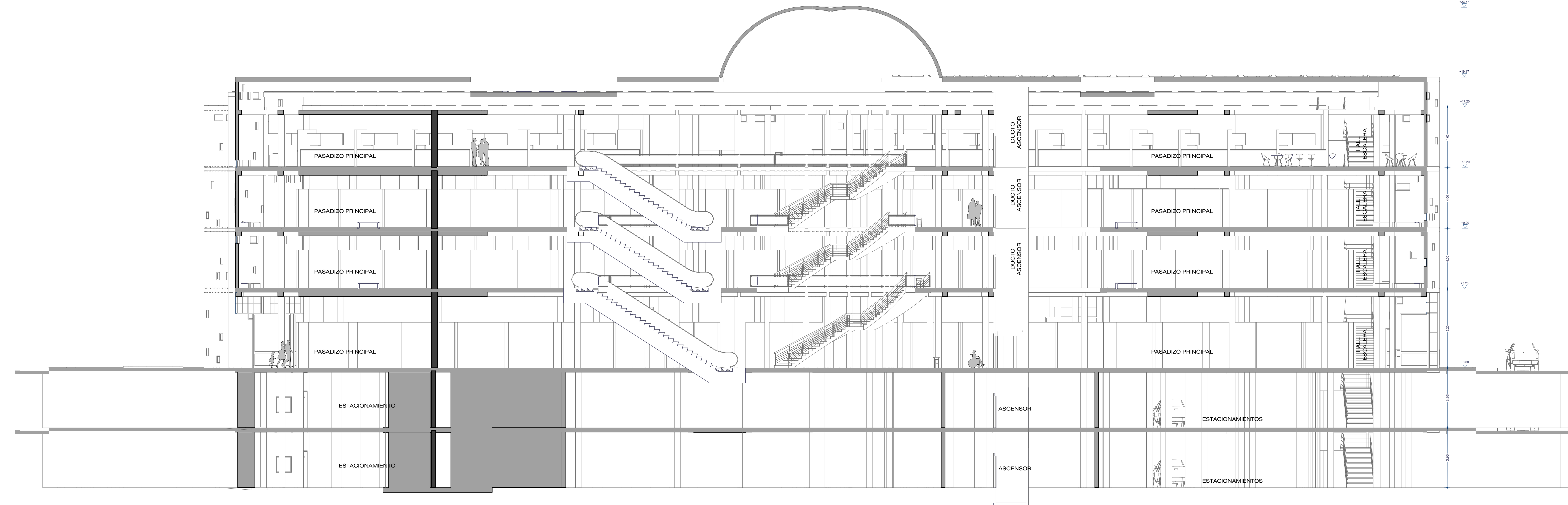
CORTE LONGITUDINAL 1:100