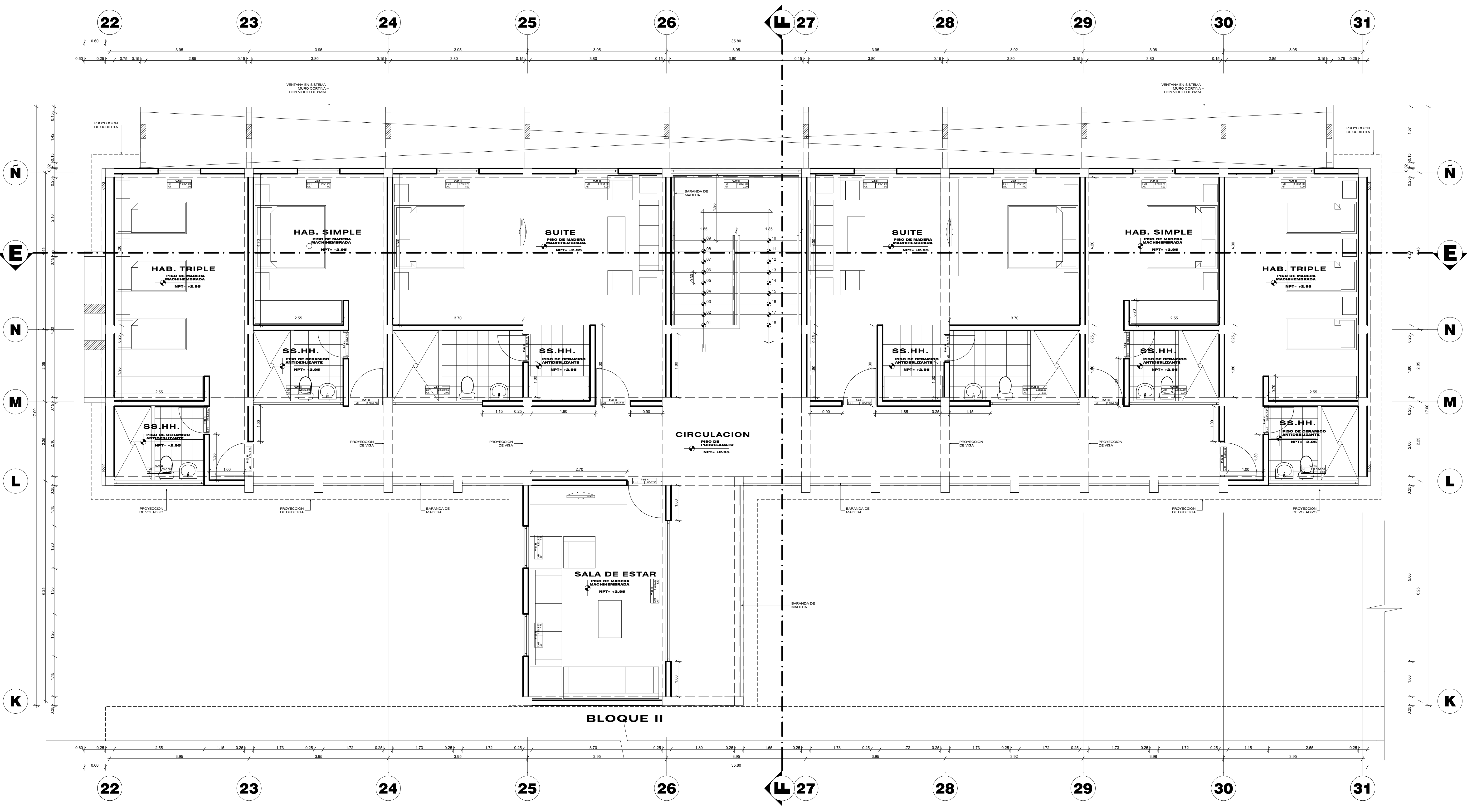
PLANTA DE DISTRIBUCION 2DO NIVEL BLOQUE III ESCALA 1:50