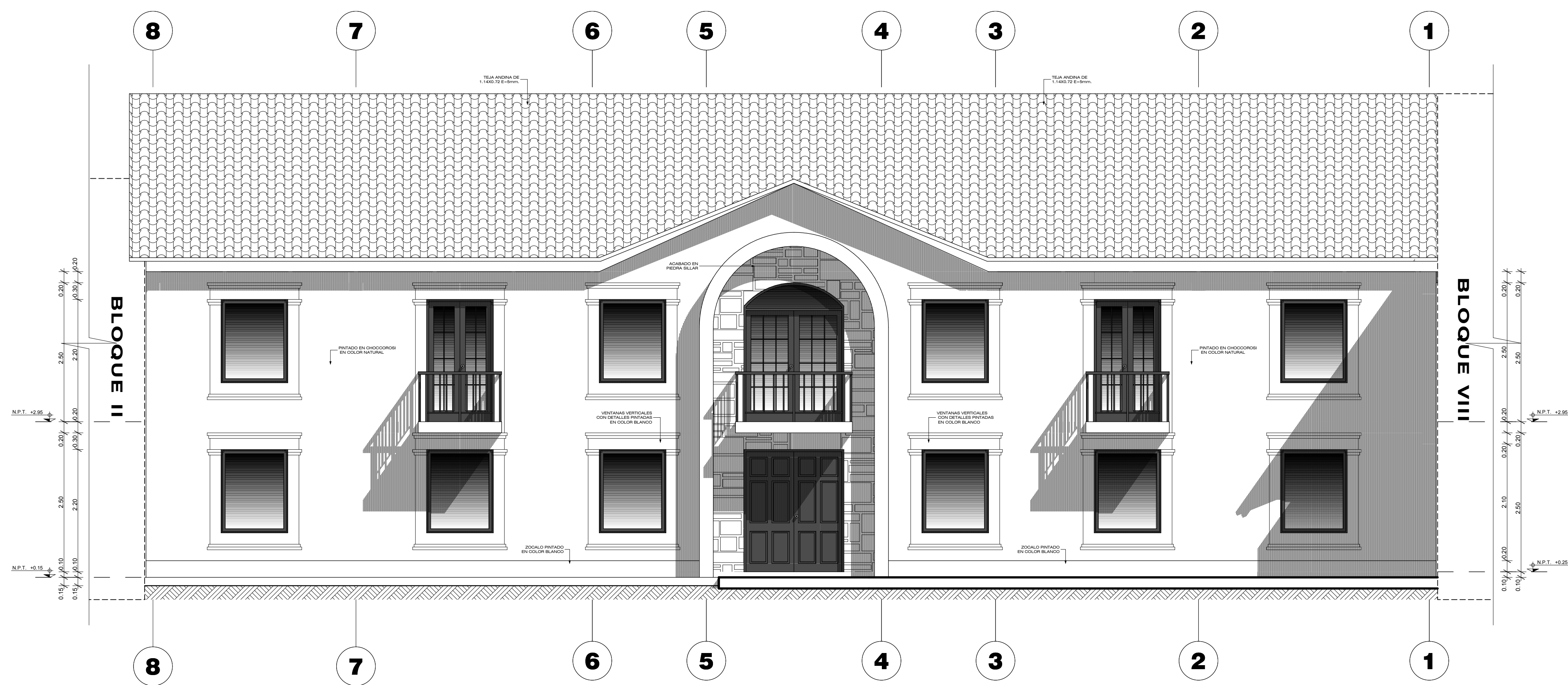
ELEVACION OESTE DEL BLOQUE I ESCALA 1:50