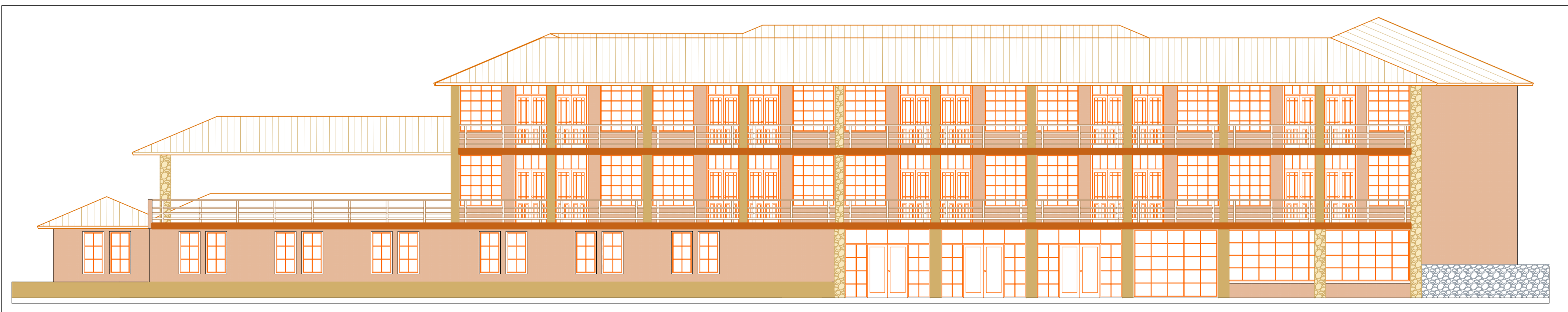
CABALLERIZA ELEVACION "J"