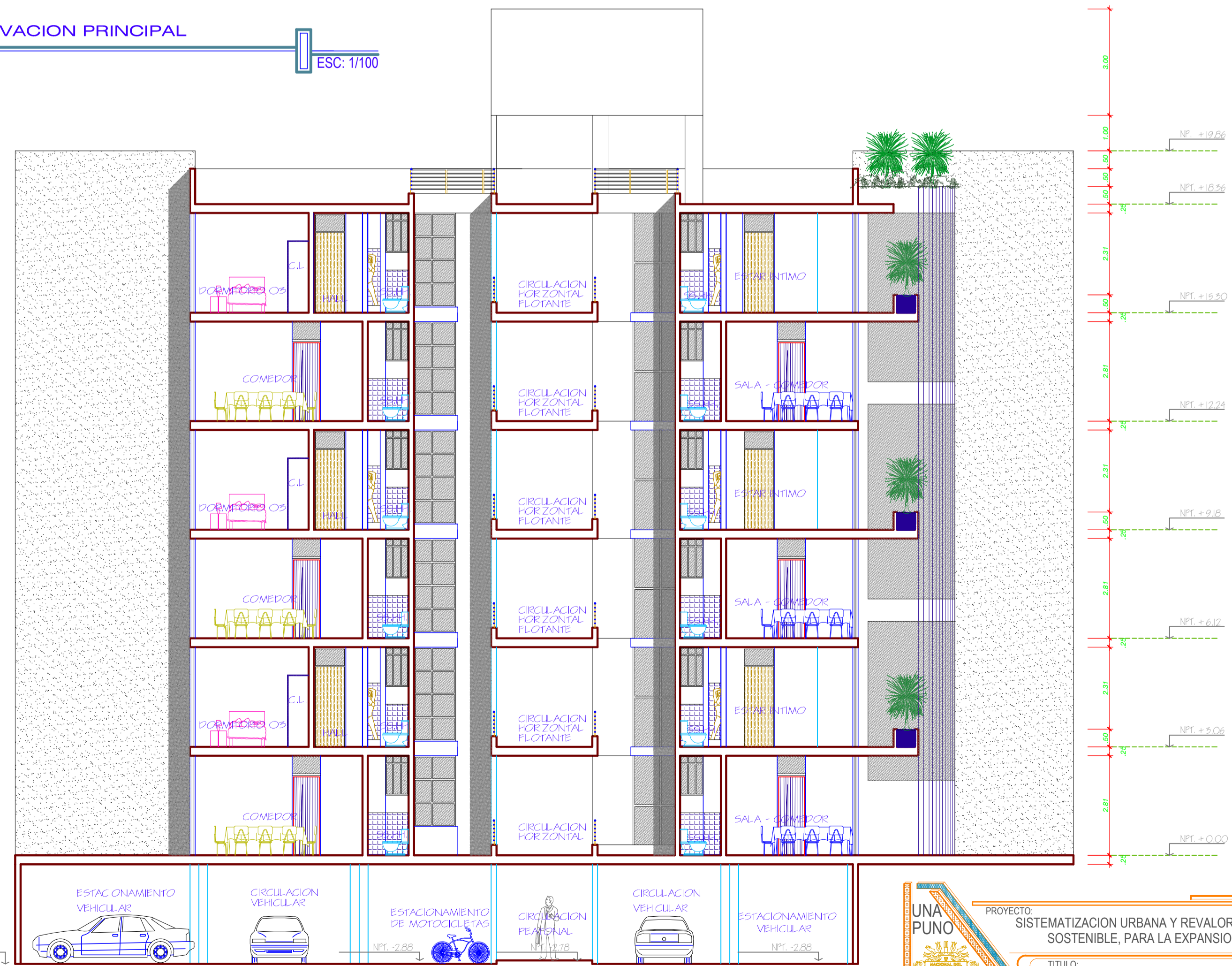
SECCION TRANSVERSAL C-C'