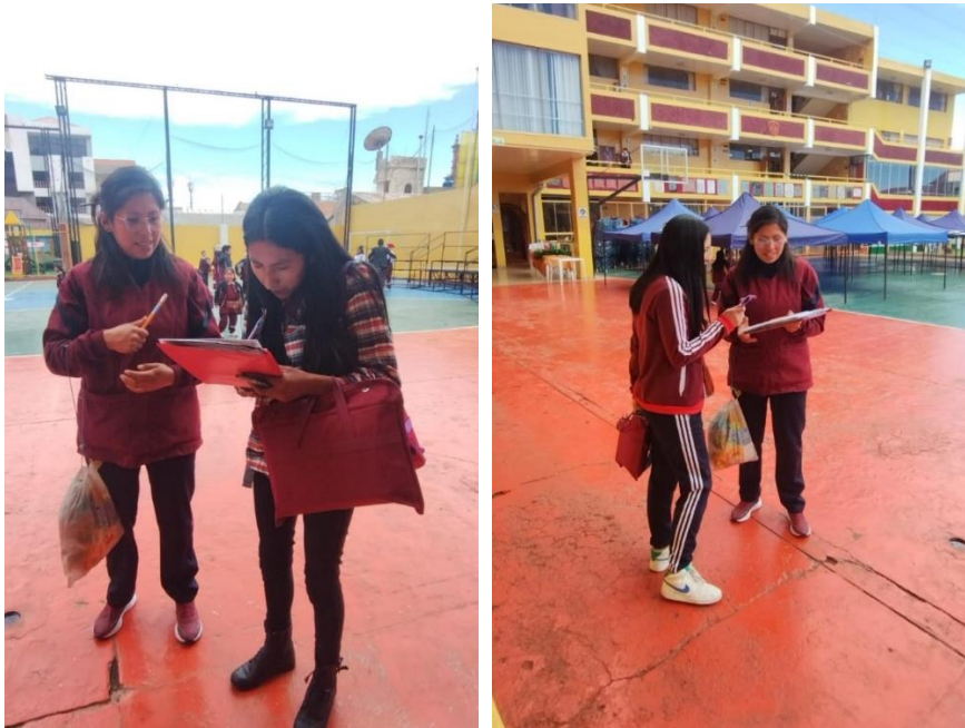
Momento de la aplicación del cuestionario de dinámica familiar a los padres y madres de los niños y niñas de 3 y 4 años