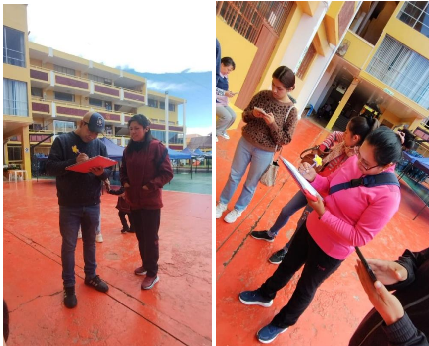
Momento de la aplicación del cuestionario de dinámica familiar a los padres y madres de los niños y niñas de 5 años