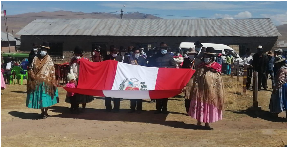
Aniversario de la comunidad campesina. Pichi pichini Aurincota.