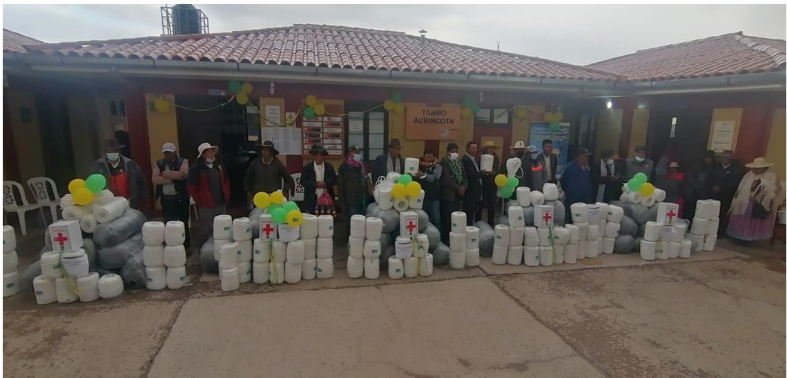
Entrega de kits – proyecto vicuñas GERE PUNO (Desarrollo económico)