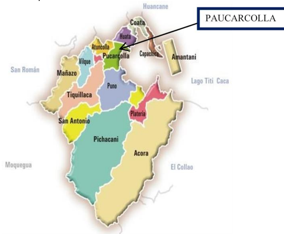
Figura 1. Mapa del distrito de Paucarcolla