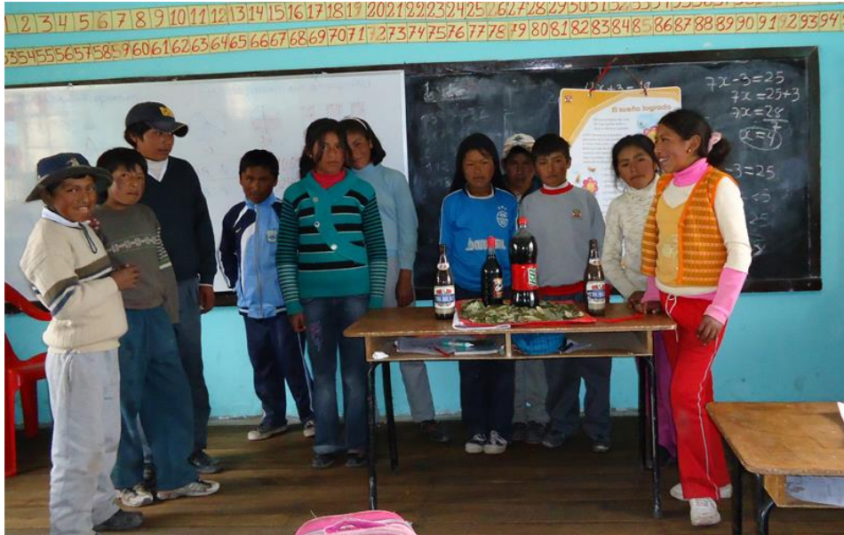
(LOS NIÑOS ESCOGEN HOJAS DE COCAS ENTERAS)