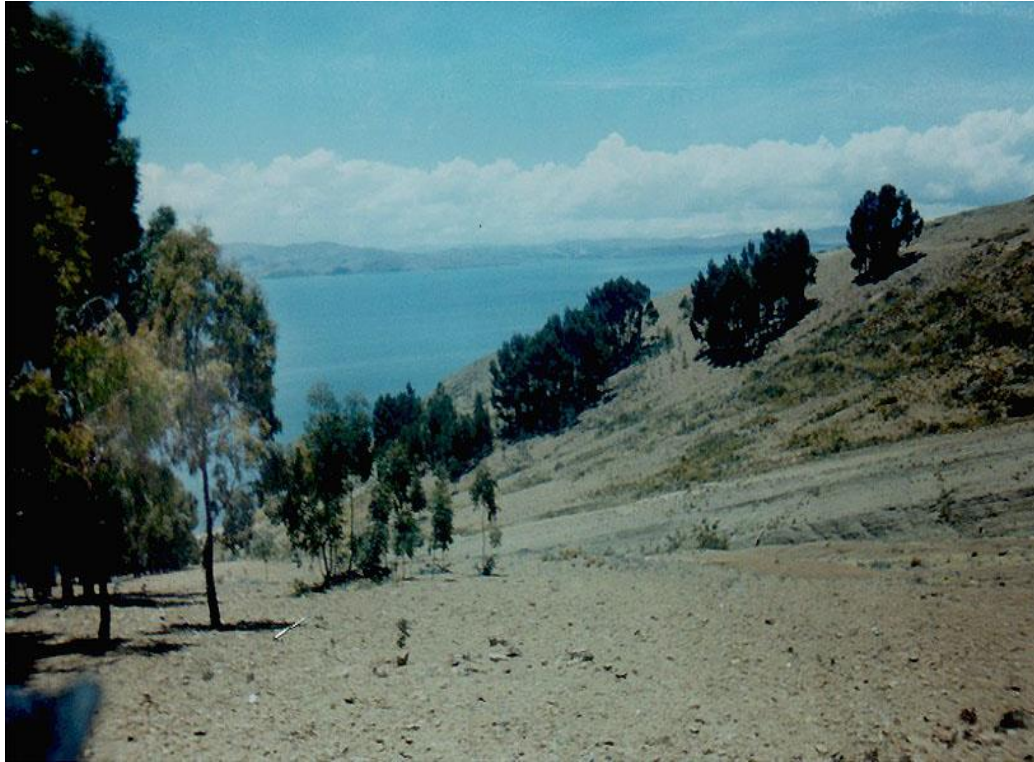
Figura 8. Pajcha Pata