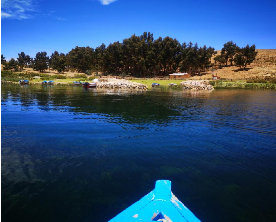
Figura 3. Playa de Tutuni