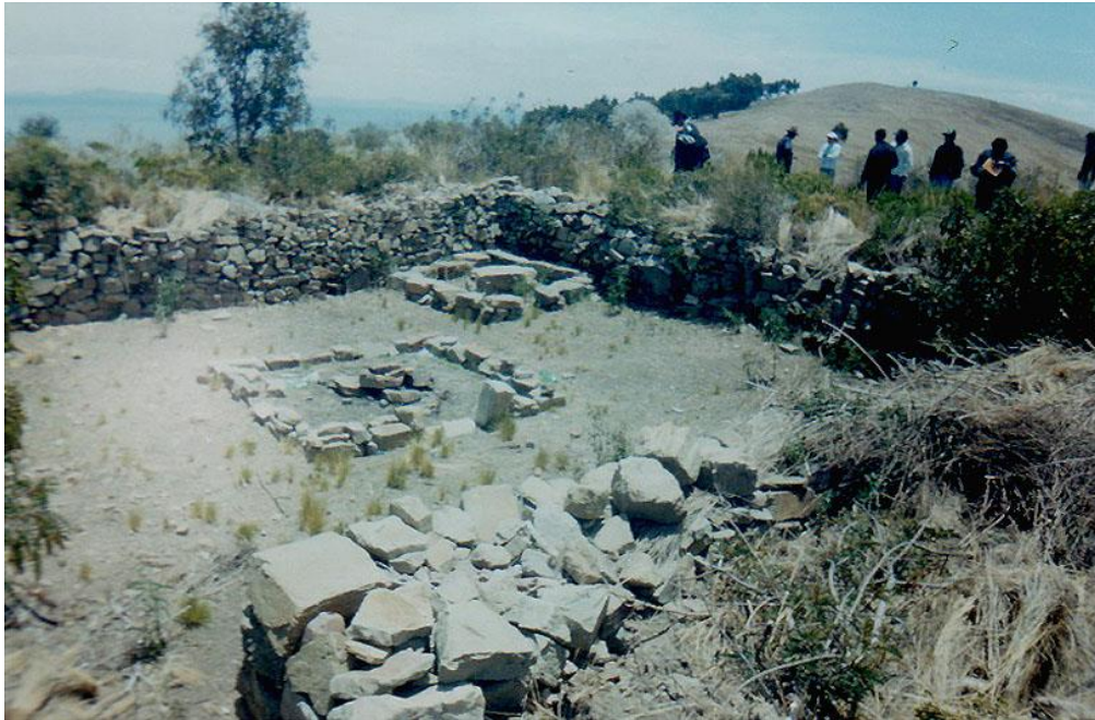
Figura 9. Pachamama

los pobladores informan cada año, se realiza un ritual en el mes de junio, el cual es el inicio del año nuevo andino y el pago a la Pachamama en el mes de agosto (ver el santuario en la foto N° 1).