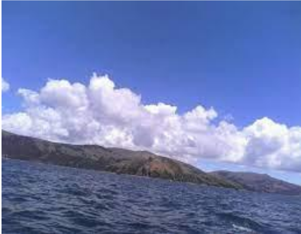
Figura 7. Isla Soto