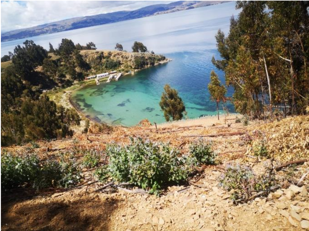
Figura 4. Embarcadero de la playa Lampayuni

Actualmente esta playa no está promocionada, además requiere implementar las condiciones de comodidad y otros medios como carpas, sombrillas, playeras, quiosco de venta de alimentación sostenible.