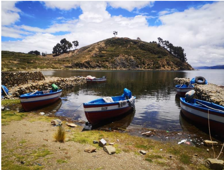
Figura 2. Muelle de la playa de Tutuni