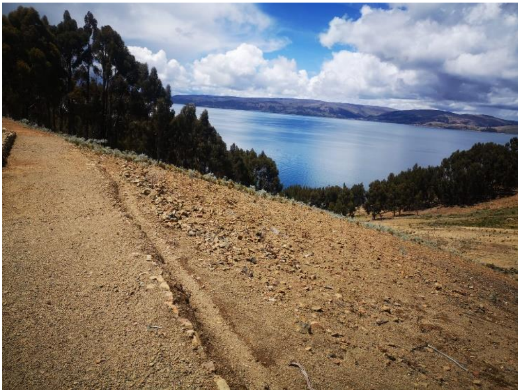
Figura 6. Carretera del sector Lampayuni