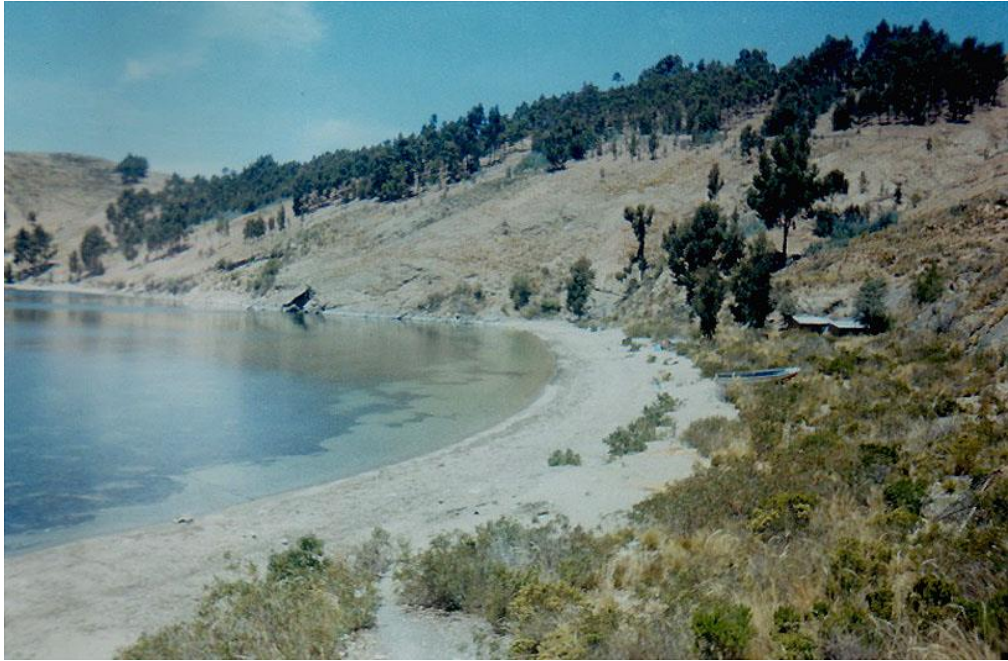
Figura 5. Playa Lampayuni