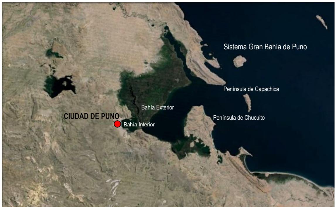
Figura 1. Sistema de la gran bahía de Puno

El área estudiada comprende la parte occidental de la bahía y que es importante describirla por su estrecha relación con la bahía interior y la microcuenca de Puno.