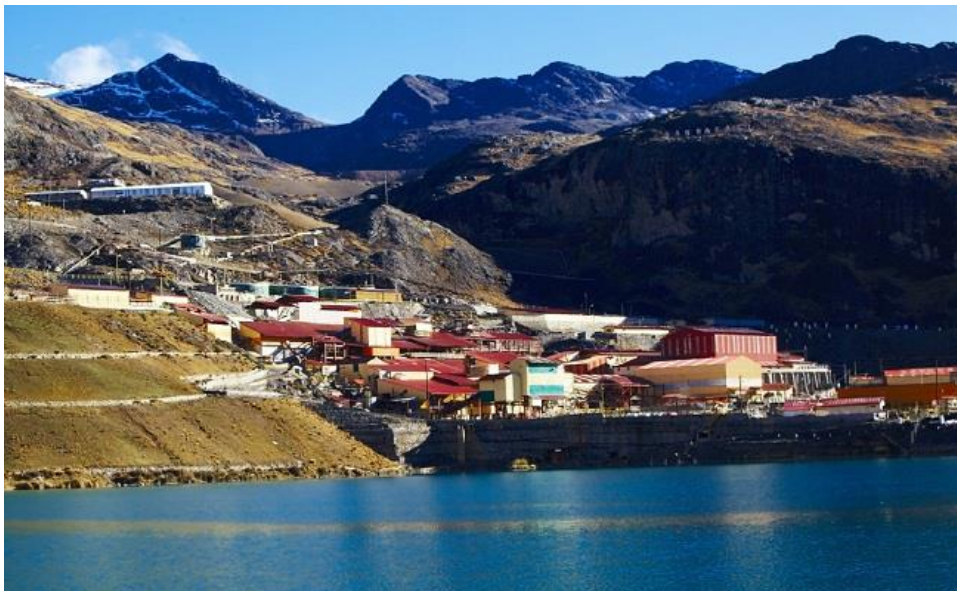
Figura 1: Unidad minera San Rafael - MINSUR S.A., Antauta – Puno