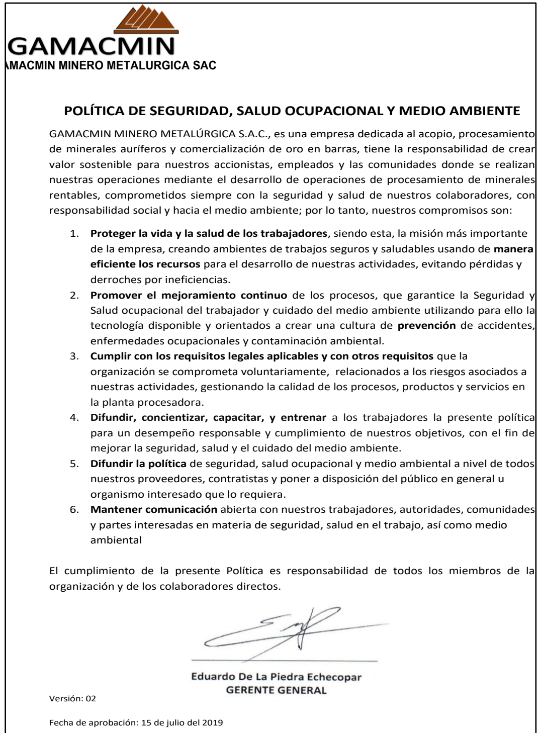
Figura 1. Política de Seguridad