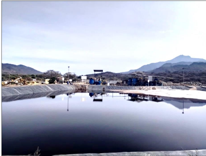
Figura 2. Gamacmin