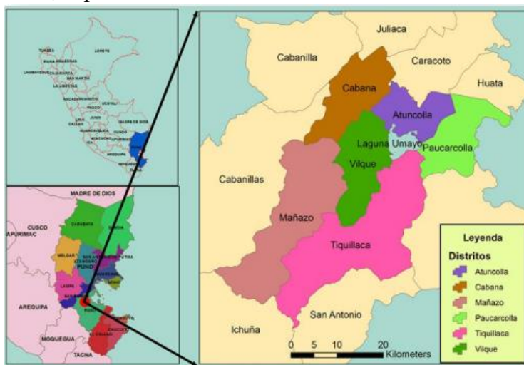
Figura 1. Ubicación Nacional del distrito de Paucarcolla

La investigación se desarrolló en la Institución Educativa Secundaria “Cesar Vallejo” ubicado en Centro Poblado de Moro, de distrito de Paucarcolla, provincia de Puno, departamento de Puno.