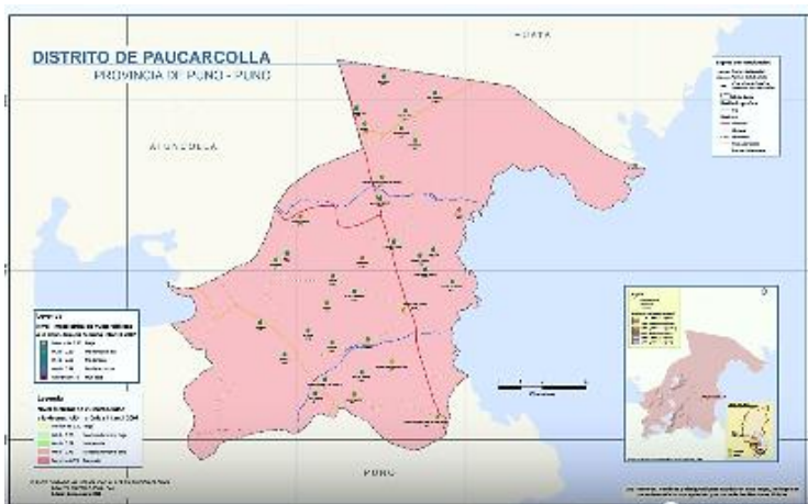
Figura 2. Ubicación del local del estudio