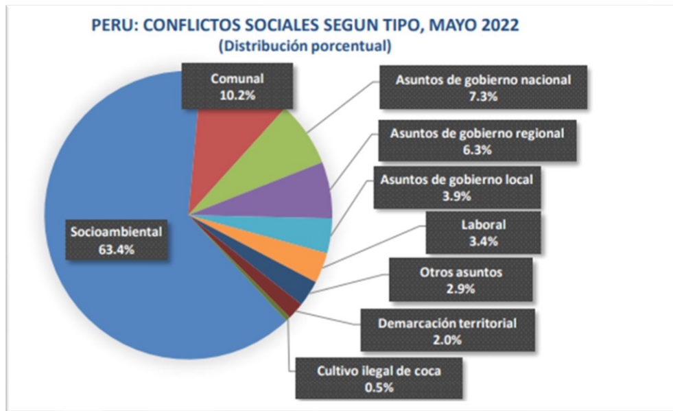
Tabla 10. Cuadro de conflictos sociales en 2022