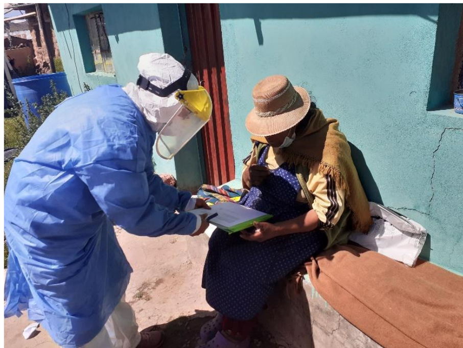
Figura 2. Descripción sobre el tema de investigación