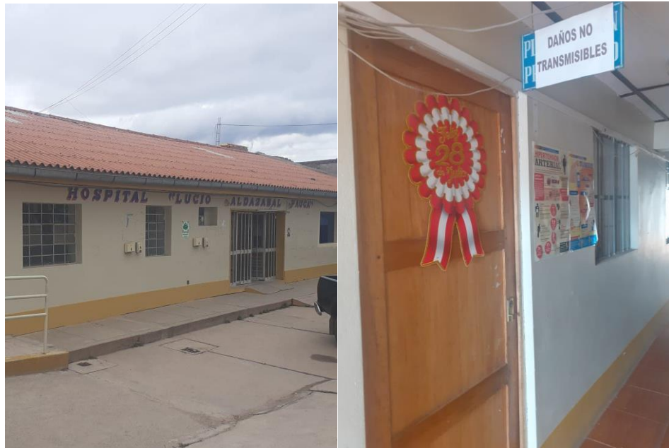
Figura 1. Hospital Lucio Aldazabal Pauca – Servicio de daños no transmisibles