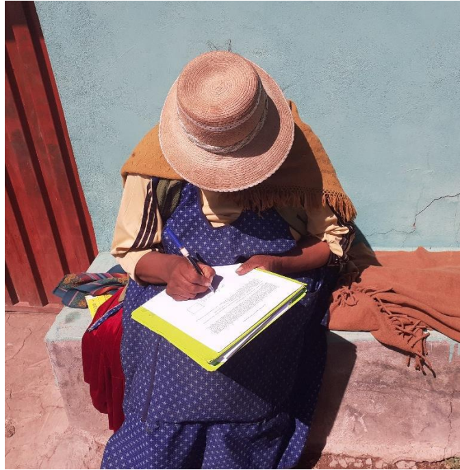
Figura 3. Firma del consentimiento informado