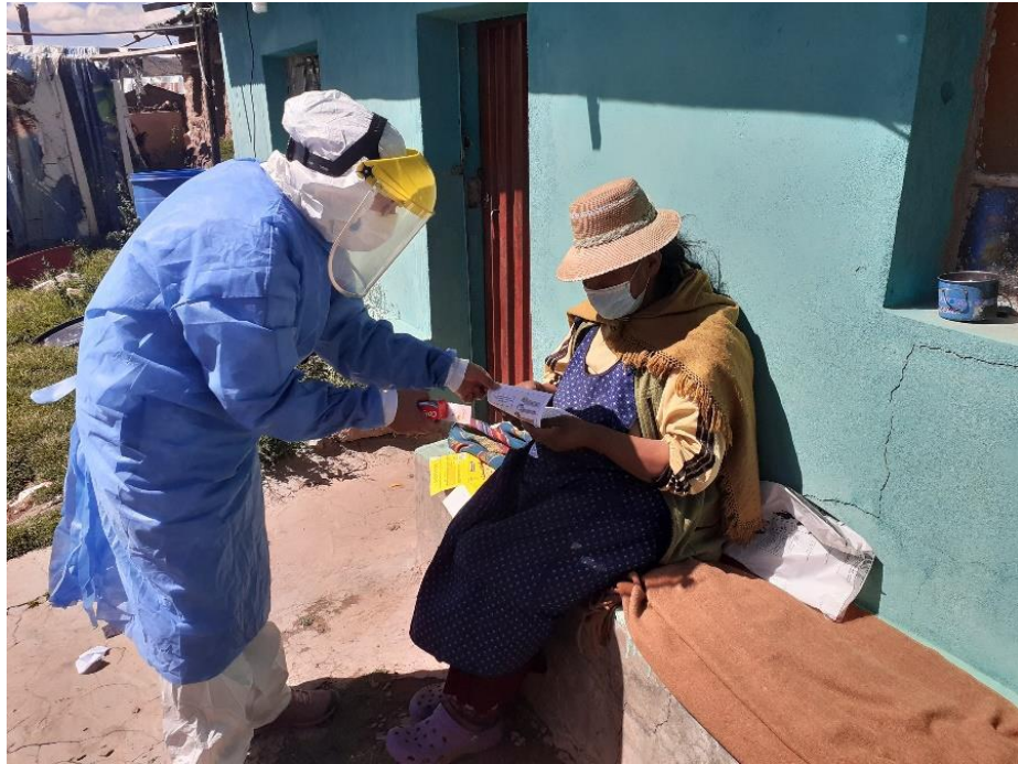
Figura 5. Explicación sobre higiene bucal en diabéticos