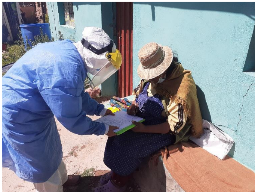
Figura 4. Resolución del cuestionario