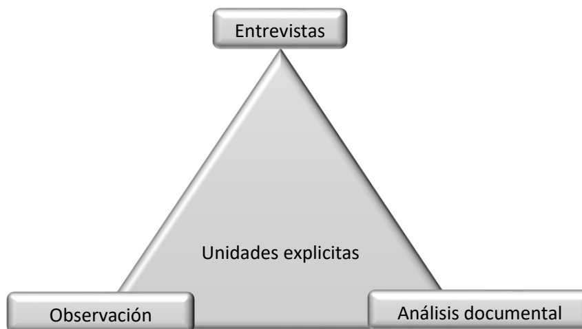
Figura 4. Triangulación de entrevista, observación y análisis documental

En este triángulo se cotejan los resultados de las conclusiones a los que se han llegado a través de las técnicas de investigación utilizadas.