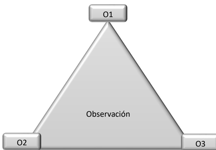
Figura 2. Triangulación de la observación

En la observación de la realidad en el escenario de estudio se ha identificado que actualmente se vienen ordenando la realización de investigaciones suplementarias.