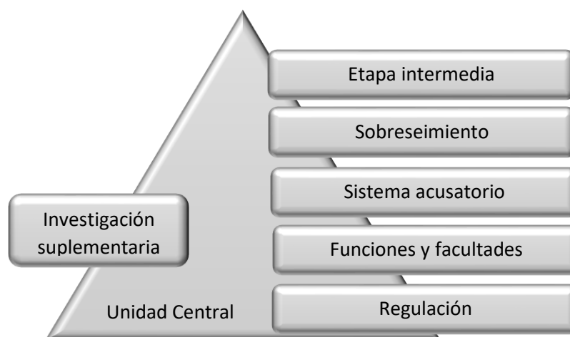
Figura 5. Unidad central y Subunidades

Las teorías relativas al tema más importantes en el desarrollo de la presente investigación fueron los siguientes que a modo de categoría central y emergentes se presenta a continuación: