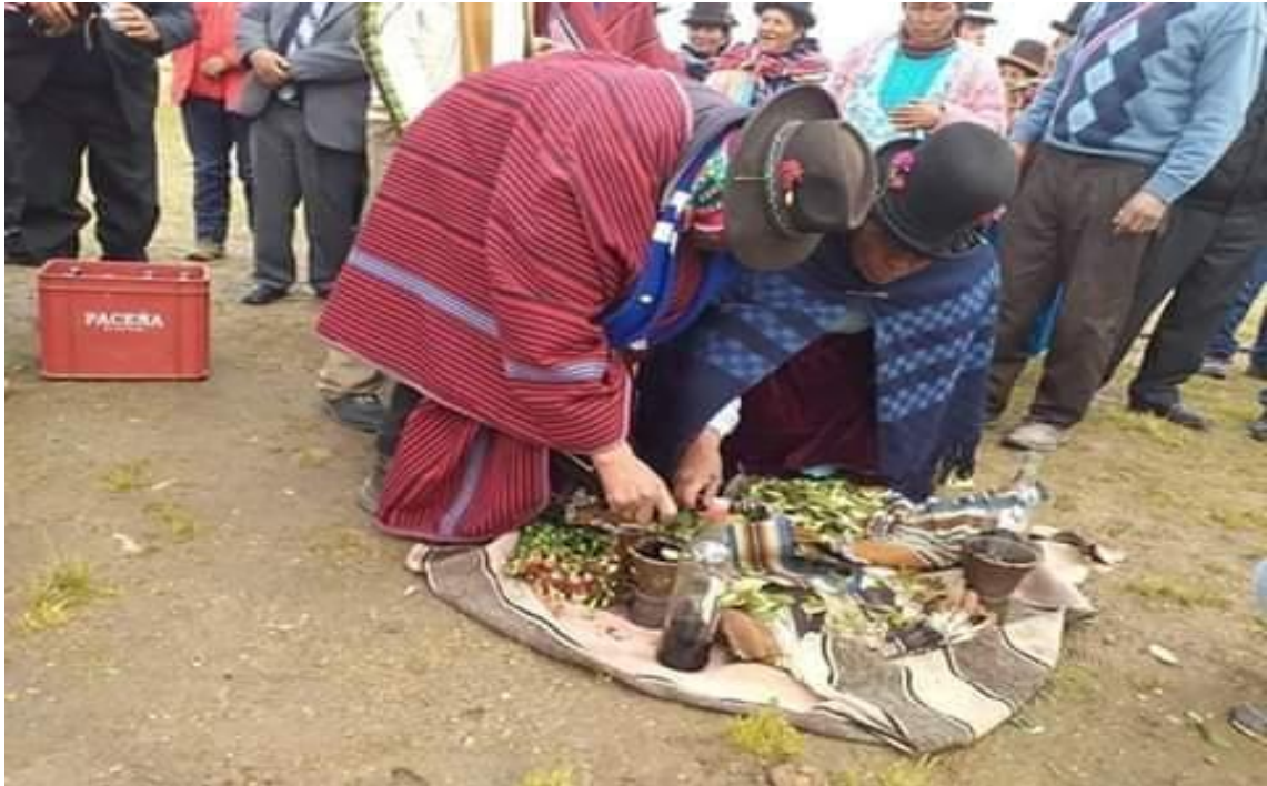
Fotografía 7 Ceremonia ritual de las autoridades originarias en el presupuesto participativo.