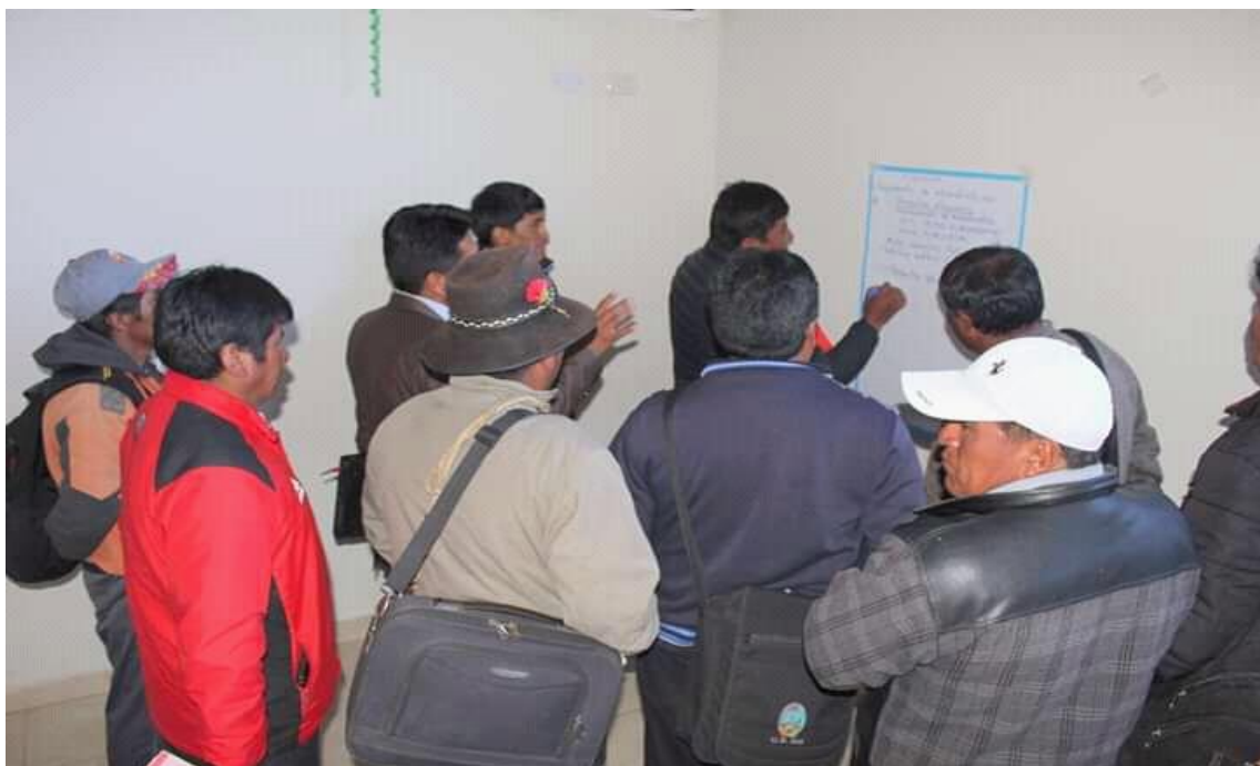
Fotografía 5 Desarrollo de talleres de presupuesto participativo.