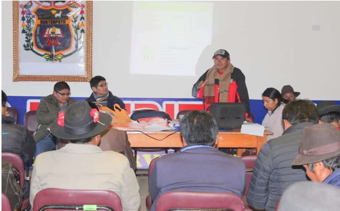
Fotografía 5 Formalización y priorización de proyectos.