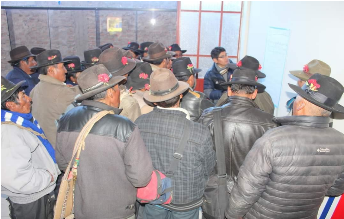
Fotografía 3 Exposición del responsable de la oficina de programación multianual de inversiones (OPMI).