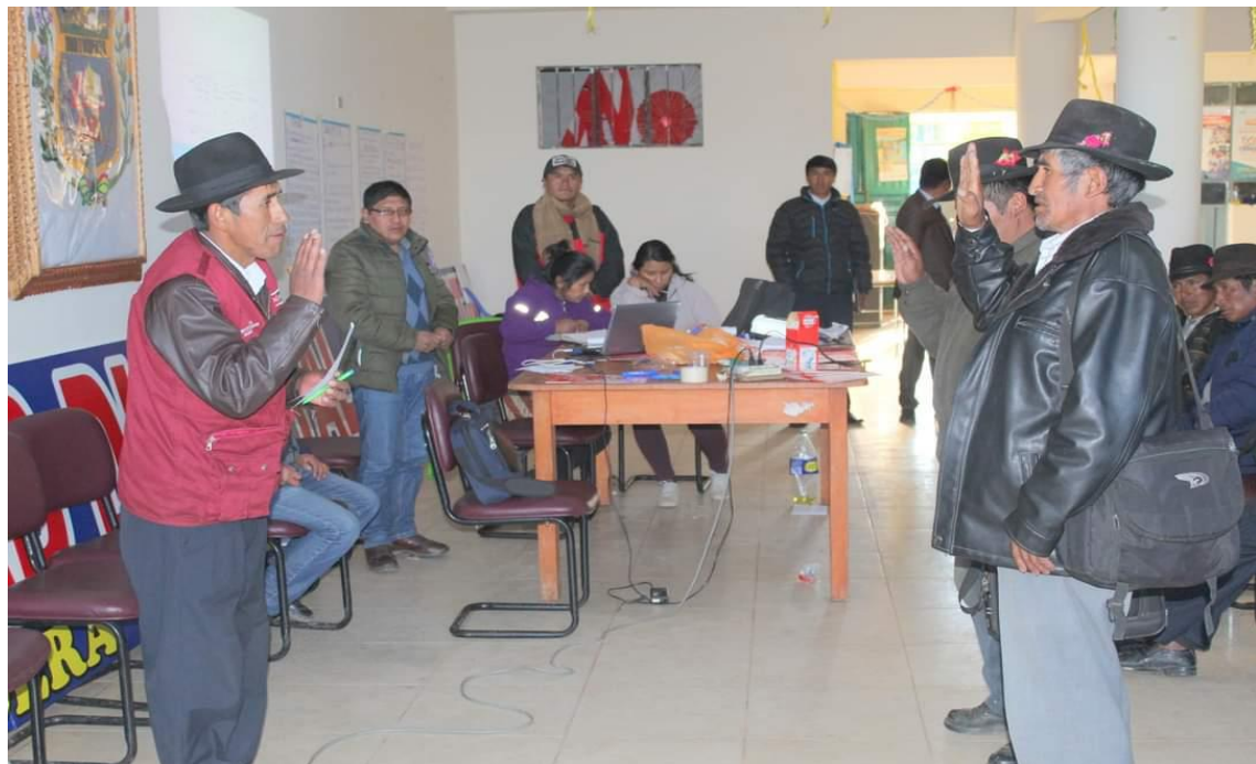
Fotografía 6 Juramentación de comité de vigilancia.