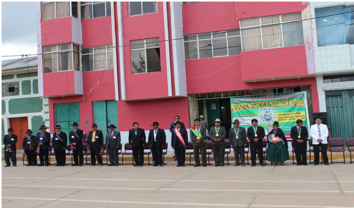
Fotografía 1 Autoridades de la jurisdicción del distrito de Huayrapata y el panel publicitario.