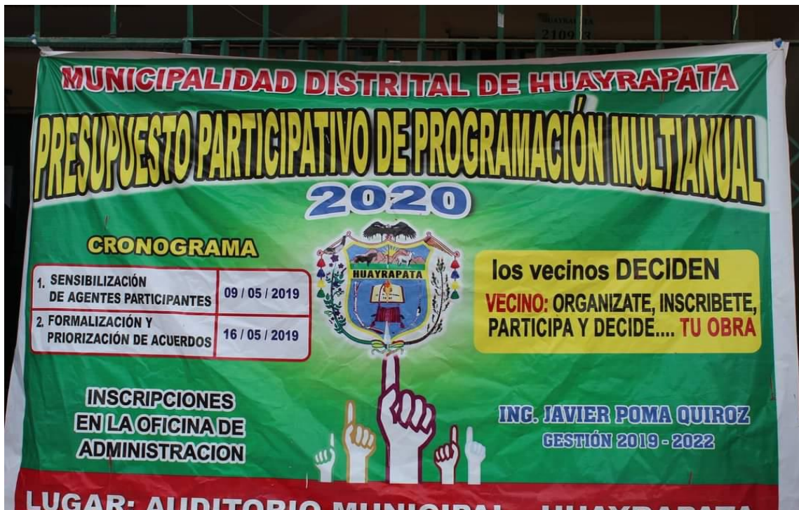
Fotografía 2 Panel publicitario en la puerta de la municipalidad.