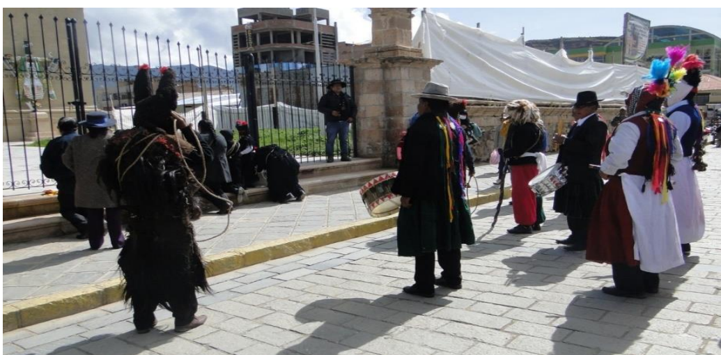
Figura 5. Los alferados junto a sus acompañantes y los integrantes de la danza Puli pulis en oración