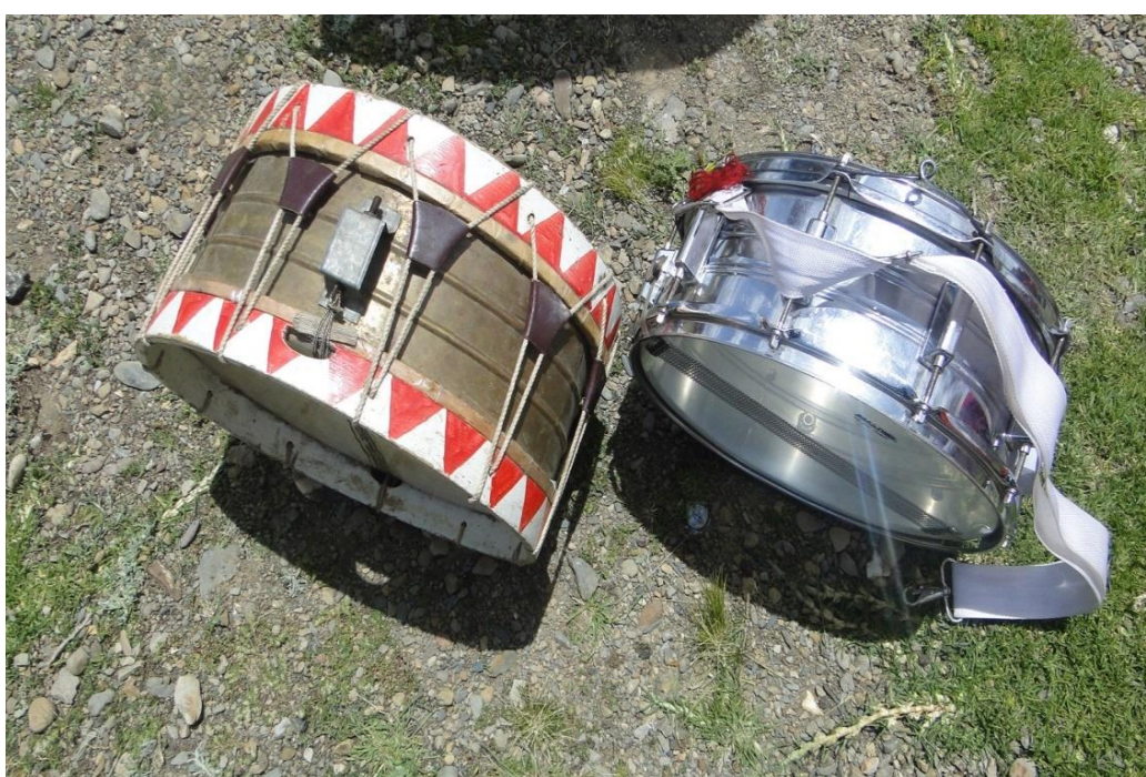
Figura 26. Instrumento de percusión tambor del Puli puli