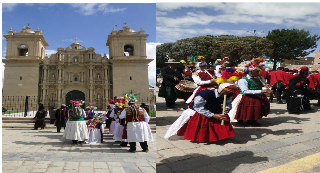
Figura 6. Integrantes de la danza Puli pulis en el acto de adoración en el atrio de la catedral

En este momento de la adoración, los feligreses se reúnen humildemente y con toda la esperanza hacia Dios y la Virgen de la Candelaria con la fe y confianza que tienen hacia ella, piden que resuelva todo problema que tuvieran y sean cada día mejores personas, también piden para que no falte el alimento en cada familia y pueda haber buena cosecha en la agricultura; ofrecen su devoción a la virgen con el fin de recibir su bendición.