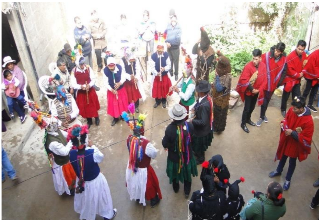
Figura 2. Ejecuta las melodías de la reunión, muestra su desplazamiento en la coreografía en forma de circunferencia en la casa del alferado