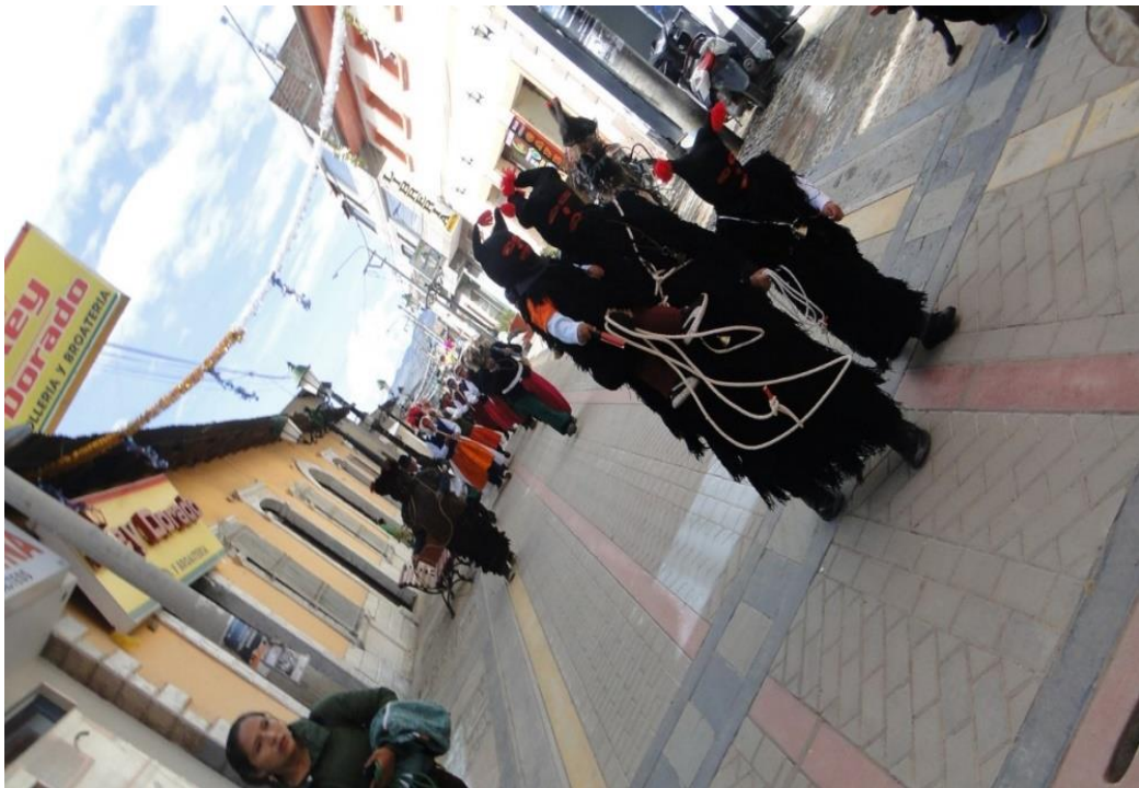
Figura 3. Los Puli pulis en el pasacalle, con los ukumaris abriendo el camino