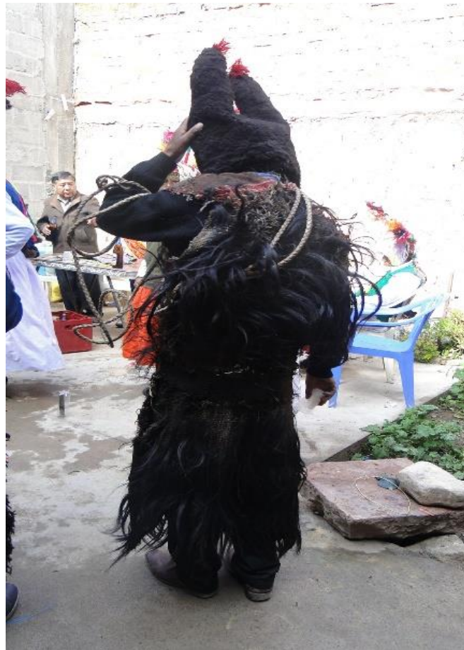
Figura 18. Ukumari que representa al oso