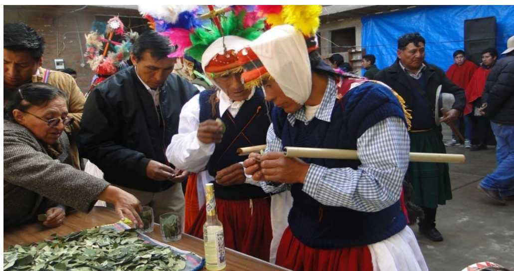
Figura 16. Montera con borlas dorados sujetado con un pañolón blanco

Es como una gorra adornada con borlas doradas que una vez puesta en la cabeza forma parte de la montera, sobre esta gorra va un pañolón de tela blanca amarrado o puede ser pañolón de colores de seda, van representando los sombreros que utilizaban como prenda de esa época estas bellas damas.