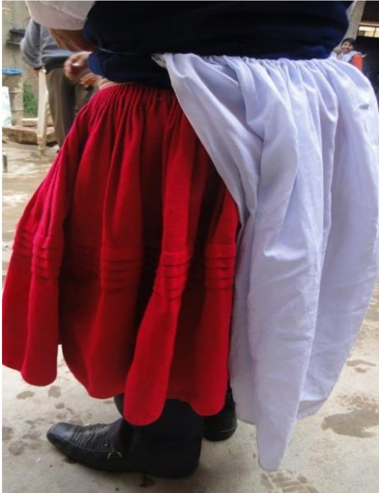
Figura 12. Pollera roja, encima el faldón flotante del Puli puli

Otra prenda que se lleva en la parte superior del cuerpo es un chaleco de color granate y azul oscuro, este chaleco es tejido con lana de llama o alpaca o puede ser color café vicuña adornada con figuras en el mismo tejido, representa al corpiño o formador que ciñe el cuerpo, sobre todo el busto de las damas españolas de esas décadas, una camisa blanca del material que usan en la actualidad de distintas calidades de tela que ofrecen en grandes cantidades en cualquier ciudad, esta prenda del chaleco la confeccionan ellos mismos, se requiere agujas de tejer algunos utilizan lana sintética, otros adquieren chaleco fabricado mediante máquinas industriales que ofrecen los comerciantes.