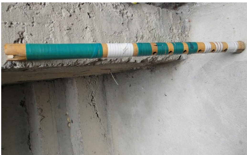
Figura 25. Instrumento de viento pinkillo que ejecutan en la danza Puli pulis