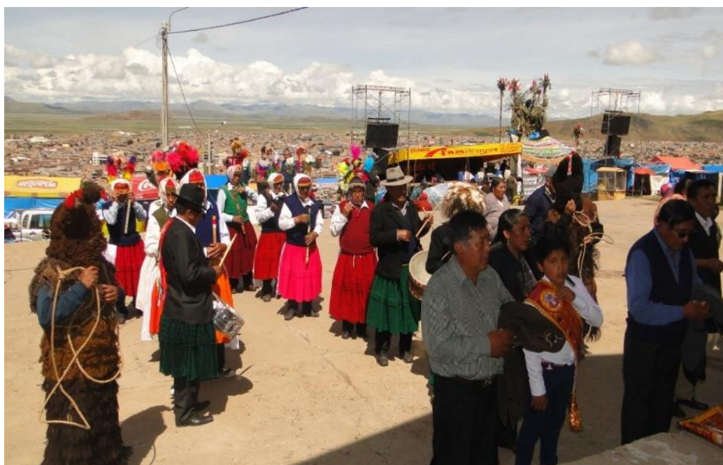
Figura 7. Integrantes de la danza Puli pulis en acto de adoración en el atrio de la capilla del cerro kolqueparque