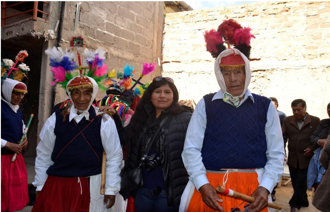
Figura 31. Investigadora junto a los músicos de la danza Puli pulis