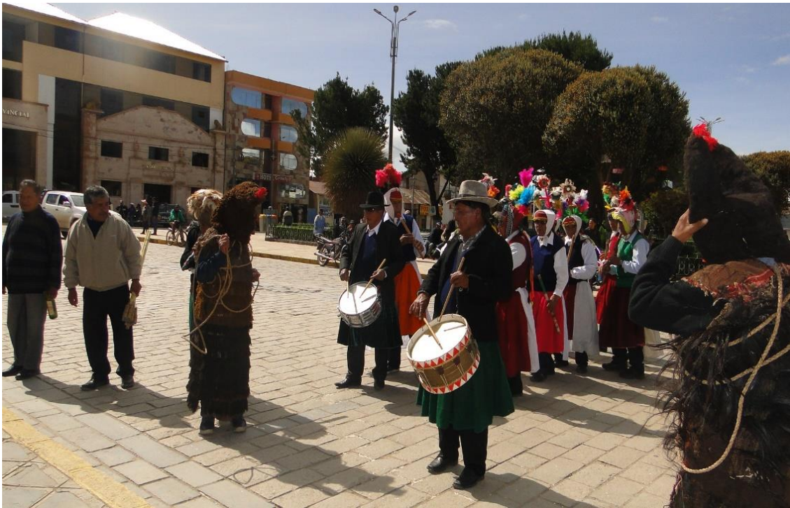
Figura 29. La agrupación de la danza Puli pulis en el escenario de la plaza