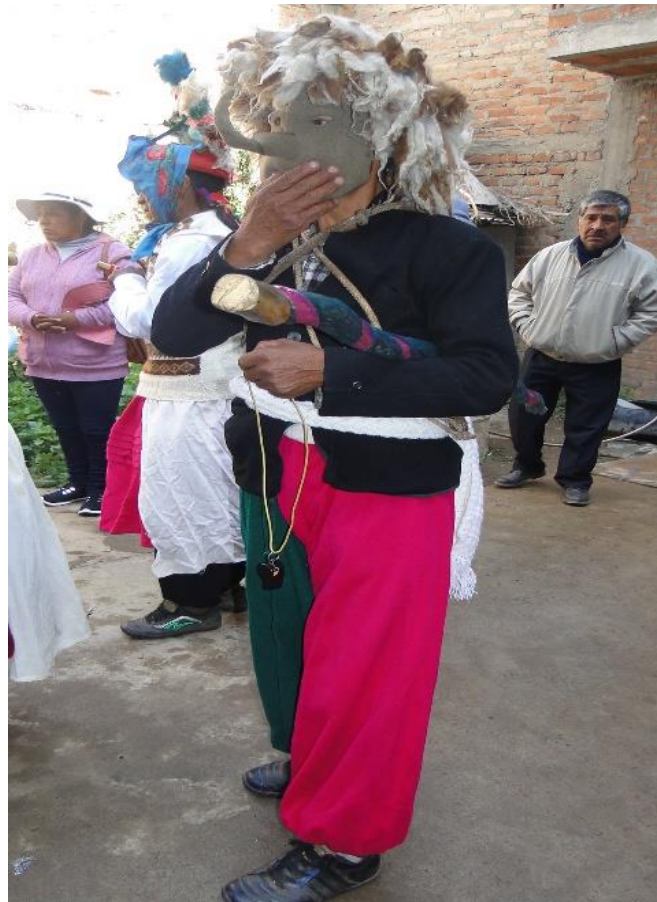
Figura 19. Tijlla o machu/viejo