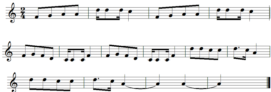
Figura 20. Partitura de la música de Puli pulis, al momento de la reunión