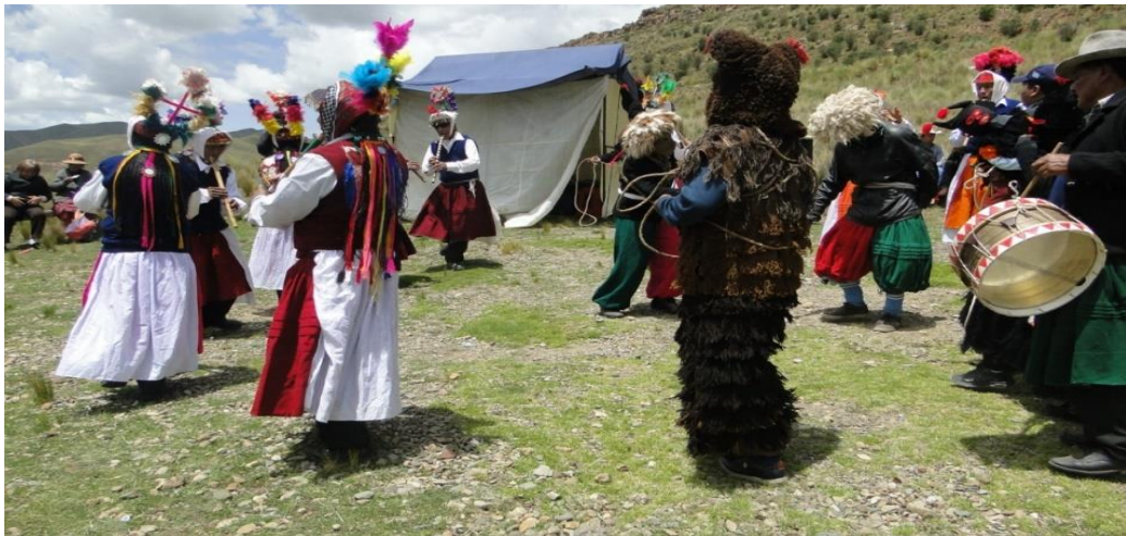
Figura 10. La danza Puli pulis en el cacharpari en el espacio acostumbrado