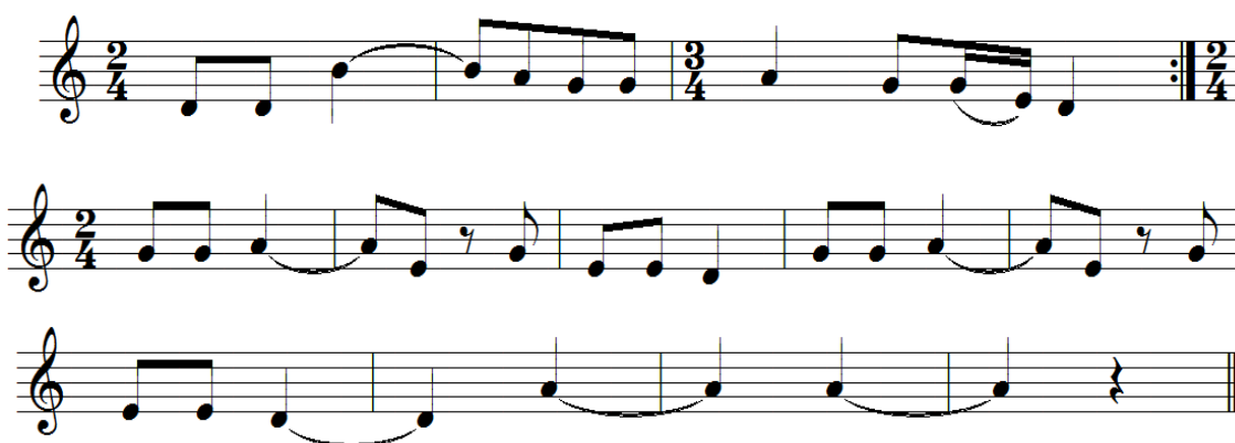
Figura 22. Partitura de la música de Puli pulis, al momento de la adoración