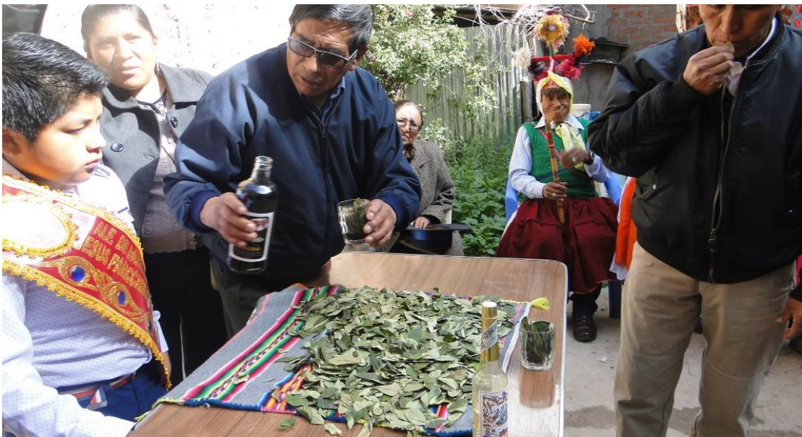
Figura 27. El alferado realizando el ritual, escenario de su domicilio