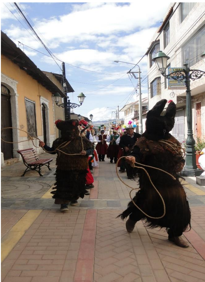
Figura 28. Danzantes y músicos de la danza Puli pulis en el escenario de la calle de la ciudad