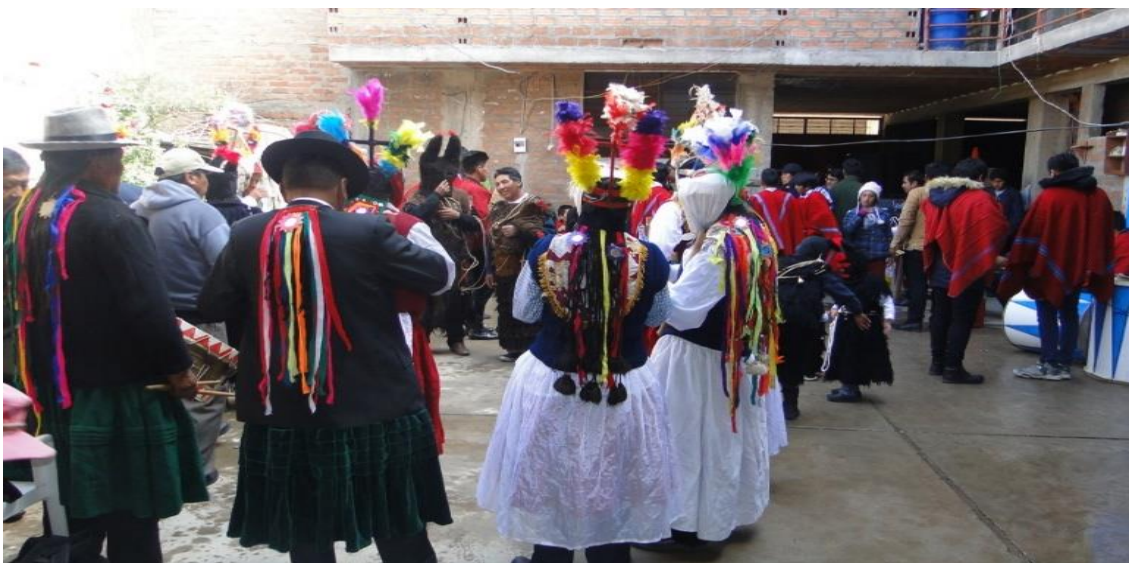
Figura 11. Integrantes de la danza ancestral Puli pulis

Los integrantes de esta danza ancestral de Puli pulis, son provenientes del distrito de Orurillo Melgar, año tras año participan en esta tradición de la festividad Virgen de la Candelaria en el distrito de Ayaviri.