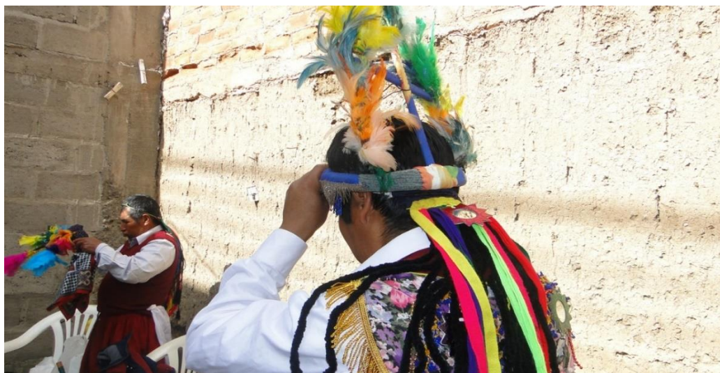
Figura 15. Montera con plumaje colorido y trenzas sujetadas

Es como una gorra adornada con borlas doradas que una vez puesta en la cabeza forma parte de la montera, sobre esta gorra va un pañolón de tela blanca amarrado o puede ser pañolón de colores de seda, van representando los sombreros que utilizaban como prenda de esa época estas bellas damas.