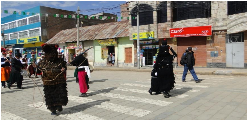
Figura 4. Los Puli pulis ingresan a la plaza de armas de Ayaviri, los tijllas junto a los ukumaris con sus lazos apertura camino