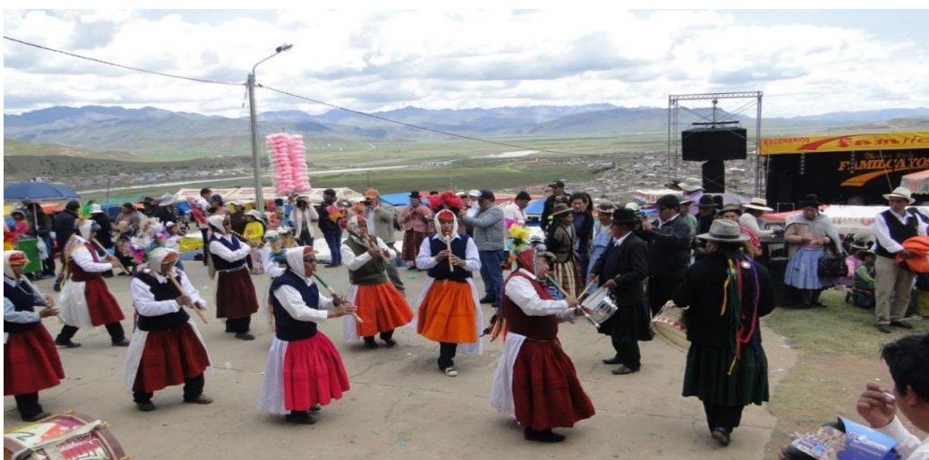
Figura 9. La danza Puli pulis en el cacharpari frente a la capilla