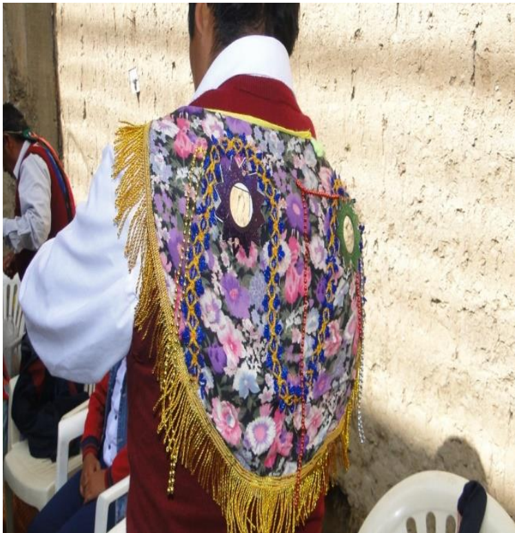
Figura 14. Capa de colores del Puli puli

Montera, se utiliza en la cabeza que consta con distintos adornos; un plumaje colorido que tiene una forma de cruz y mide aproximadamente 60 cm. de alto, conformado por multicolores plumas de aves que habitan en el lugar del distrito de Orurillo y el armazón es de carrizo. Este adorno va colocada a la cabeza, exactamente sujeta a la nuca que muestra como una cabellera con trenzas delgadas que caen sobre la espalda; además llevan cintillos de colores y un espejo de forma de estrella colorido colocado en la parte superior de la espalda, este indumento llamado sakhápas, el adorno representa en la danza el peinado de la dama española de esa época.