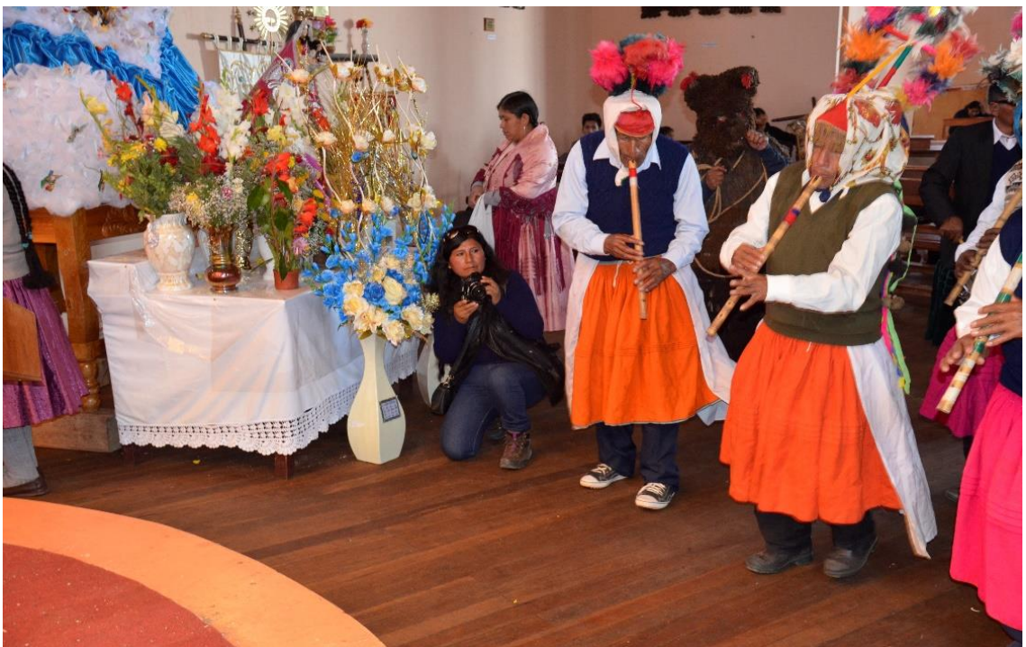
Figura 32. Investigadora tomando fotografía a la comparsa de la danza Puli pulis