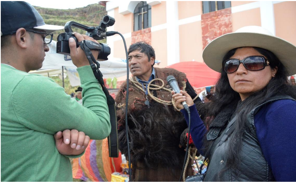
Figura 33. Investigadora realizando entrevista al personaje ukumari de la danza Puli pulis