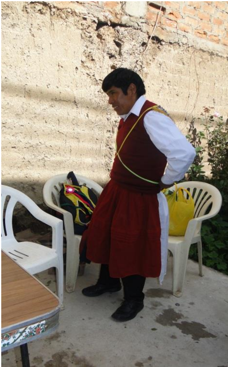
Figura 13. Chaleco granate y camisa blanca

Una capa de seda mediana de colores con adornos de flecos dorados, espejos de forma de estrella de colores, hilos multicolores, esta prenda que llevan en la espalda cubre la parte posterior del cuerpo imitan a los mantones de manila que usaban las damas españolas, también se utiliza en la pandilla puneña mantones de manila, esta prenda solo utilizan los músicos que tocan el instrumento de los pinkillos, más no los del instrumento de percusión que ejecutan los tambores.