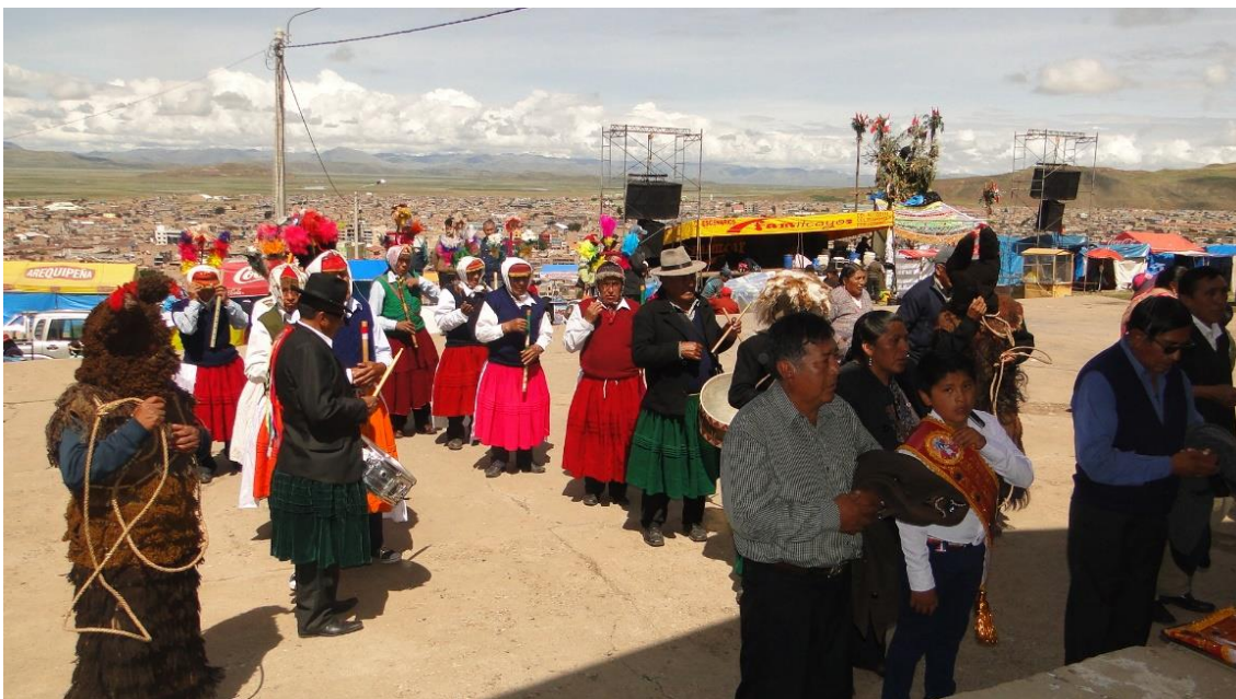
Figura 30. La agrupación de la danza Puli pulis en el escenario del cerro kolqueparque