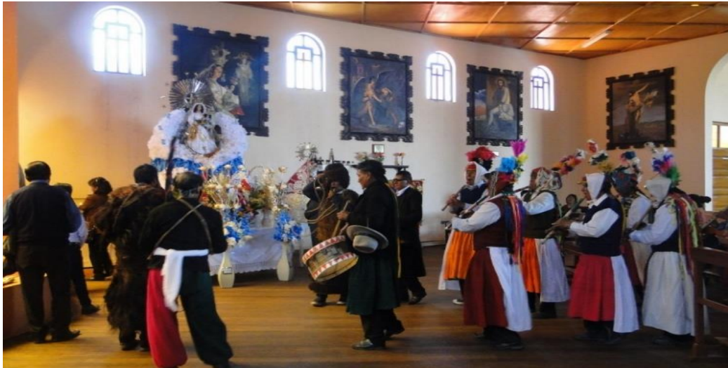
Figura 8. La danza Puli pulis en acto de adoración en la capilla cerro de kolque parque

En el atrio de la capilla virgen de la Candelaria, todos los integrantes junto al alferado y su familia, nuevamente muestran el momento de la adoración tal como se plasmó en el atrio de la catedral, posteriormente apreciaremos dentro de la capilla frente a la virgen de la candelaria adorando mediante una melodía especial que ejecutan en este momento de adoración.