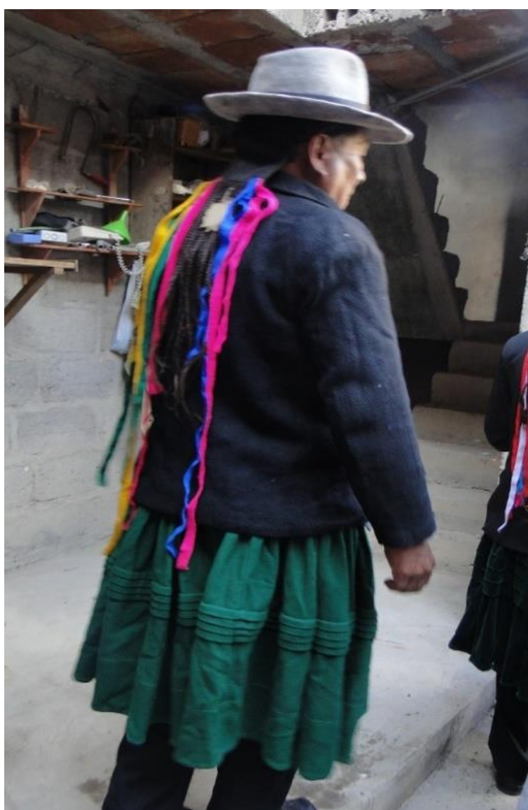
Figura 17. Músico que ejecuta el instrumento del tambor, también llamado negras

Un saco confeccionado de bayeta color negro, encima adornado con el indumento llamado Sakhepa que es parte de la montera, todos esos adornos de cintillos multicolores que caen encima de la espalda. En otros casos se usa una chaqueta de bayetilla, actualmente lo confeccionan de este material. Algunos danzantes aún utilizan chaquetas de bayeta, material que se utilizaba anteriormente, tal como se muestra en la figura N° 16. Portan un sombrero de lana de oveja color plomo, tiene una medida de paño completo, hay otros sombreros que es fabricado industrialmente, el material no es de lana de oveja, es de un material sintético y color negro.