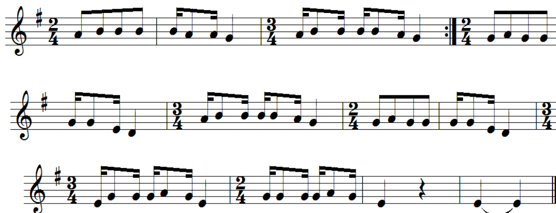
Figura 23. Partitura de la música de Puli pulis, al momento del cacharpari