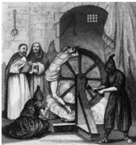
Figura 2. La rueda de la Verdad

extrema en el tanto así que uno sentirá: que está siendo observado todo el tiempo lo que devendrá a que el sujeto no pueda realizarse plenamente como persona lo que conllevará hacia una conversión al catolicismo mediante el temor y la represalia. Así mismo para esta conversión del paganismo hacia el catolicismo se usaran métodos drásticos para lograr dicho cometido como por ejemplo: el uso de la rueda la tortura en donde se pone al sujeto pagano en una rueda para que este acepte su conversión al catolicismo y lo mencionado en estas líneas se encuentra en la imagen: