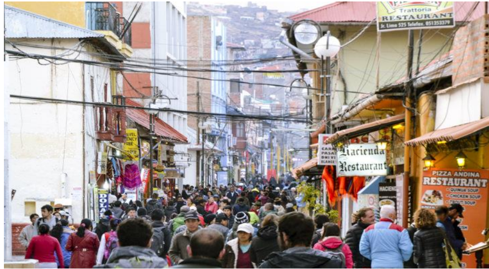
Figura 9: Pasaje Peatonal Jr. Lima como lugar de mayor tránsito de la ciudad de Puno.