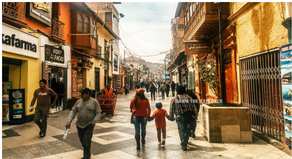
Figura 8: Pasaje Peatonal Jr. Lima de la ciudad de Puno