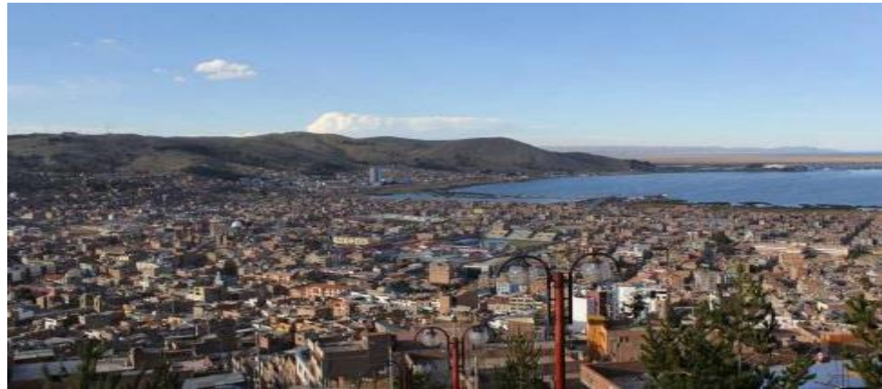
Figura 5: Vista Panorámica de la Ciudad de Puno