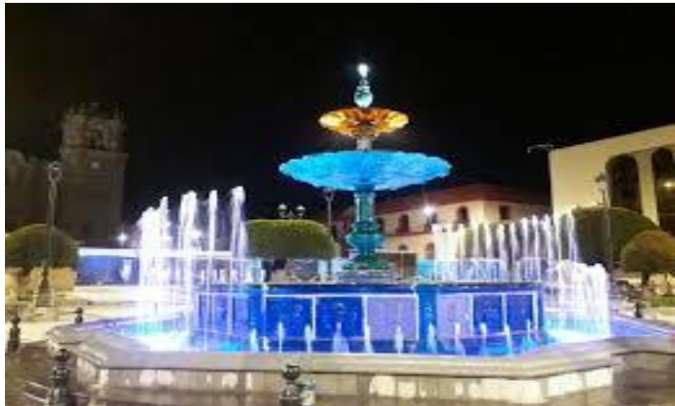
Figura 6: Pileta de la Plaza mayor de Puno 2020