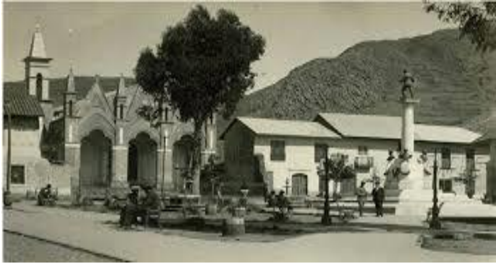
Figura 11: Parque Manuel Pino 1968