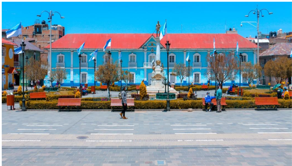
Figura 10: Parque Manuel Pino al frente Casona del Colegio Glorioso San Carlos – Puno