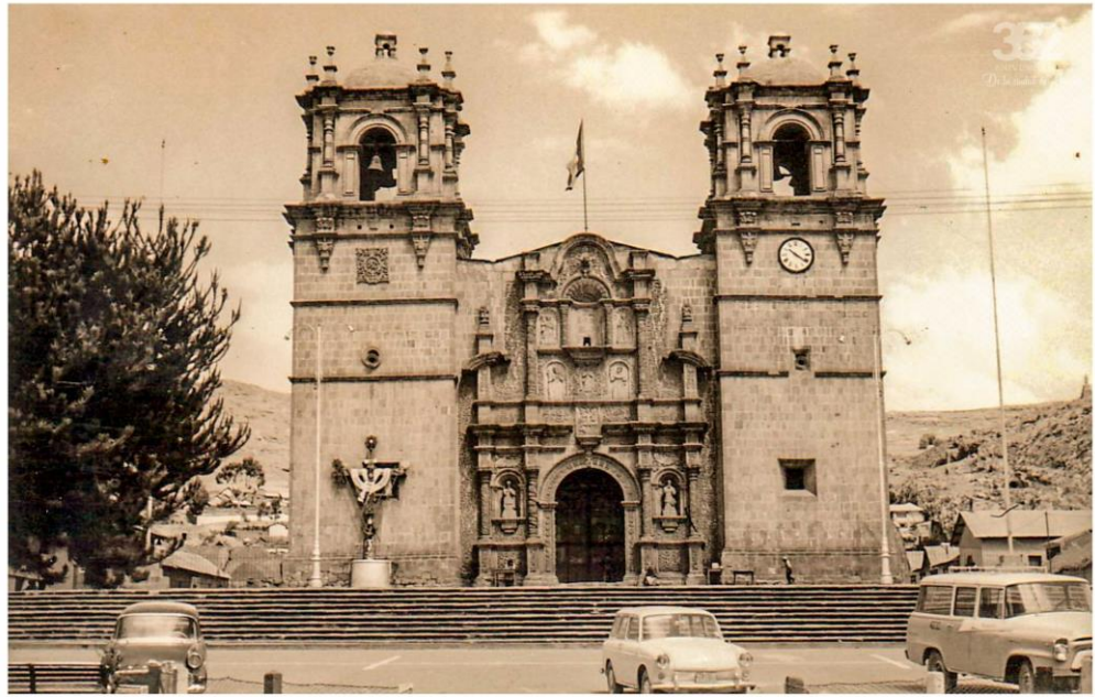
Figura 7: Catedral de Puno 1968