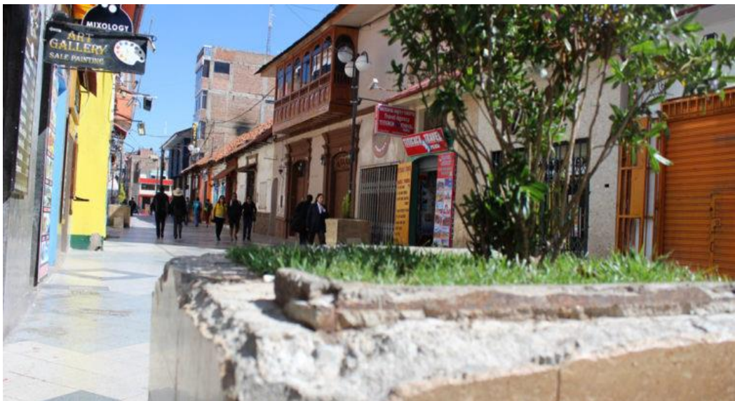
Figura 4: ausencia de mantenimiento pasaje peatonal Jr. Lima