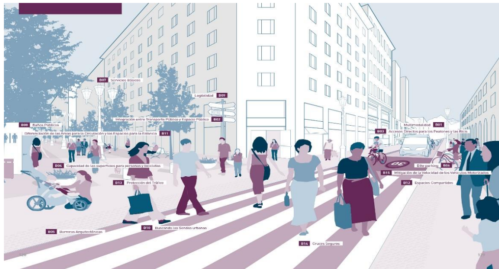
Figura 3: El análisis del espacio público según Gehl (2014)

Fuente: Gehl (2014) “Ciudades para la gente”