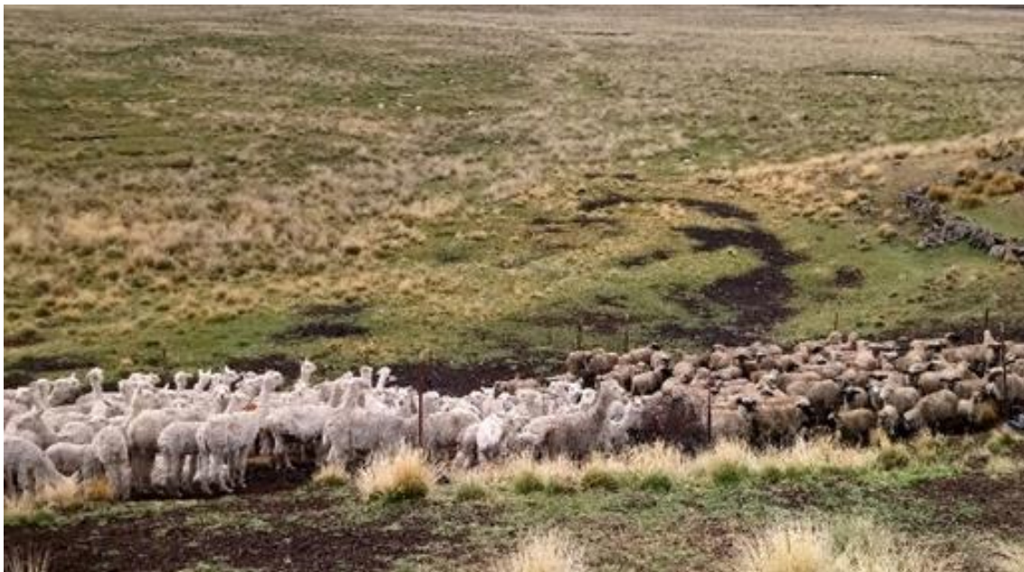
Figura 8: Crianza de llamas, alpaca y ovinos

bien ellos están arraigados a los avances de la tecnología moderna y así lograr el mejoramiento genético para obtener animales de calidad, con fibra fina y mayor producción de carne. Para obtener estas expectativas lo fundamental es la selección, alimentación y el consumo de agua (en alpacas). Según los testimonios que obtuvimos llegamos a una conclusión que la llama puede sobrevivir tomando agua tan solamente dos a tres veces a la semana, mientras que en la alpaca sucede lo contrario y es por ello que, para la crianza de alpacas es recomendable tener agua o espacios de bofedal, si en caso que la alpaca no bebiera agua durante el día ocasionaría grandes pérdidas causando el aborto en las alpacas preñadas. En cuanto a las ovejas también sucede algo similar, cuando se hace el empadre entre dos razas distintas, que en este caso vendría a ser la raza Corriedale y Hampshire Down, como resultado en la temporada de las pariciones se ven crías con ch'iqchi (manchas) denominadas las chuscas, que generalmente son para la saca. Por ello es recomendable realizar el empadre con machos de la misma raza para que no se diera el caso.