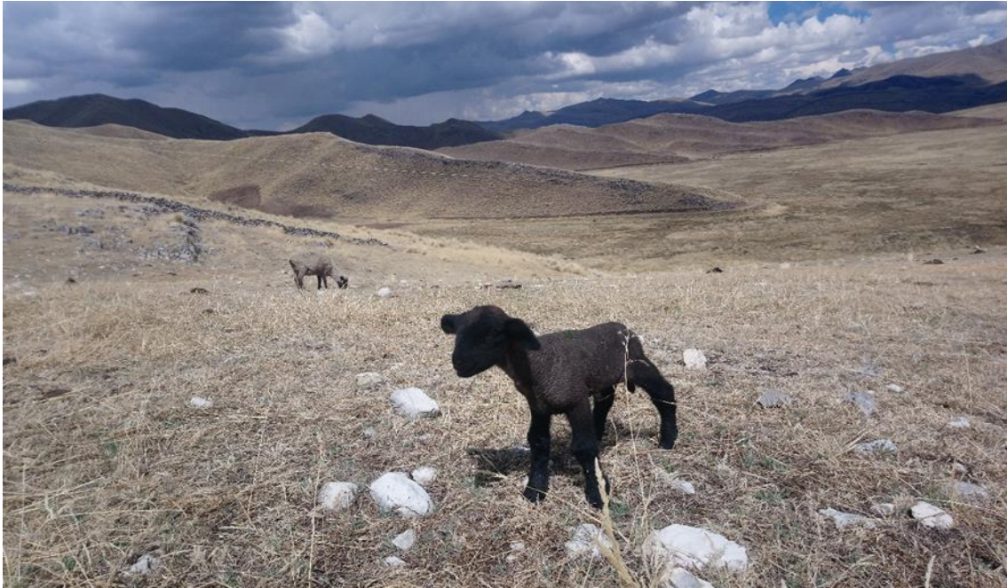
Figura 20: Cría de la raza Hampshire Down (cara negra)