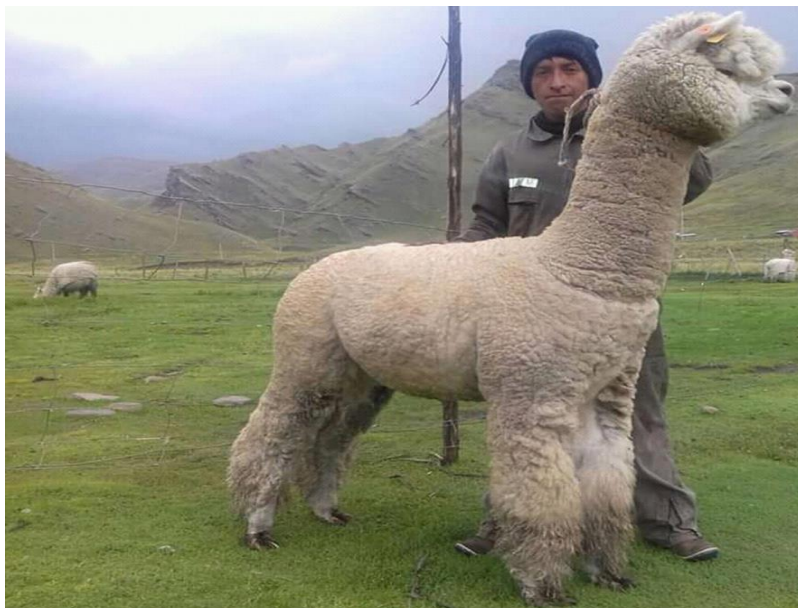
Figura 17: Alpaca mejorada la raza Huacaya para esquila

Bueno, yo estoy en ese proceso de aprender sobre la crianza de animales y en este caso de esquila, los técnicos nos han capacitado sobre esta actividad, ellos ya no usan como nuestros abuelos, nos recomiendan la utilización de las tijeras o máquinas de esquila, también usar escobilla para limpiar la fibra, tenemos tener trabas, mancornas o soguillas para sujetar la alpaca, llama y ovejas. Las mantas de yute para recoger a las fibras según su clasificación. El yodo también es útil para desinfectar las heridas que podemos causar en el momento de esquila, también las siq'as para embalar el vellón, por su puesto que ya utilizando las romanas o balanzas.