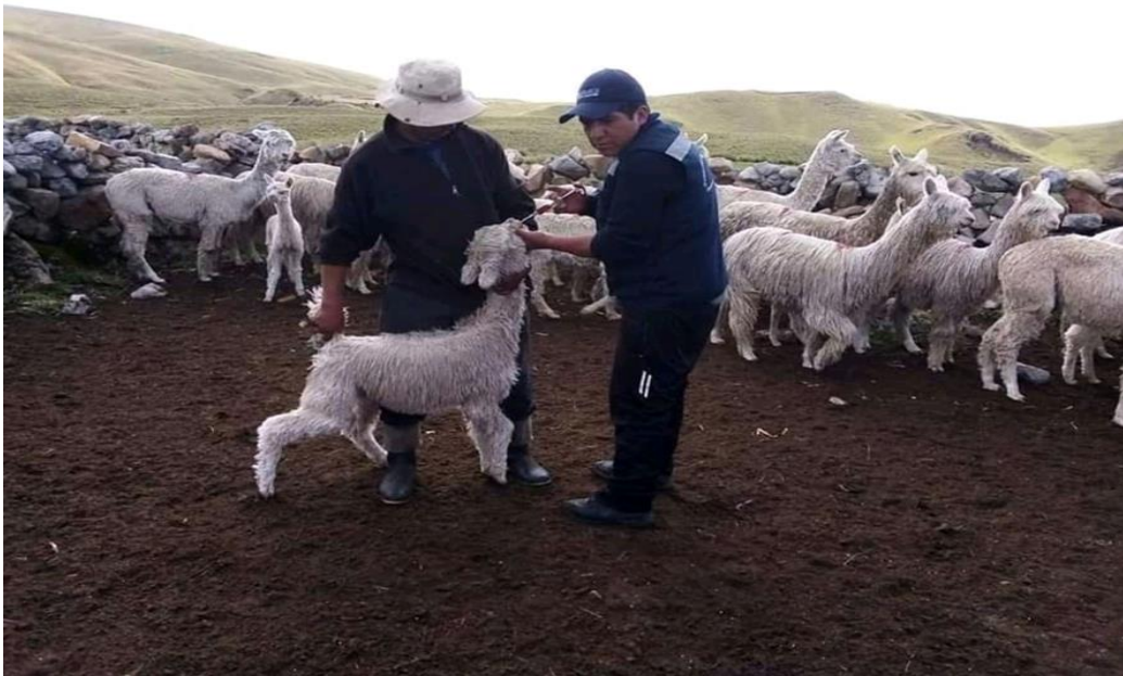
Figura 16: Dosificación a las alpacas

Los baños horizontales que han sido construidos por la recomendación de los profesionales, no han prosperado de manera positiva, porque el líquido que con el agua, malogra a los ojos de los animales, les vuelve ciego, la fibra ya no es de calidad porque pierdo su brillo y el agua sobrante va a los ríos y esto contamina al agua. Es más, las alpacas son delicadas a comparación con las ovejas y son estos los efectos en nuestra comunidad, por ello ya no practicamos la campaña de baño como antes que era más de cuatro campañas hoy en día solo una sola campaña anualmente.