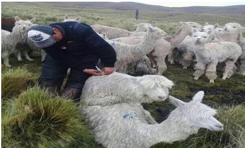
Figura 10: Periodo de empadre y la colocación de vitaminas a los reproductores

sanidad, genética y manejo, es más los machos eran escogidos de la misma manada. Bueno, eso no había sido bueno, porque para empadre había sido bueno tener un macho bueno y que sea de otra manada, porque según las charlas y capacitaciones que recibimos hoy en día por parte de los técnicos en veterinaria, donde ellos indican que tener reproductores de la misma manada puede ocasionar la degeneración y es por ello que nos recomienda que los reproductores de la misma manada pueden causar lo que es la degeneración y por ellos que ellos recomiendan que sean compradas de otras estancias o rebaños. Por eso en la temporada de apareamiento o empadre en mi familia de acuerdo a las capacitaciones lo ponemos en práctica, al rebaño de hembras un macho activo sexualmente y permanece unos 15 días de empadre. También realizamos empadre controlada en la actualidad, ya por separado según la raza con la finalidad de llegar a un manejo genético”.