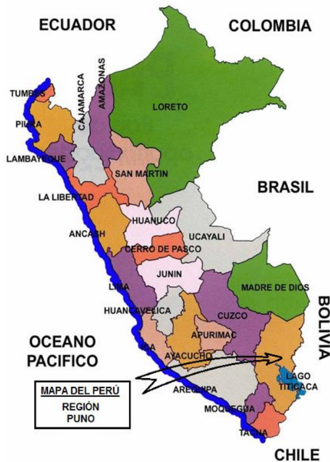
Figura 1: Mapa del Perú y ubicación regional

La región se encuentra aproximadamente a una altura que abarca desde los 3,820 m.s.n.m. a orillas del lago Titicaca, hasta niveles que superan los 5,000 m.s.n.m. en las alturas de las cordilleras occidental y oriental de los andes. Puno ocupa la alta meseta andina del Titicaca (que recibe este nombre del lago binacional homónimo) por lo que la altitud es un factor decisivo en la geografía puneña.