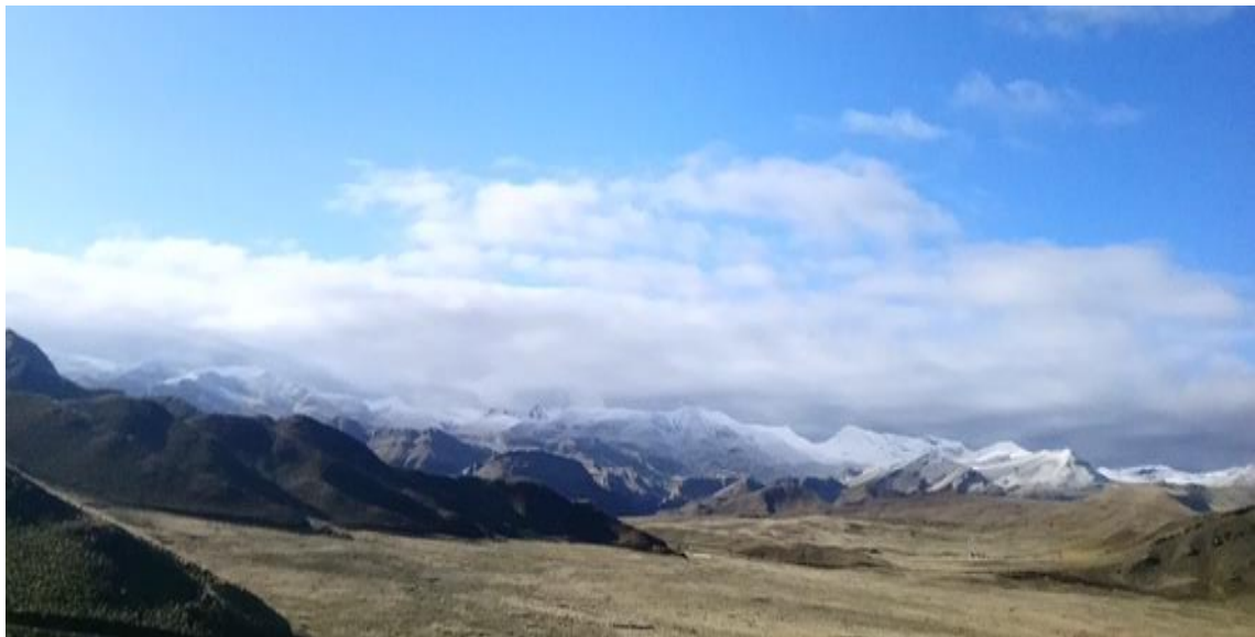
Figura 5: Topografía de la comunidad

En su topografía la comunidad campesina de Alto Ccollana presenta planicies y laderas las cuales están ubicadas las viviendas y las pampas por su clima favorable son adecuadas para la crianza de vacunos y ovinos, la parte de laderas y los cerros son para el pastoreo de las llamas y alpacas y ovinos.