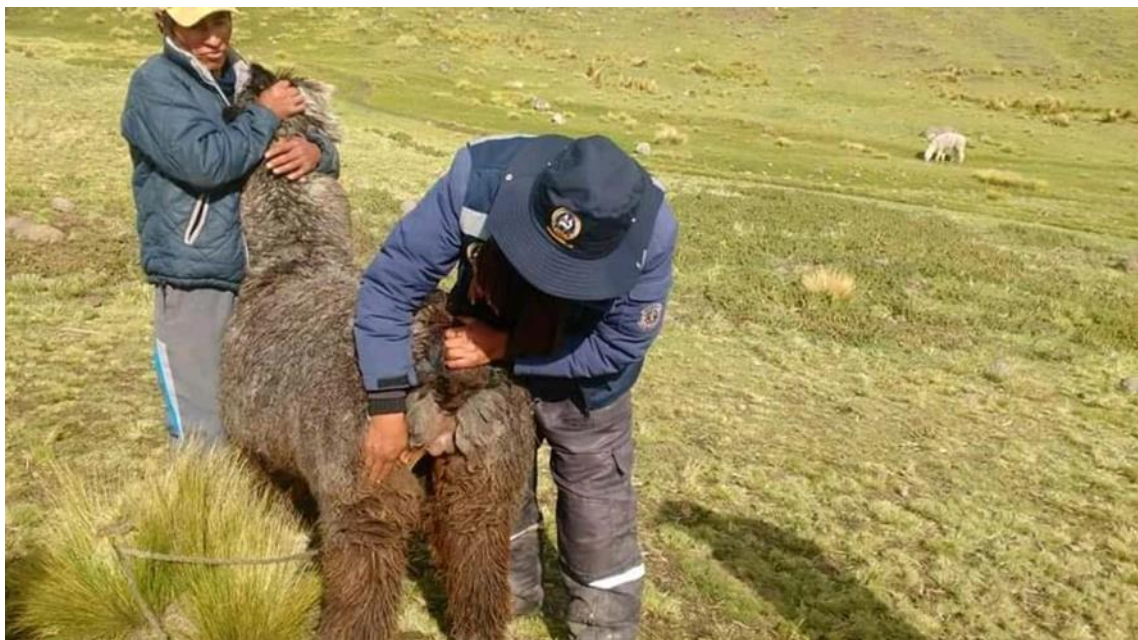
Figura 11: Selección de macho huacaya para empadre

Las alpacas servidas que muestren rechazo al macho serán consideradas como preñadas, en consecuencia, no es necesario repetir el servicio de las mismas. Durante los primeros 30 días de gestación es importante tener mucho cuidado en la crianza de las madres por la elevada tasa de muertes embrionarias. Las madres que están lactando a sus crías nacidas de la campaña de empadre anterior deben disponer de buena alimentación para evitar que disminuya su peso corporal. Por último, el tercio de gestación se debe realizar el diagnóstico de preñez (esquila).