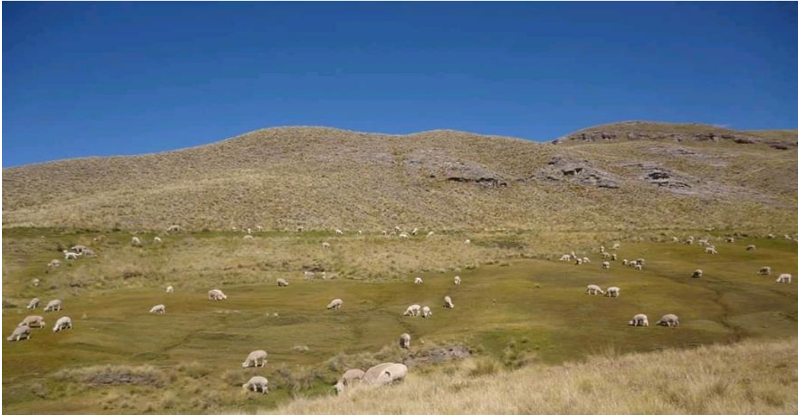
Figura 7: Pastoreo de ganados