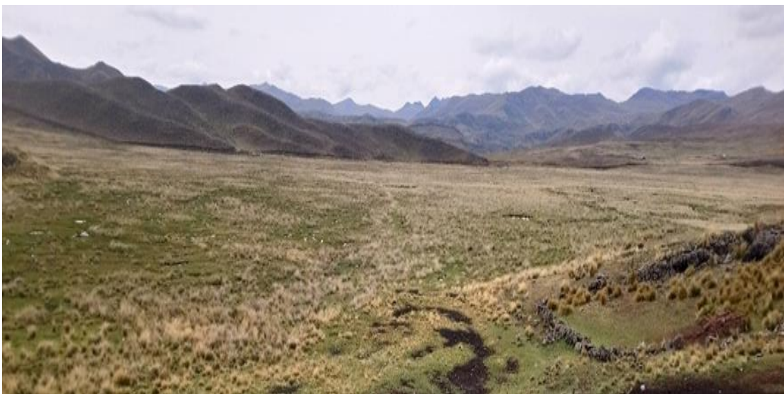
Figura 9: Lugares de pastoreo de llamas, alpacas y ovinos

El tipo de pastoreo, se desarrolla de forma tradicional y se basa en el pastoreo libre en praderas nativas. La producción forrajera, de acuerdo a lo manifestado por los criadores, sería escasa y además sujeta a fluctuaciones climáticas por presencia de heladas y sequías. Asimismo, de acuerdo a lo observado y aseveraciones por los criadores familiares, el pastoreo mayormente se da de forma libre y sin control. Las llamas vienen alimentándose casi siempre sin el cuidado de pastores, en algunos casos las llamas acompañadas del resto del rebaño, son necesariamente rotadas de acuerdo a la disponibilidad de forraje, distancia a la pradera a pastar. En cuanto las alpacas y las ovejas son pastadas bajo la vigilancia y la presencia de los pastores y el consumo del agua. Además, las alpacas y las ovejas son animales indefensos a sus depredadores como a los zorros, que generalmente las primeras víctimas vendrían a ser las crías.