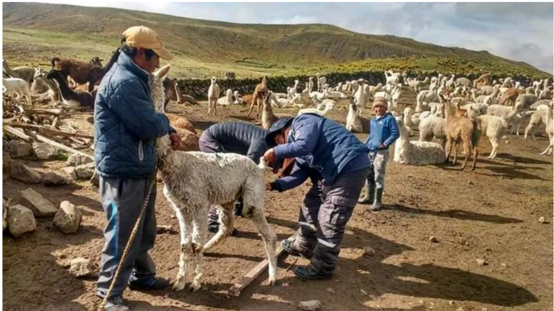
Figura 12: Selección de macho suri para empadre