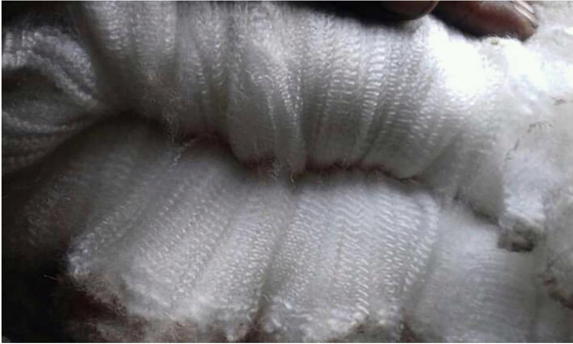
Figura 18: Observación de la fibra para esquila