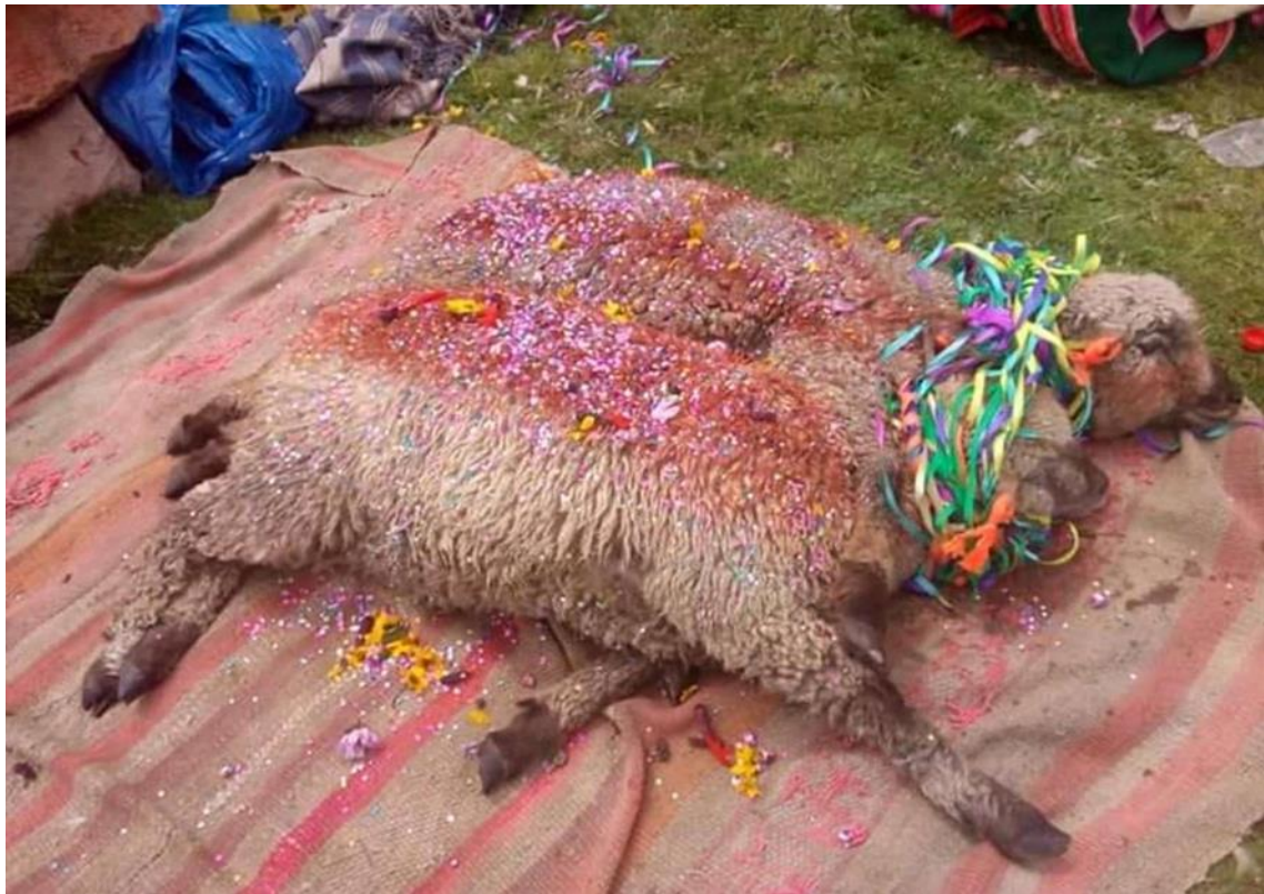
Figura 21: Illpay (emparejamiento de las ovejas)