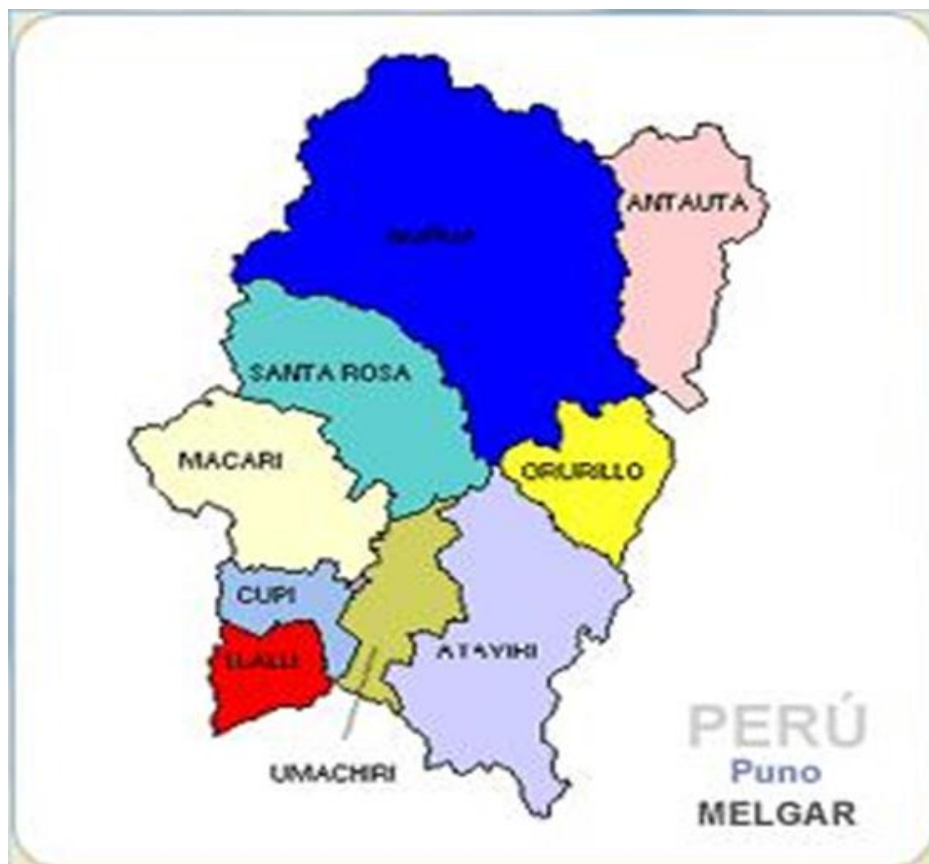
Figura 3: Mapa del distrito de Macarí