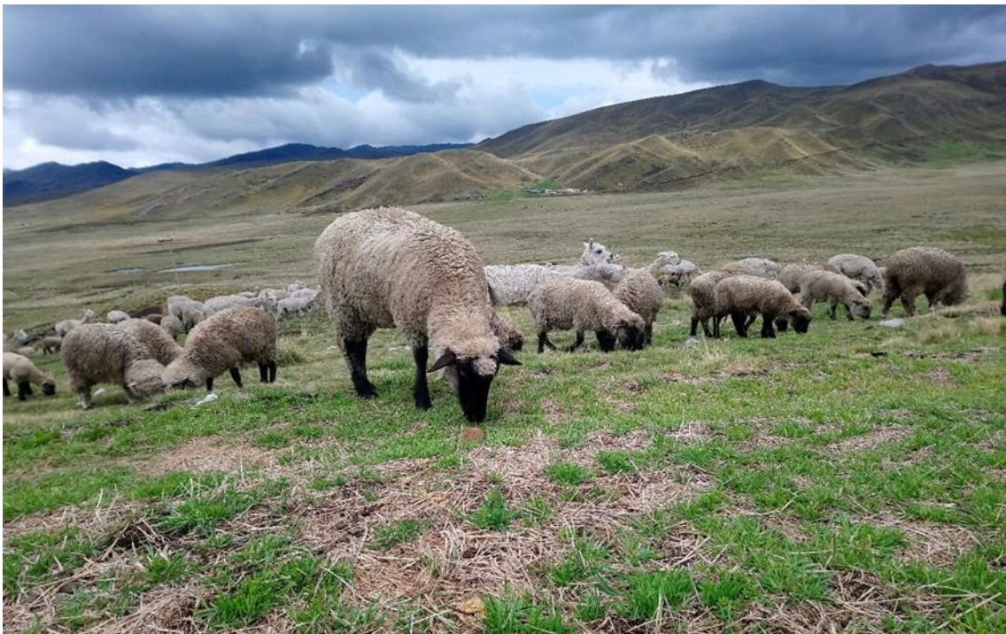
Figura 19: Ovejas de la raza Hampshire Down (caranegras) y Corriedale (merinos)

Tratamiento contra la pederá: esta campaña comprende sobre el cortado de las pezuñas largas o deformes en dos etapas en los meses de enero-febrero y octubre-noviembre.