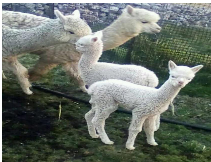
Figura 14: Crías de la raza de Huacaya

Por ello es recomendable que las crías cuenten con dormidero cercado, evitando su pérdida por la acción de depredadores durante la noche. Estos dormideros se construyen en las zonas abrigadas, ligeras, sin encharcamiento y les hacen cambio a las alpacas con crías cada 7 o 10 días. Asimismo, el pastor debe estar en constante vigilancia y observación de que las crías pueden lactar un promedio de 7 a 10 veces al día, acumulando un promedio de 2 a 3 minutos durante los primeros 10 días de nacida, la falta de ingestión de leche, así como los trastornos digestivos y pulmonares durante los primeros días de nacimiento, suelen ser las principales causas de mortalidad. Además, los pobladores acostumbran a realizar la marcación o registro de las crías pasando los dos meses de edad desde su nacimiento: señalada en las orejas (identificar con aretes plásticos y tatuar en la oreja derecha de los animales seleccionados, registrando el día, mes y año de nacimiento). Posterior a ello se realiza la selección de machos (identificar y diferenciar los animales de la manada, para poder realizar la primera selección de las crías en base al fenotipo, con especial rigurosidad en el caso de machos) y finalmente se trabaja en temas de sanidad, a través de las vacunas y dosificaciones, es importante hacer vacunar contra enterotoxemia y dosificar contra parásitos gastrointestinales.