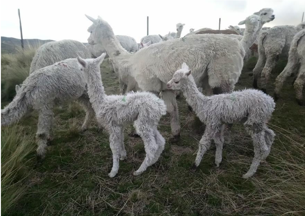
Figura 15: Crías de la raza suri