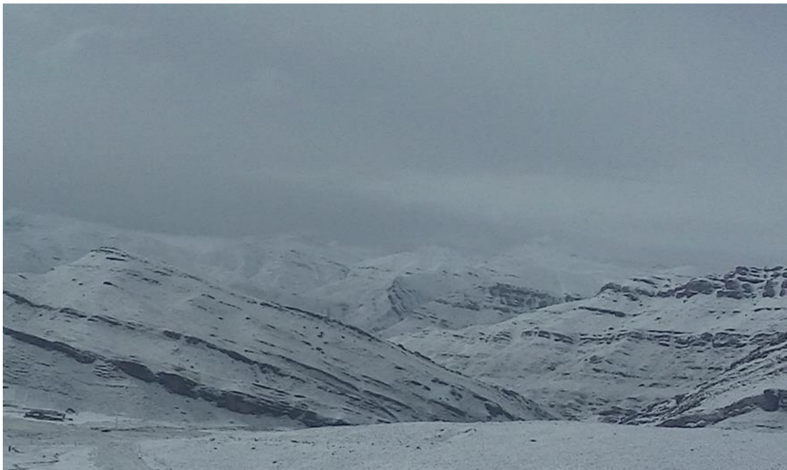
Figura 2: Lugar de pastoreo cubierto de nieve

Los fenómenos climáticos son especialmente agresivos para la economía de las familias altiplánicas. Heladas, granizadas, sequías e inundaciones son bastante frecuentes, hecho que, en diversos momentos, ha originado períodos de escasez para la población dependiente de la producción agro ganadera.