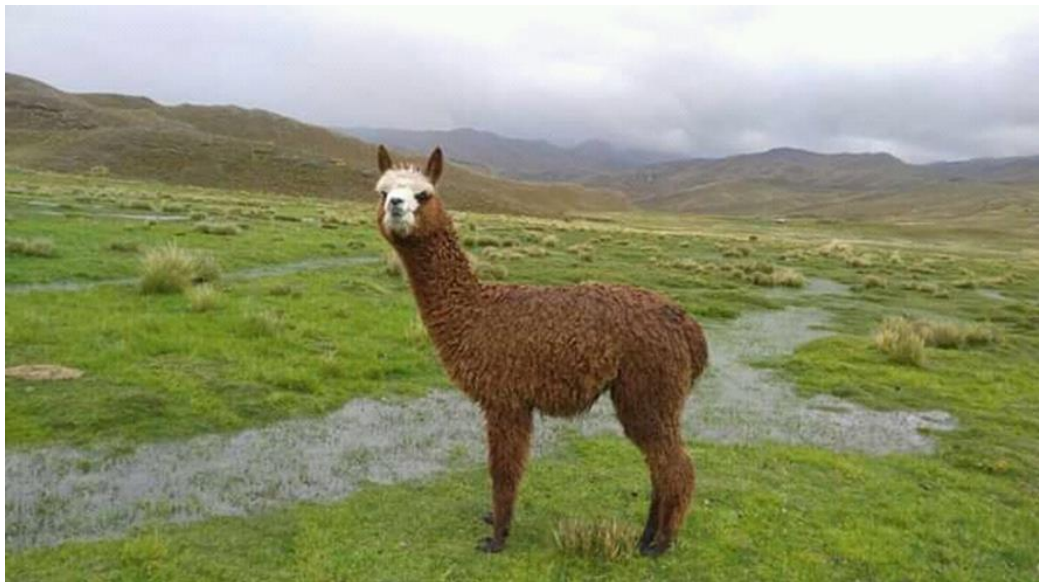
Figura 13: Alpaca preñada en pastoreo

“Cuando ya tenemos a las alpacas preñadas debemos tener mucho cuidado, más que todo sobre su alimentación y consumo de agua, por ello tenemos que separar de los reproductores es decir de los hañachu (machos) y de los machos de dos años (tuwis), tiene que tener un canchón para hembras preñadas, también debemos llevar a pastar donde hay abundante pastos y agua, porque una alpaca preñada que no tome agua durante el día puede generar su aborto. Las alpacas servidas que muestren rechazo al macho a ellos tenemos que separar primero porque ya están preñadas, en consecuencia, no es necesario repetir el servicio de las mismas. Los técnicos nos recomiendan que: durante los primeros 30 días de gestación es importante tener mucho cuidado con las madres por la elevada tasa de muertes embrionarias. Otro las madres que están lactando a sus crías nacidas de la campaña de empadre anterior le damos buena alimentación para evitar que disminuya su peso corporal. Y además nos dicen que se deben vacunar contra la enterotoxemia a las alpacas preñadas.