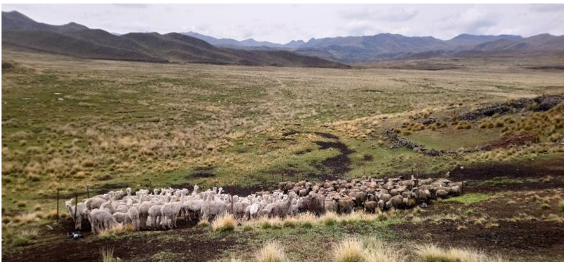
Figura 6: Llama y oveja en un solo canchón de alambrado

La producción de fibra se desarrolla con mayor énfasis en toda la comunidad, que además es la fuente de trabajo del hombre y genera la economía para la subsistencia de la unidad familiar. Esta actividad sustancial también se complementa con la venta de carne, cuero de las llamas y alpacas. Para el mercado interno es la carne de oveja. En esta comunidad crían pastos naturales en las partes con bofedales, para ello las familias llevan en caballos, en burros y en los últimos años en carretilla el estiércol de la oveja o de la llama y alpaca, en algunos casos hacen pernoctar a los animales en el lugar de cultivo de pastos mejorados para así evitar el trabajo del traslado, pero generalmente en la noche son guardadas en cercos de alambre o en canchones de piedra cerca de las viviendas para su seguridad de los animales, es más durante la noche los perros juegan un rol muy importante que es el resguardo de los animales para que no puedan ser robados por abigeos y devoradas las crías por depredadores como los zorros.