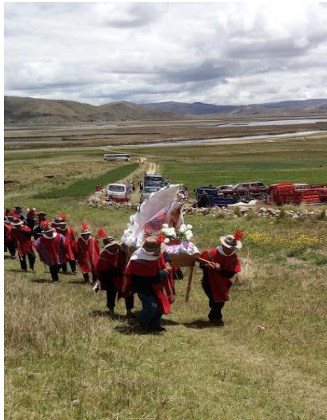
Figura 3 Procesión de la Virgen de Belén