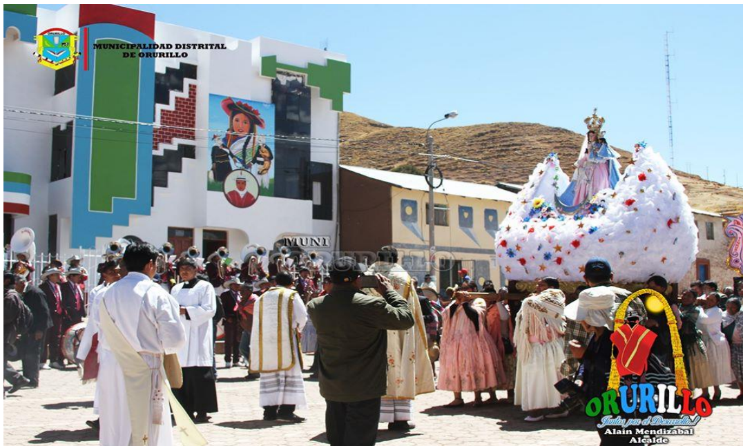
Figura 8 Procesión de la Virgen del Rosario