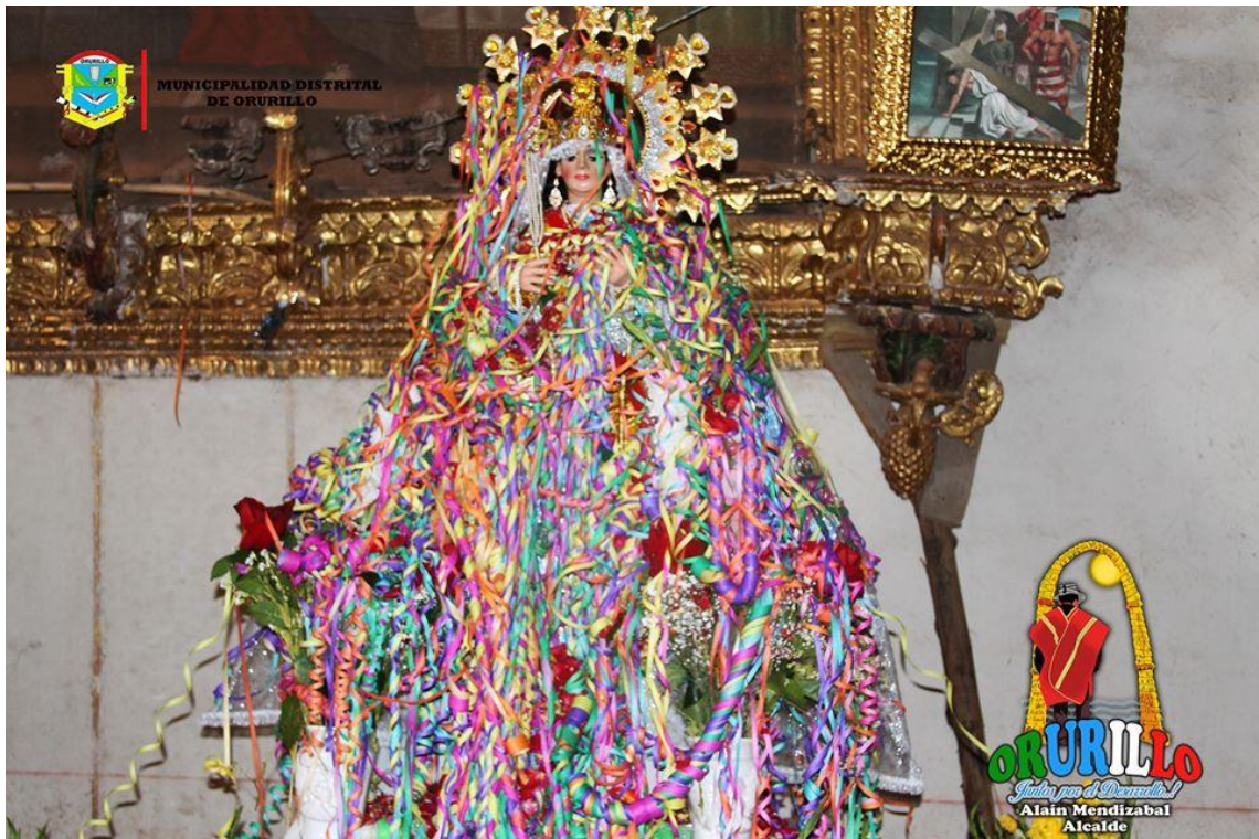
Figura 4 Día de compadres y comadres

ofrendan a los santos varones y en el día de las comadres, y mujeres ofrendan a las Vírgenes que se encuentran en la capilla de Orurillo en el día de la comadres.