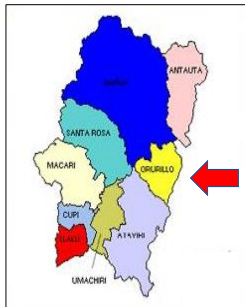
Figura 1. Mapa de ubicación