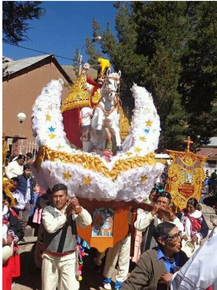
Figura 7 Procepción del Patrón San Santiago

milagroso, debido a que si una pasa el cargo se le realiza con milagro, por ello la población es muy creyente.