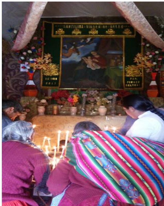
Figura 2 Veneración a la Virgen de Belén

plaza para tomar su respectivo carro y poder llegar a dicho cerro, todos llevan sus velas, otros llevan sus negocios para poder vender allí sus productos. La Virgen de Belén se encuentra pintada en este retiro, donde cuentan los pobladores que es milagrosa cuando uno pide de fe y devoción, pero también encontramos una representación de yeso de la Virgen donde los habitantes la veneran subiéndola al cerro y comienza la solemne misa con los pobladores, luego de ello danzan en veneración a la Virgen de Belén.