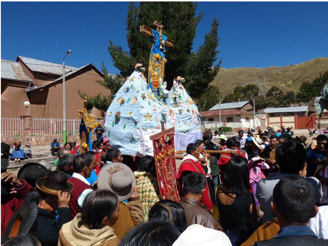
Figura 6 Festividad de las Cruces

templo Santa Cruz de Orurillo con la tradicional entrada de cirios, donde veneran todas cruces, y estas se encuentran con serpentinas, misturas, flores entre otras cosas, como muestra de cariño y devoción hacia la Santísima Cruz. Terminada la misa los pobladores hacen una procesión alrededor de toda la plaza y la población danza con las diferentes bandas que traen los alferados, mientras otros aprovechan esta pequeña festividad para visitar a sus familiares en el cementerio y compartir un momento con la familia.