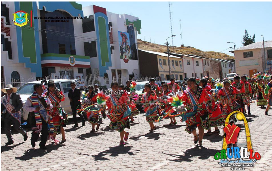
Figura 9 Pasacalle en veneración a la Virgen del Rosario