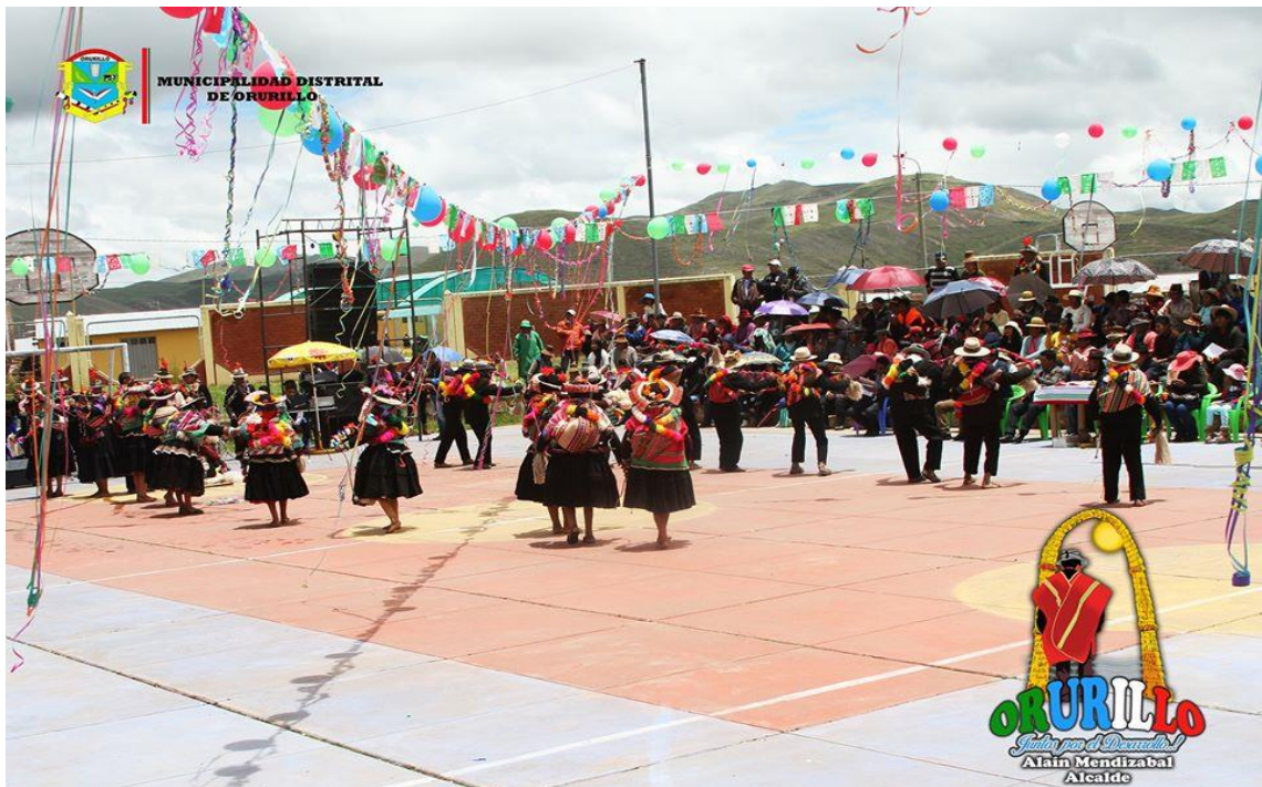
Figura 5 Danza "Los Kajchas de Orurillo"

a los Varayoc o “ Chajra alcaldes ” con ofrendas como mistura, serpentina y flores. Posteriormente las autoridades se ponen a bailar al ritmo de los Kajchas . Asimismo, hoy en día la municipalidad de Orurillo promueve el concurso de Kajchas de Orurillo, para evitar su extinción y este evento tiene gran acogida por la población, donde todos participan. (Tacca, 2014, p. 05)