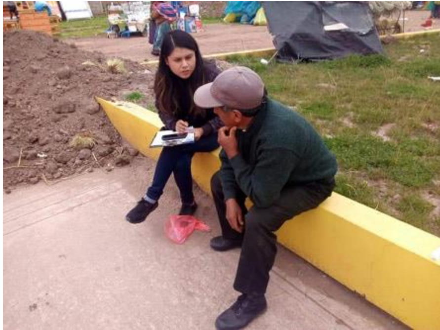
Figura 10 Entrevista a un poblador