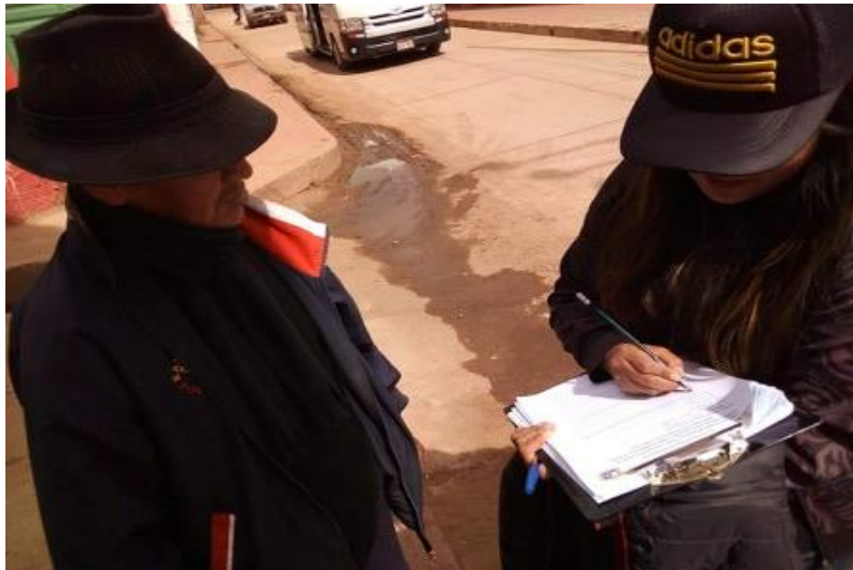
Figura 11 Encuesta a un portador directo