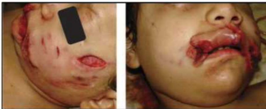
Figura N° 2: Niño con heridas que comprometen tercio medio e inferior (Velázquez et al. , 2013).