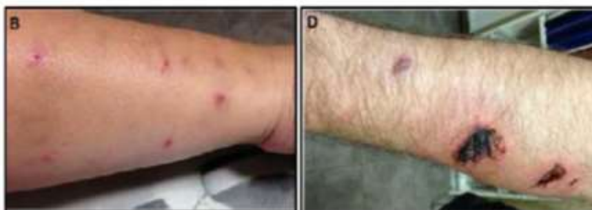
Figura N° 1: (B) Paciente con lesiones puntiformes en miembro superior; (D) paciente con lesiones en proceso de cicatrización en miembro inferior (Palacio et al., 2005).

Niños con edad menor a 5 años tienen mayor riesgo de sufrir mordida por perro y frecuentemente las heridas se presentan en la cara. En los niños a diferencia de los adultos la región del cuerpo más afectada es la región facial (Velázquez, Flores, & Pedroso, 2013).