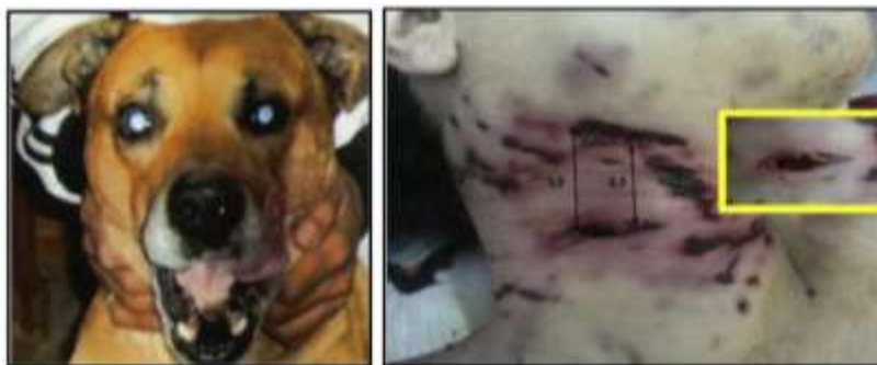
Figura N° 3: Perro visto en escena de muerte. Lesiones puntiformes y lacerantes cervicales laterales. Distancia de heridas lacerantes correspondiente a distancia de caninos en paciente fallecido por mordida de perro (Haj Salem et al., 2013).

A lo anterior se suma el riesgo de contraer infecciones virales como la rabia, causada por un virus neurotrópico que se halla en la saliva de los animales infectados: cerca del 90% de los casos de esta enfermedad son debidos a la transmisión por perros. En humanos presenta un cuadro clínico muy fuerte que se inicia con dolor, una especie de angustia en la zona de la mordedura, luego, el virus va escalando por el sistema nervioso en dirección al cerebro, empiezan la fiebre y el malestar, la garganta se inflama y se paraliza. Finalmente, el virus llega al cerebro y provoca una encefalitis, con parálisis, dolores y síntomas de agresividad, con necesidad de morder. Es el medio que utiliza el virus para buscar nuevas víctimas, ya que se transmite por la saliva. Después de aparecer los primeros síntomas, la muerte ya es inevitable (Carbajal & Stella, 1995).